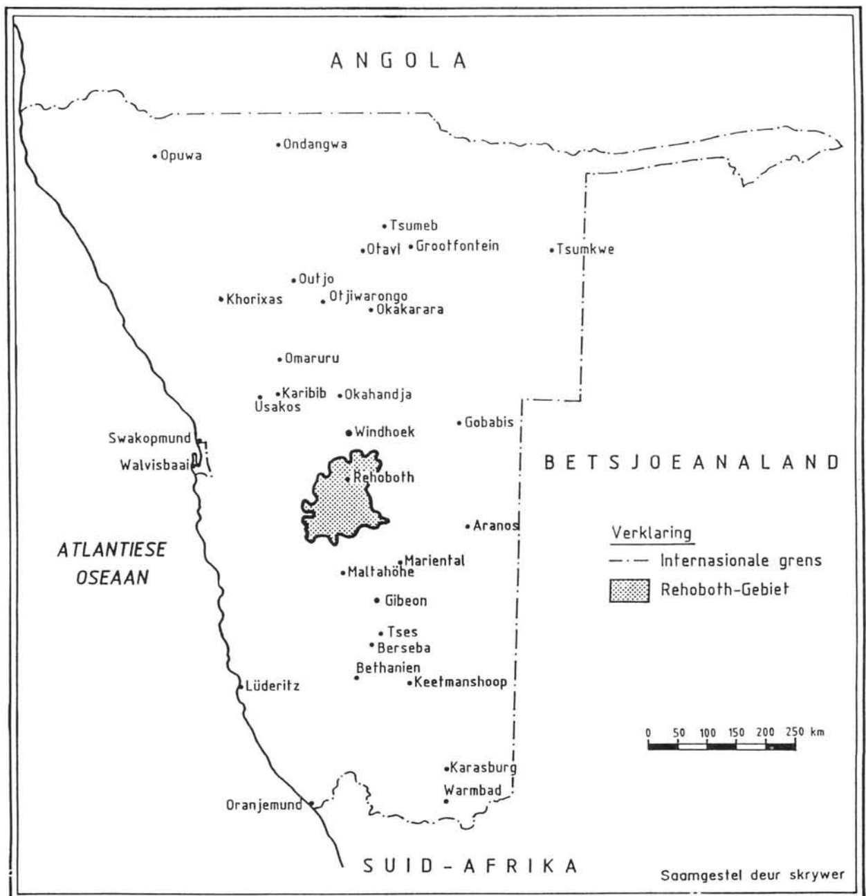
Ligging van die Rehoboth-Gebied in Suidwes-Afrika (Namibië)

soek om tydelik die bestuur van die Rehoboth-Gebied oor te neem. 9