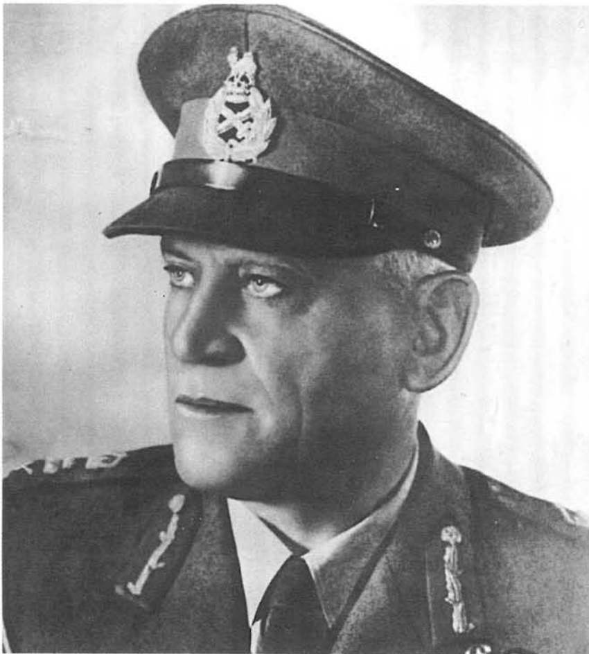
Pierre van Ryneveld