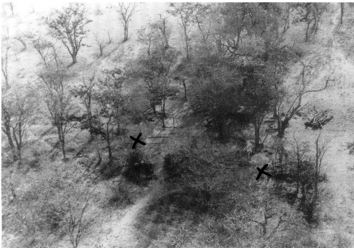
Lugfoto van Umgulumbasche - die eerste SWAPO-basis wat deur Suid-Afrikaanse magte aangeval is.

PLAN se operasies was hoofsaaklik die resultaat van die steun wat SWAPO van die bevolking verkry het, wat op sy beurt die gevolg van 'n effektiewe politieke mobiliseringsproses en die effektiewe funksionering van die revolusionêre politieke en regsordes was.