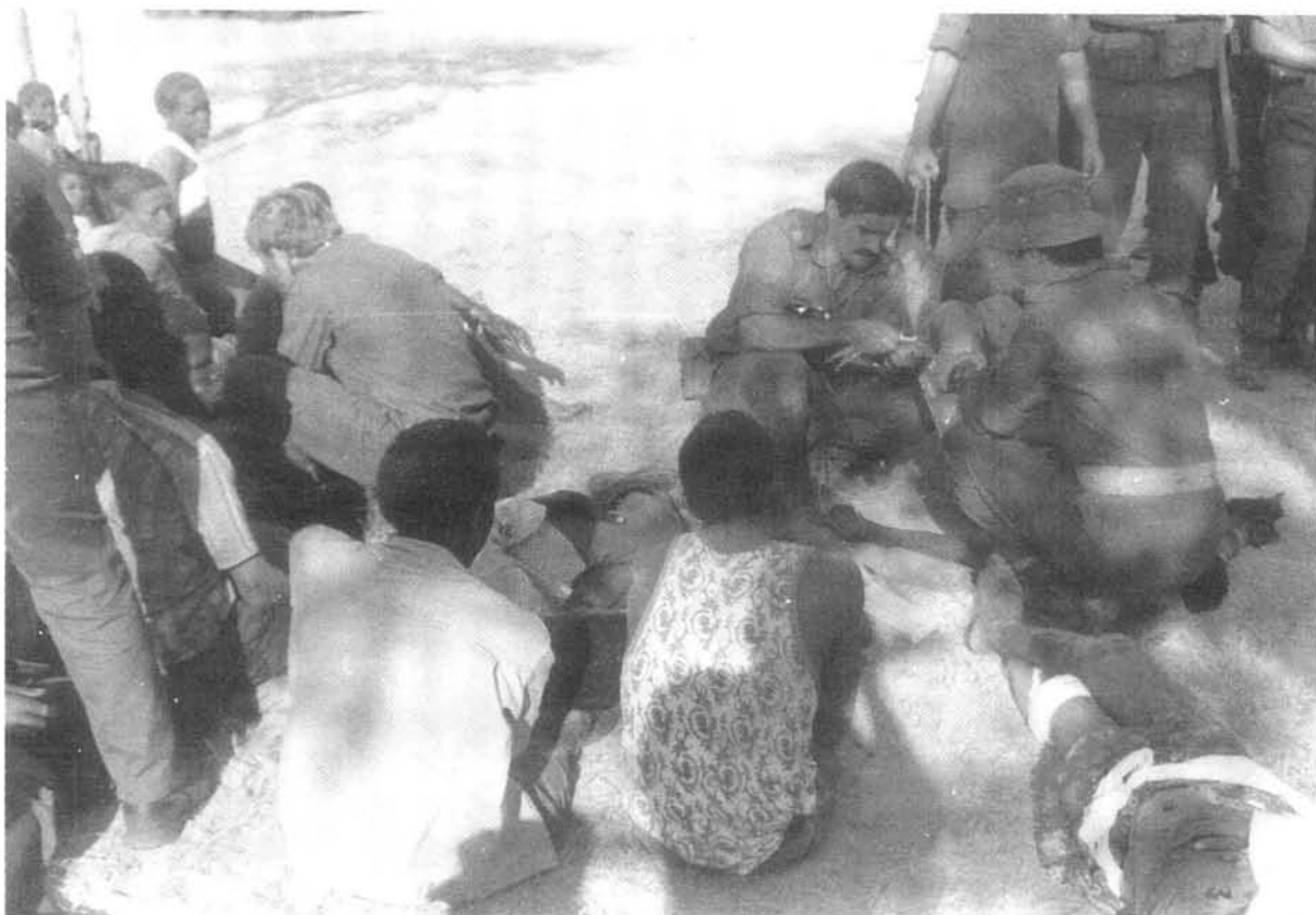
PLAN-lede wat in 'n aanval deur die Suid-Afrikaanse Weermag op hul basis krygsgevangene geneem is.

SWAPO se propaganda gemaak. 137 Dit was egter die SA Weermag se verklaarde beleid dat géén wandade teen die bevolking gepleeg mag word nie. Waar bewese gevalle van wandade voorgekom het, was die skuldiges deur 'n bevoegde militêre krygsraad verhoor.