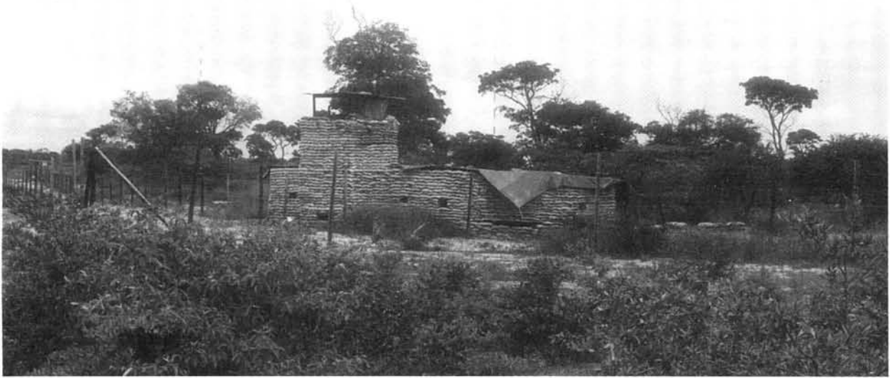
'n "Bunker" vir die beskerming van die Suid-Afrikaanse basis te Rundu.