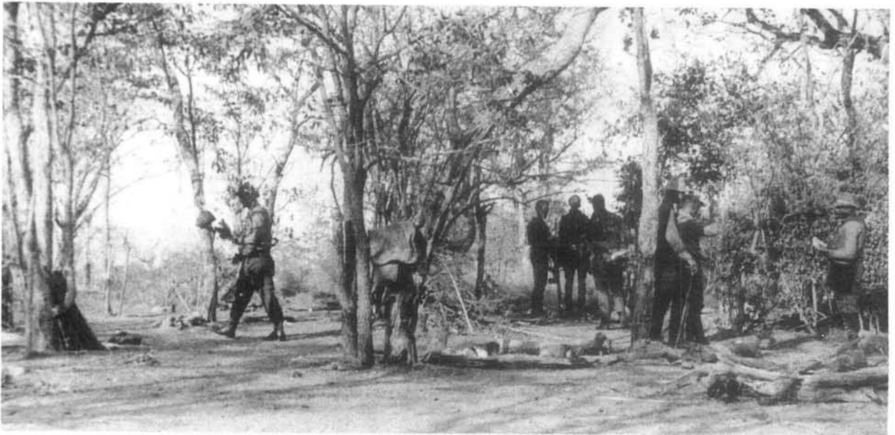
Suid-Afrikaanse magte tydens opruiming na die aanval op Umgulumbasche.