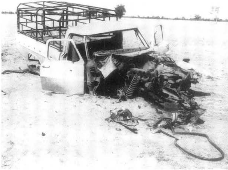
'n Bakkie wat op 7 September 1982 in Wes Ovambo deur 'n myn vernietig is. Een burgerlike is gedood.