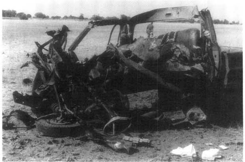
'n Bakkie van 'n lid van die plaaslike bevolking wat in 'n landmynontploffing in Ovamboland vernietig is.

revolusionêre regsorde om bepaalde gedragsnorme aan die bevolking voor te hou om toe te sien dat oortreders met die dood gestraf is, ten einde te verseker dat SWAPO se ideale en doelstellings deur die bevolking uitgeleef en oortreders en "puppets" tot die absolute minimum beperk word. Die revolusionêre regsorde het absolute gehoorsaamheid van die bevolking vereis. Dit het revolusionêre gesag vereis wat berus het op die aanvaarding van die bevolking dat die gesag legitiem was. 87 Die revolusionêre mobiliseringsproses het veral die Ovambovolk van die revolusionêre motief van bevryding oortuig - die revolusionêre regsorde het gepoog om gehoorsaamheid aan revolusionêre voorskrifte af te dwing. 88 Sodoende is revolusionêre regsnorme in die meeste gevalle gehoorsaam omdat dit afgedwing is, asook dat die bevolking presies gedoen het wat SWAPO van hulle