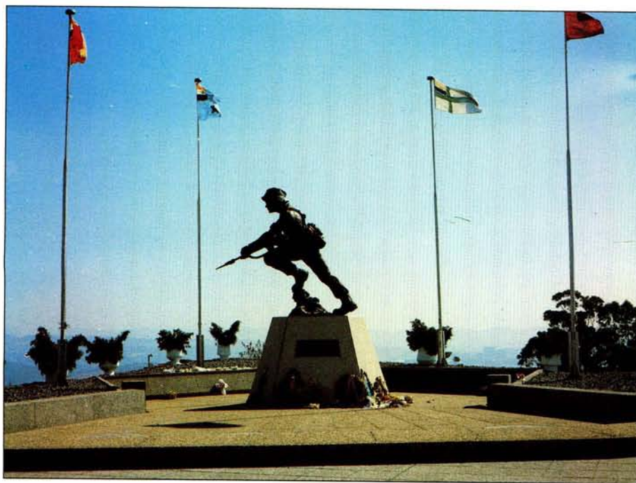
Die Gedenkteken te Fort Klapperkop, Pretoria.