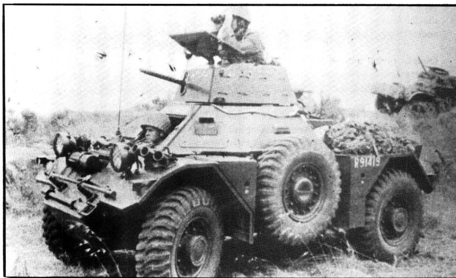
'n Ferret verkenningsskar tydens opleiding.