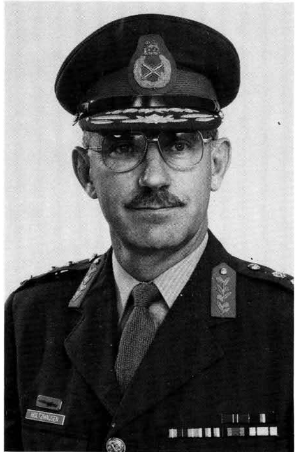
Lt genl Raymond Holtzhausen is 'n Bloemfonteiner en 'n Grey Kollege-produk. Hy glo dat sy vorming in 'n dubbel-medium skool daartoe bygedra het dat hy altyd net sy beste wou gee, en maklik met ander kon saamwerk. Hy het by kerslig studeer en moes daagliks 34 km skool toe en terug per fiets aflê

was en later ook een van die slegs twee generaals was wat as bevelvoerende generaal 1 SA Korps gedien het. En Lt genl Bisch Bisschoff, ook 'n Trompsburger soos genl Lloyd, is tans Hoof van Staf Operasies nadat hy al vyf bevelsposte beklee het, nl as bevelvoerder Artillerieskool, bevelvoerder 2 Militêre Gebied (SWA), bevelvoerder SA Leërkollege, bevelvoerder Noord-westelike Kommandement en bevelvoerende generaal van Kommandement Oos-Transvaal.