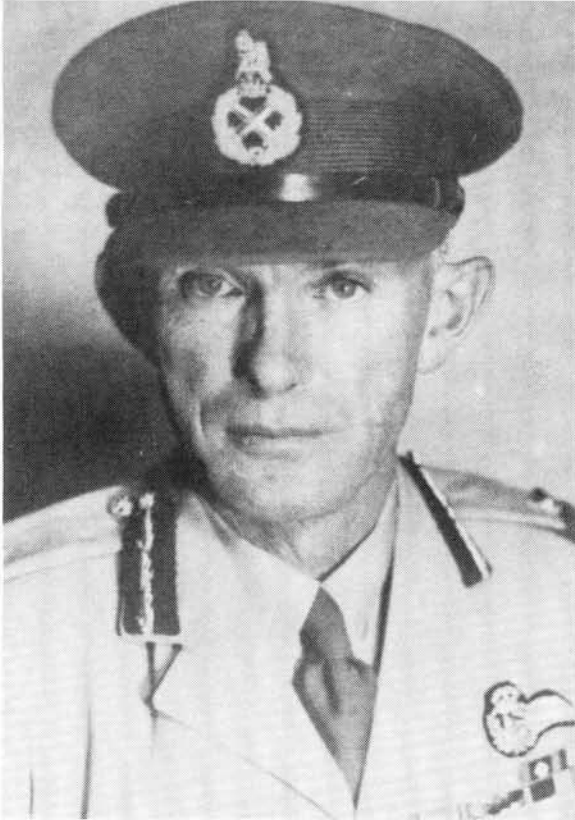
Genl Dan Pienaar

Genl Koos de la Rey, gebore naby Winburg in 1847 het deelgeneem aan die Basoetoe-oorlog en die Sekhukune-veldtog. Alhoewel hy gekant was teen die verklaar van die Tweede Vryheids-oorlog het hy uit pligsbesef deelgeneem en homself onderskei as 'n uitstaande militêre leier. Soos genl De Wet was hy 'n meester in die kuns van taktiek wat spoed en verrassing behels het. Ook as politikus het hy sy merk gemaak as lid van die Transvaalse Parlement, die Nasionale Konvensie, die Unie Senaat en die Verdedigingsraad.