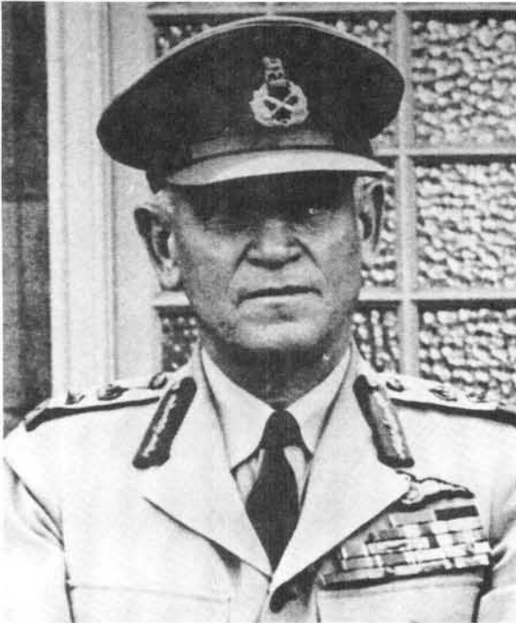
Genl Sir Pierre van Ryneveld is gebore op Senekal in 1891 en het aan Grey Kollege gematrikuleer. Hy het deelgeneem aan die eerste vlug van Engeland na Kaapstad in 1920 en het die eerste valskermssprong in Suid-Afrika uitgevoer in 1927 en die eerste ononderbroke vlug van Kaapstad na Pretoria in 1928 voltooi in 'n rekordtyd van 6 ure en 55 minute. Hy het die S.A. Lugmag tot stand gebring en was Hoof van die Generale Staf en Opperbevelhebber van die Unie-Verdedigingsmag tydens die Tweede Wêreldoorlog

Onder Suid-Afrika se voorste militêre leiers in Wêreldoorlog II was daar vier generaals wat as baie belangrik vir Suid-Afrika se deelname aangesien word, omdat hulle die bevelhebbers van Suid-Afrikaanse divisies in operasies teen die vyand was. Twee van hulle, nl genl George Brink en genl Dan Pienaar was gebore Vrystaters: d.w.s. 50%. En dit terwyl genl Pierre van Ryneveld, die Vrystater wat die SA Lugmag begin het, sedert 1933 hoof van die generale staf en in Wêreldoorlog II opperbevelvoerder van die Unie-Verdedigingsmag was.