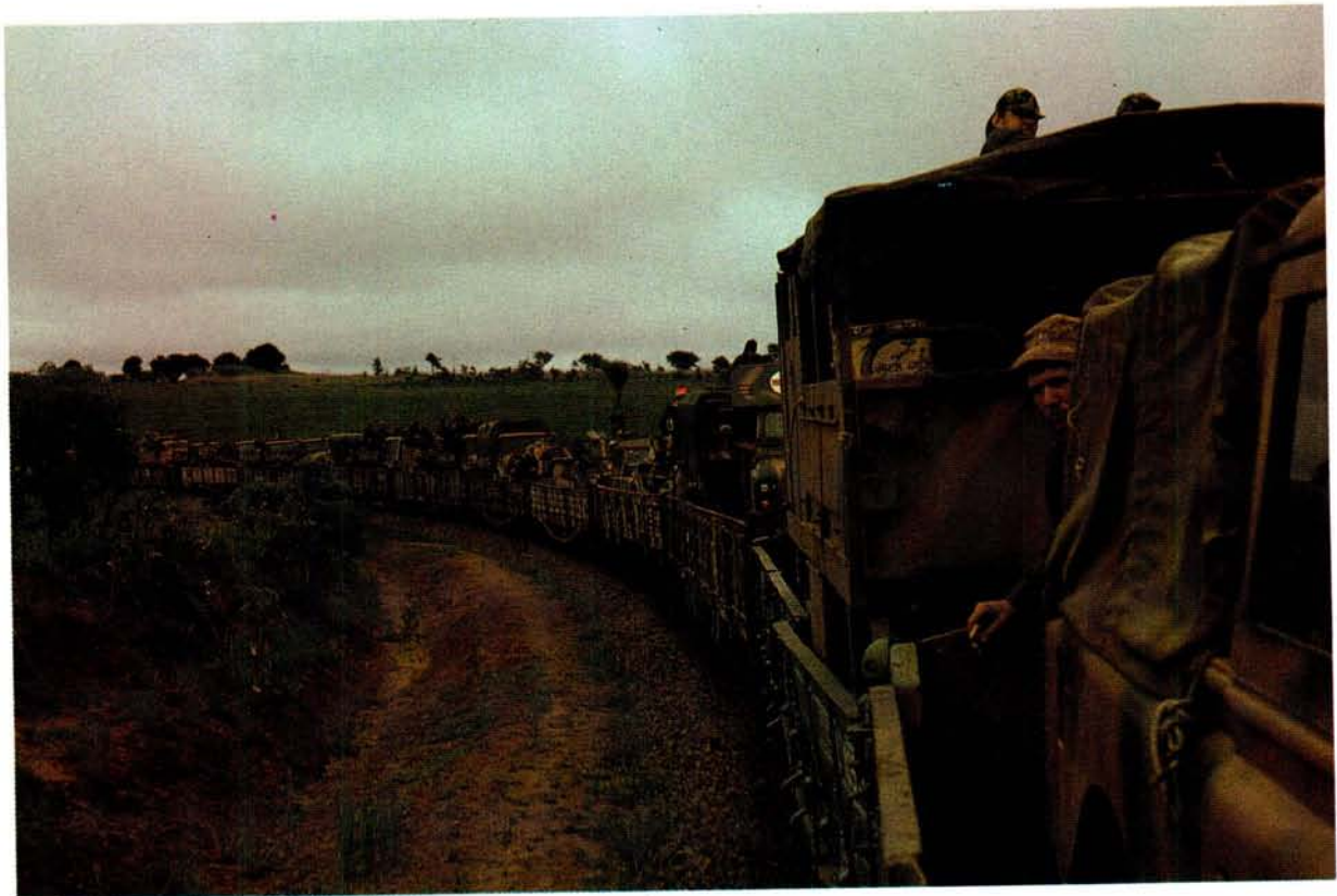
Kapt Laubscher en sy personeel is vanaf General Machado per trein na die front.