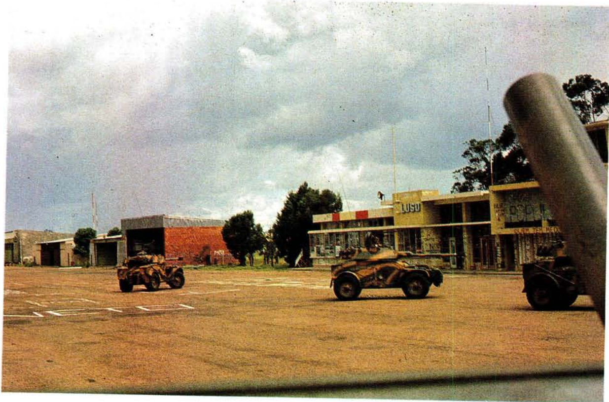
Luso se vliegveld.