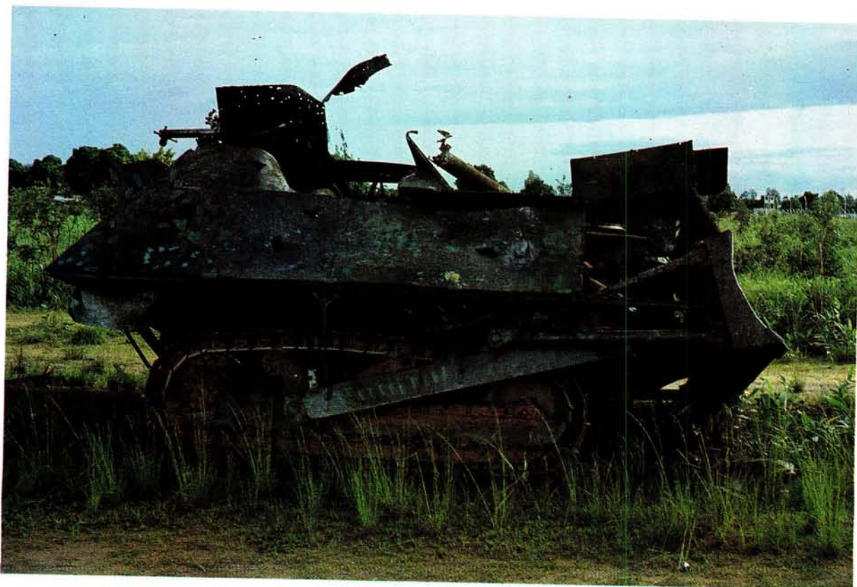
Die sogenaamde "Luso-monster" was 'n stootskraeper wat die vyand gepantser en bewapen het.