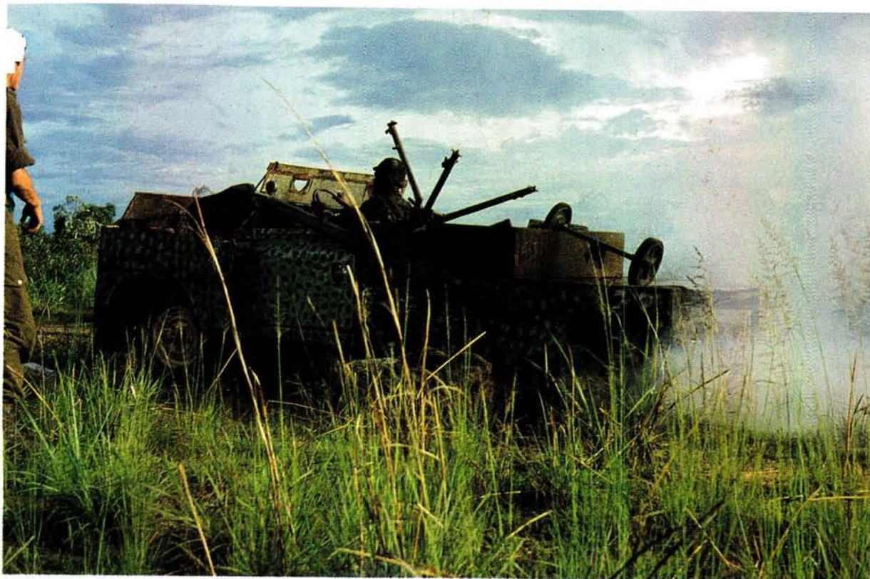
Gebulte vyandelike Jeeps wat in die spore van die "Luso-monster" gevolg het om Veggroep X-Ray se vegspan op die vliegveld aan te val.