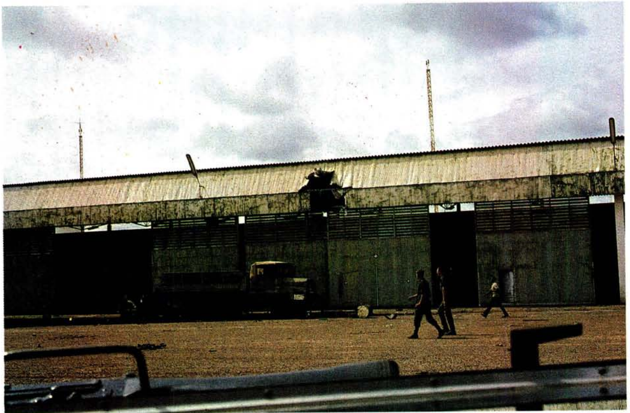
Die gat in die dak van hierdie vliegtuigloods op Luso se vliegveld is veroorsaak deur 'n verneukmyn wat 'n Unita-soldaat ontsteek het.