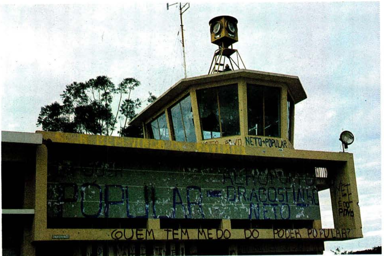
Graffiti op mure, soos hierdie op die beskadigde beheertoring van die vliegveld by Luso, was 'n uitstaande kenmerk van die burgeroorlog.