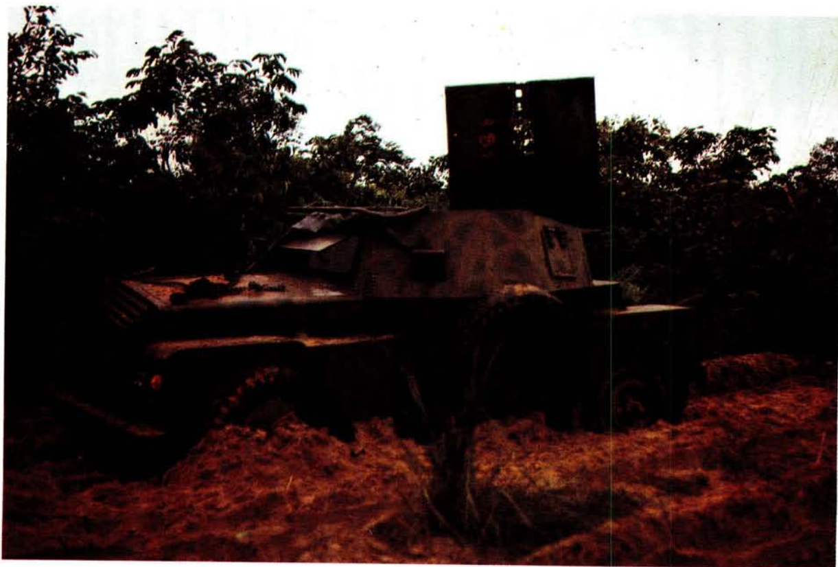
Hierdie Brits-vervaardigde "Humber"-pantserkar het die MPLA se aanmars gelei tot by Cangonga, waar dit tydens die eerste kontak met die Veggroep X-Ray buite aksie gestel is.