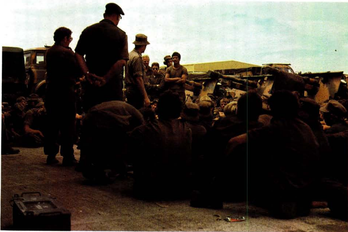
Kmdt C.P. (Joffel) van der Westhuizen, die regimentsbevelvoerder, spreek die battery se personeel op Grootfontein, waar hulle gemobiliseer het, toe.