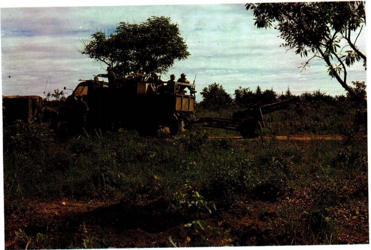
Die foto is kenmerkend van die terrein waarin Veggroep X-Ray geopereer het. Hier is 'n 88 mm snelvuurkanon agter sy trekker.