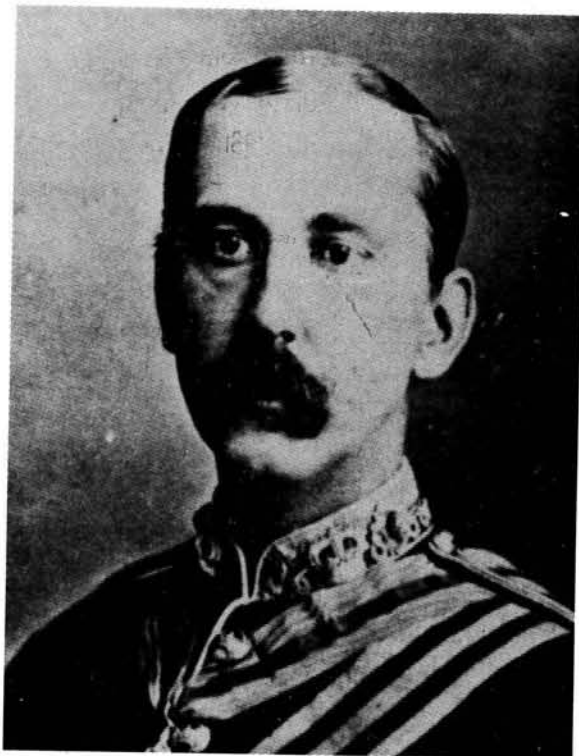
William Owen Lanyon (1842–1887)

Uiteraard het Griekwaland-Wes hierdie onrus nie vrygespring nie. Duisende nie-blanke werkers op die kleims vanuit alle dele van Suider-Afrika, sowel as die onbeheerde verkoop van vuurwapens aan nie-blankes, om só die kolonie se wankelrige ekonomie aan te help, het 'n definitiewe gevaar geskep: nie net vir die regering van Griekwaland-Wes nie, maar ook vir die ander state in Suider-Afrika. 12 Bewus van hierdie gevaar het Southey reeds in 1875 'n poging aangewend om 'n vrywilligersmag vir Griekwaland-Wes tot stand te bring. 13 Gebrek aan belangstelling, waarskynlik 'n gevolg van die ongewildheid van die Southey-administrasie by die delwersbevolking, het egter gelei tot die mislukking van dié poging.