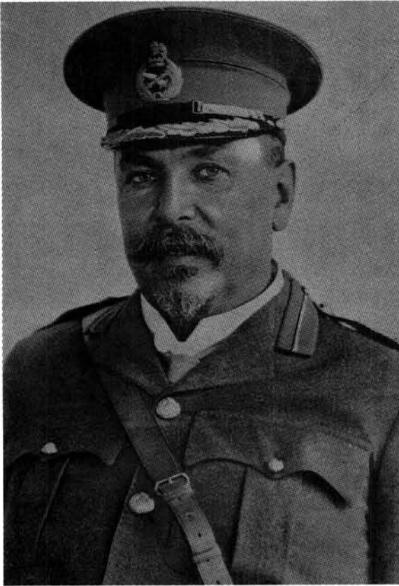
Generaal Louis Botha (1862–1919)

ties, maar terselfdertyd onpartydig en onbevooroordeeld. Hy het ook beklemtoon dat hy sy verhaal eers geskryf het nadat hy al die beskikbare boustowwe sorgvuldig bestudeer, gewik en geveeg het.