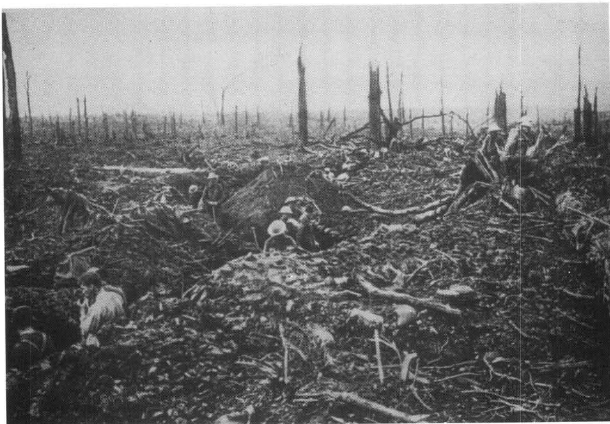
Delvillebos

Daar is voldoende aandag aan dié gedeelte van die veldtog in Duits Oos-Afrika gewy wat op die oornam van die opperbevel oor die geallieerde magte deur lt-genl J.C. Smuts (1870–1950), in Februarie 1916, gevolg het. Soos bekend het genl Von Lettow Vorbeck en sy troepe die wapens op 25 November 1918 by Abercorn neergelê.