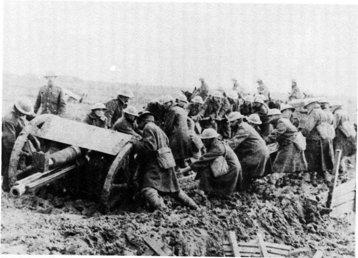
Suid-Afrikaanse Kanoniers aan die westelike front worstel om 'n artilleriestuk deur die modder te sleep.

gens aangevul en op 4.12.1917 is die brigade, naby Quentin Ridge, terug aan die front waar patrolliewerk deur slegte weersomstandighede belemmer is. Op 4.12.1917 was die brigade se sterkte 148 offisiere en 3621 manskappe en op 23 Januarie 1918, na groot verliese, nog 79 offisiere en 1661 manskappe. Op 31.1.1918 is die Suid-Afrikaanse vrywilligers uit die loopgrawe om 'n maand te rus. Op 17.2.1918 is 'n gedenkdienst by Delvillebos gehou.