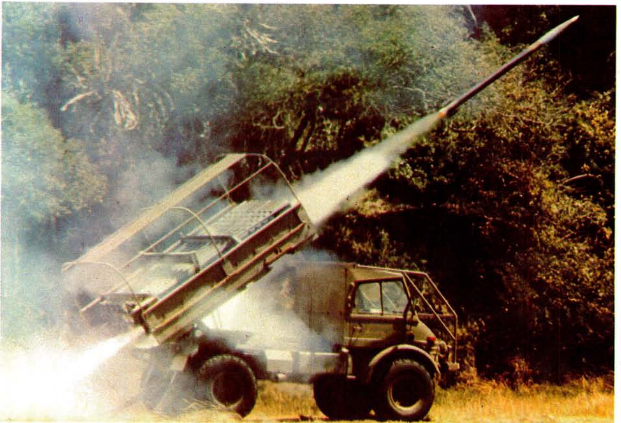
Die Valkiri 127-mm meervoudige vuurpyllanseerder is plaaslik vir die Suid-Afrikaanse Leër ontwikkel as teenvoeter vir die Russiese BM-21 stelsel wat die Suid-Afrikaanse magte probleme gedurende Operasie Savannah besorg het. Die Valkiri is sedert 1981 met groot welslae in operasies aangewend