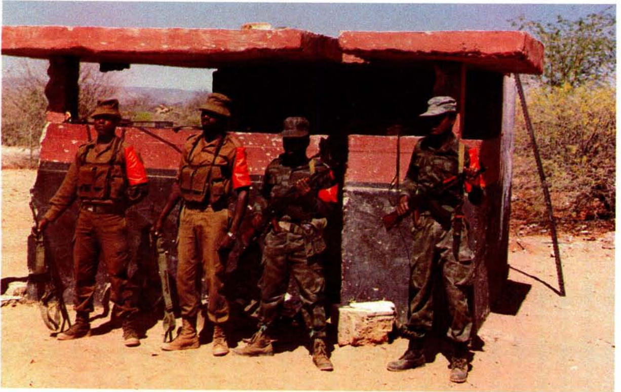
Militêre personeel van die Gesamentlike Militêre Kommissie wat op 30 Augustus 1988 tot stand gekom om die onttrekking van Suid-Afrikaanse magte aan Angola en die staking van vyandelikhede te monitor. Die foto is by 'n grenspos naby Ruacana geneem