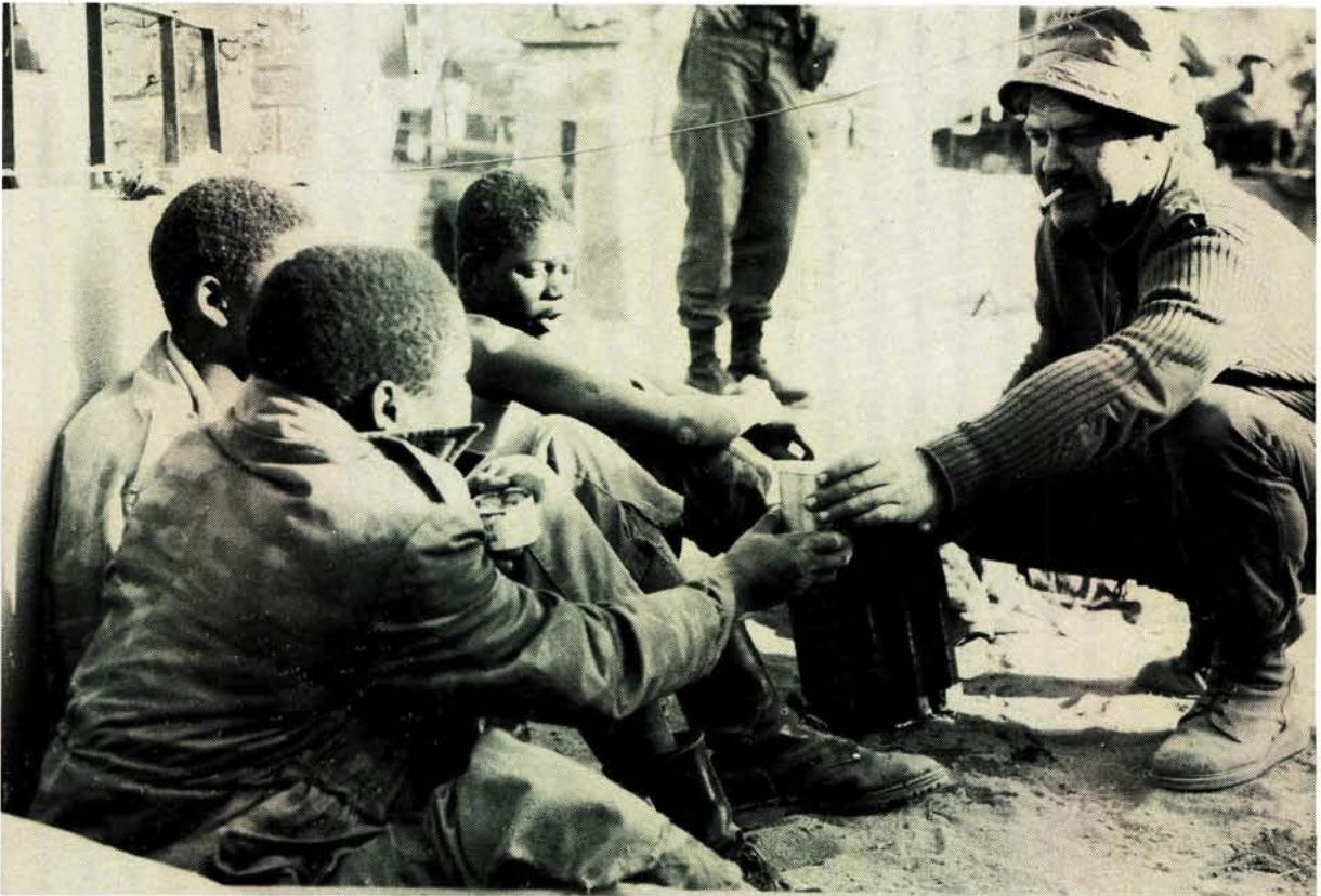
'n Offisier van die Suid-Afrikaanse magte gee kos en water aan drie SWAPO-terroriste wat tydens 'n voorsprongoperasie in Angola gevang is

122mm vuurpyle. Een hiervan het deur die dak van 'n kaserne gedring en 10 soldate gedood.