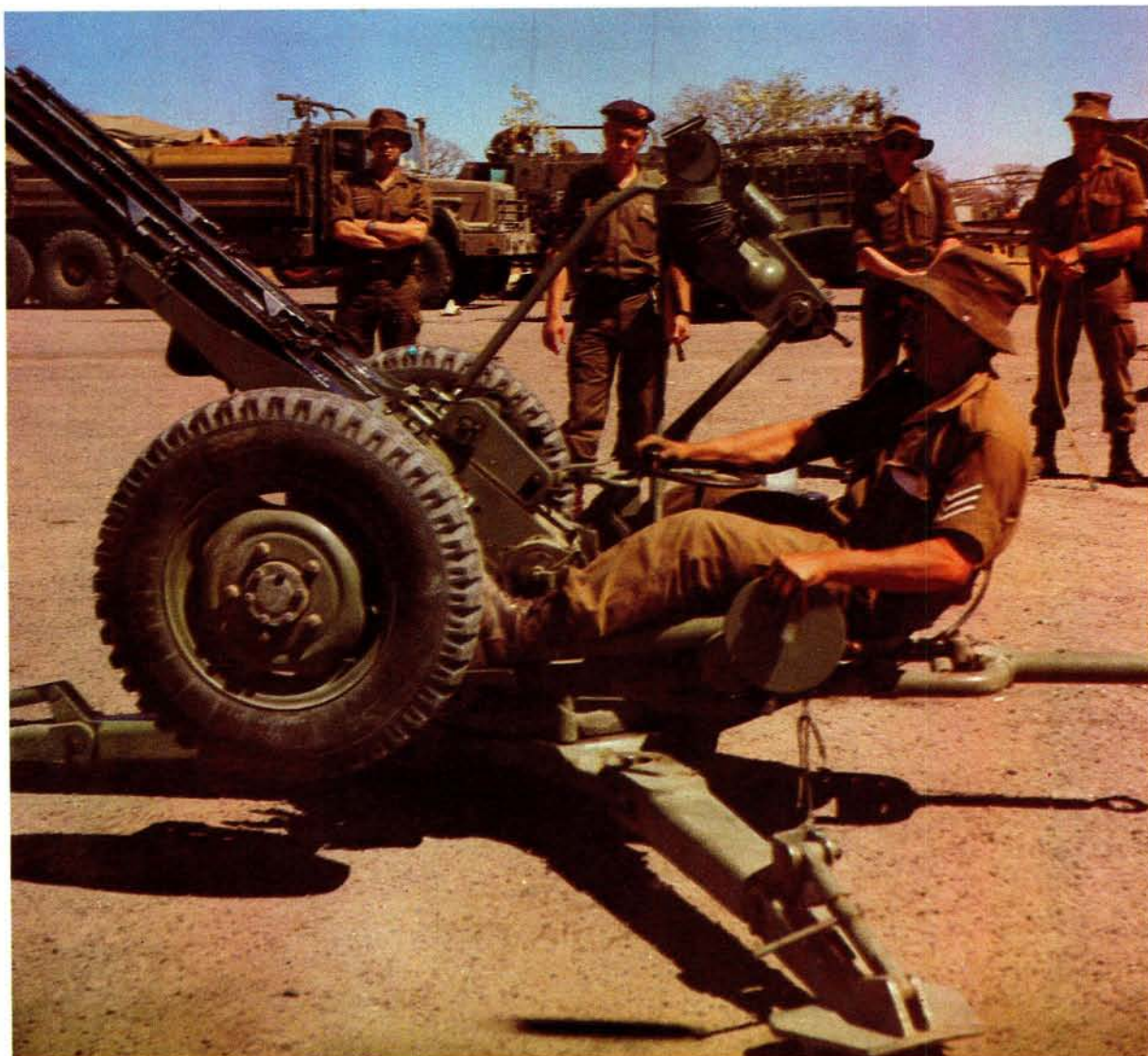
Lede van die Suid-Afrikaanse magte by 'n lugafweerkanon wat in 'n operasie van SWAPO gebuit is

heidsmagte se 21 ongevale in Operasie Askari is tydens hierdie botsing gely.