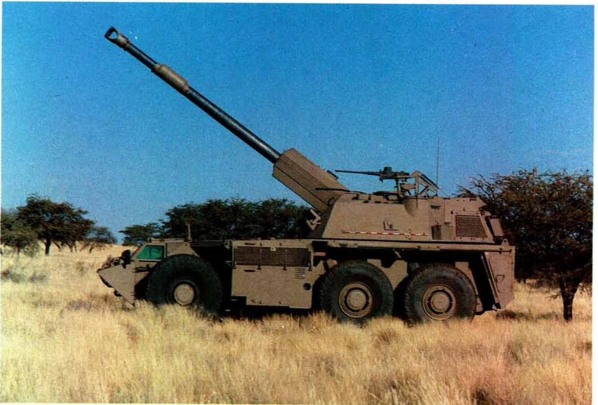
Die G6-sefaangedrewe medium kanon is deur KRYGKOR ontwikkel en is gebore uit die ervaring van die Suid-Afrikaanse Artillerie in Operasie Savannah en latere krygsoperasies