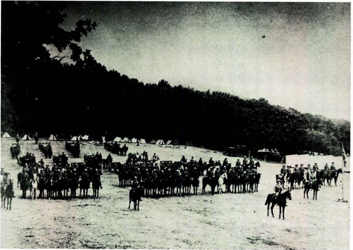
Die kamp van die THA te Grooteschuur (Kaapstad) net voor hul vertrek na Duits-Suidwes-Afrika in Januarie 1915

ingevolgte die mandaatstelsel onder SA se administrasie geplaas is.