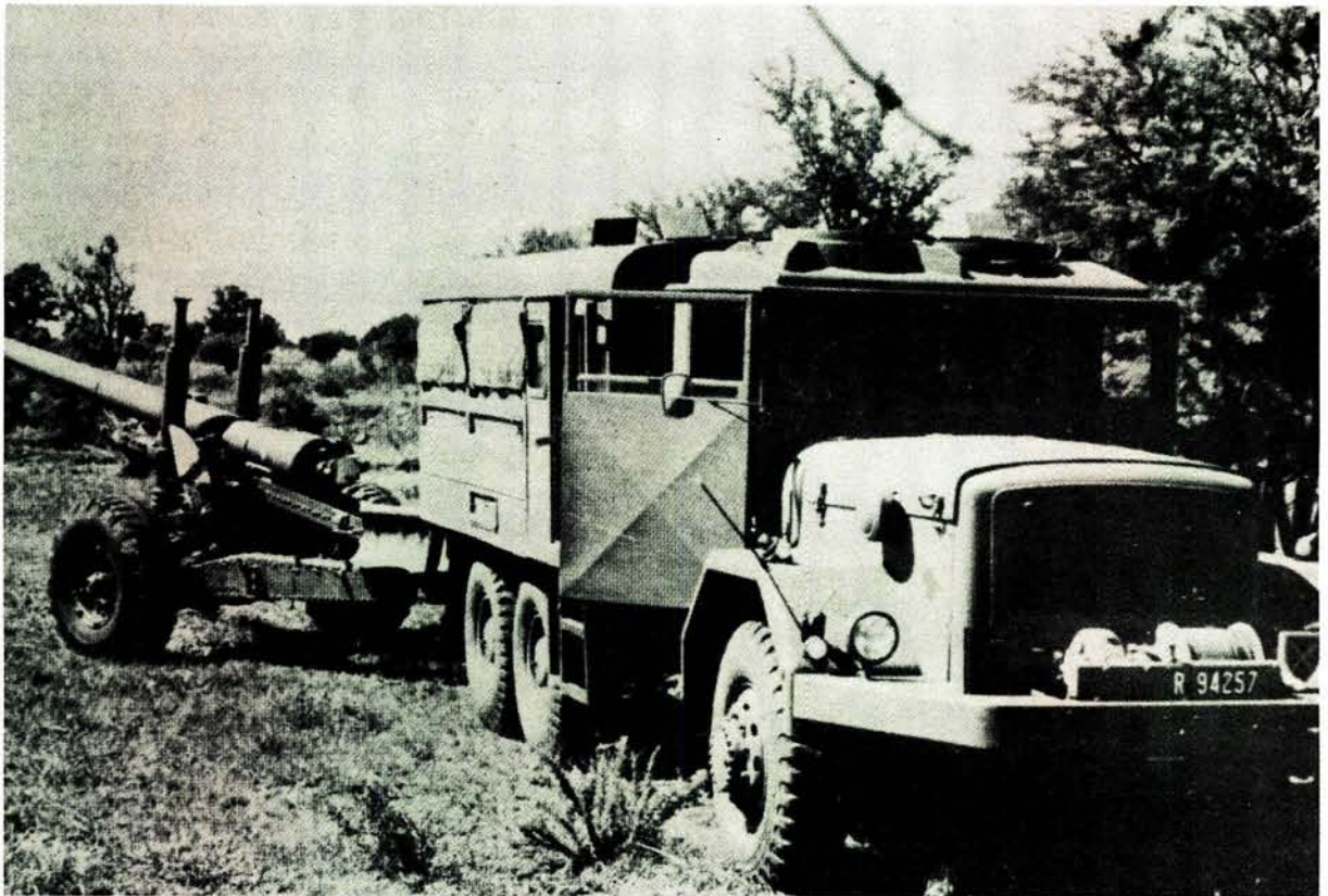
'n 140-mm kanon word deur 'n Magirus Deutz gedurende die veldtog in Angola (Operasie Savannah) gesleep

1976 was die onttrekking afgehandel. Burgermagineenhede wat as vier veggroepe in Suid-Angola ontplooi is om die Calueque/Ruacana-waterskema en vlugtelingskampe te beskerm, het Angola op 27 Maart 1976 verlaat.