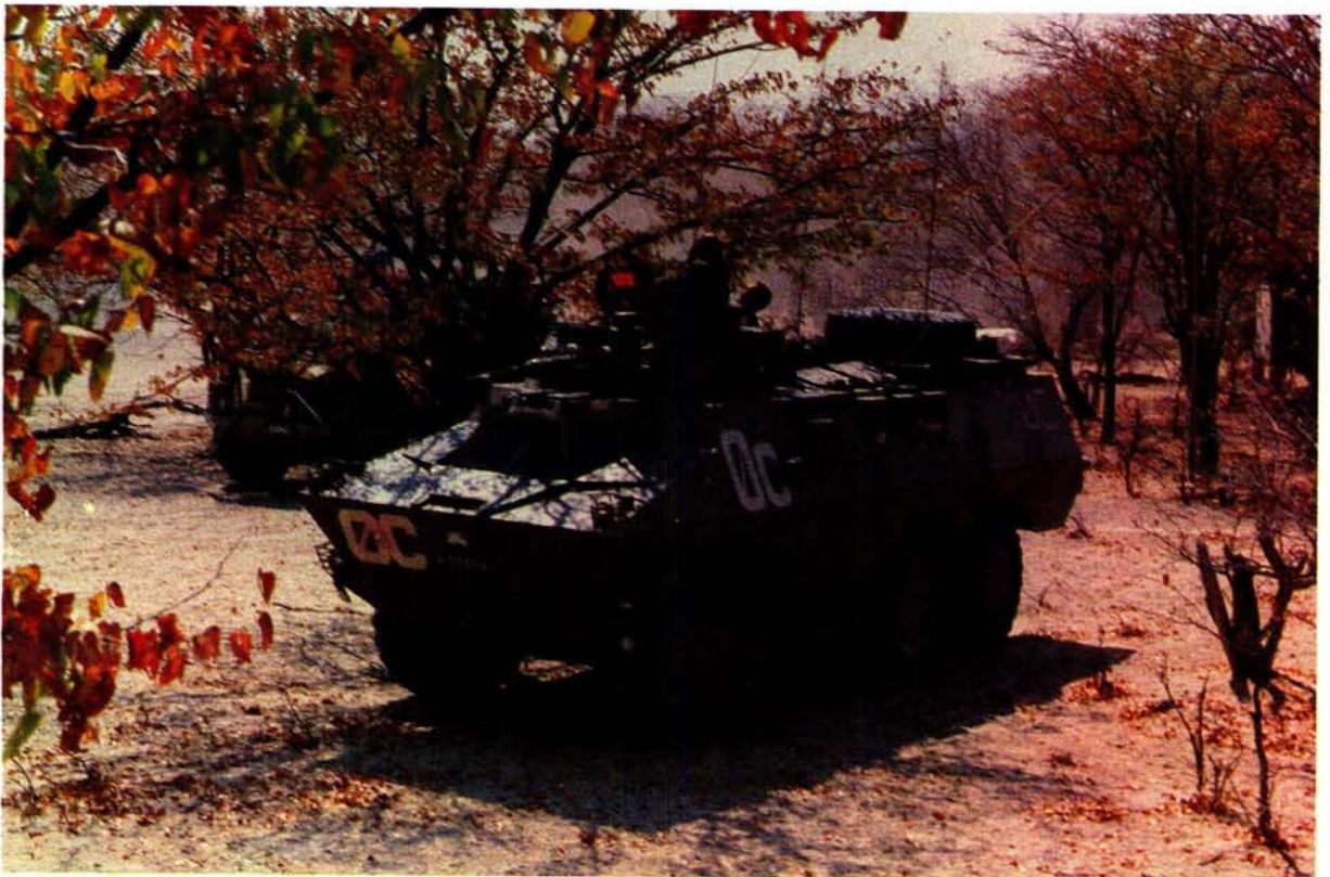
'n Ratel-infanteriegevegsvoertuig in die suide van Angola tydens 'n militêre operasie teen SWAPO-terroriste. Die Ratel-infanteriegevegsvoertuig is die troepedraer van die gemeganiseerde infanterie. Die Ratel is met groot welslae in voorsprongoperasies soos onder meer Operasie Reindeer teen SWAPO-basisse aangewend