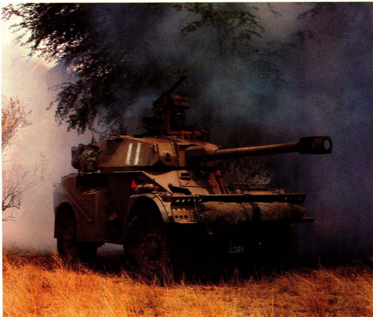
Die Eland 90-pantserkar, die Suid-Afrikaanse magte se primêre pantserwapen in operasies in Angola en Suidwes-Afrika

voorsiening gemaak vir die staking van alle vyandelikhede in die gebied vanaf 10 Augustus 1988. Tweedens moes onverwyld 'n aanvang gemaak word met die onttrekking van vreemde magte aan Angola. Suid-Afrika het die onderneeming gegee dat die onttrekking van sy magte op 1 September 1988 afgehandel sou wees.