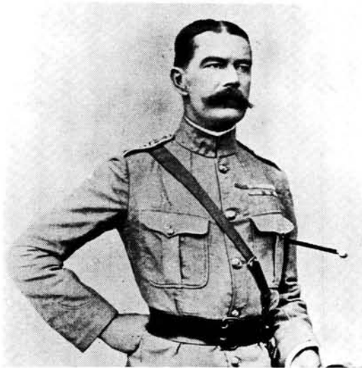
Lord Kitchener.

Daar is verneem dat lord Kitchener per trein van die Kolonie af sou kom en toe hulle seker was van die dag van sy aankoms op Kroonstad, is ons aangesê, almal wat moontlik kon loop, om op die stasie te wees as hy arriveer. Die stasie was nou wel naby die hospitaal, maar ek was behoorlik vies vir die affêre. Daar was egter geen salf aan te smeer nie en ek het saam met die tommies ingeval.