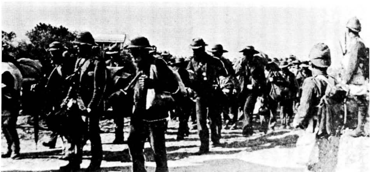
Aankoms van Boerekrysvangenes te Simonstad.

Die papbroekige gees het toe oral kop uitgesteek. Nog voor die twee van ons kommando weggedros het, het 'n betroubare vriend wat van generaal De Wet se kommando gekom het, my die volgende vertel: Hulle was tussen Kroonstad en Lindley toe daar op 'n dag twee kêrels aangery kom. Die generaal het dadelik vermoed dat alles nie pluis was nie, hulle gevang en by die kommando gehou. Toe het dit gebeur dat die Engelse skielik opdaag en daar moes haastig opgesaal word. Die twee is aangesê om hulle kar self in te span en baie gou ook, maar hulle was so tydsaam as wat moontlik was. Die een wou glad eers in die spruitjie gaan was, voordat hulle gaan. Dit was natuurlik duidelik dat hulle tyd probeer wen het om weer tussen die Engelse