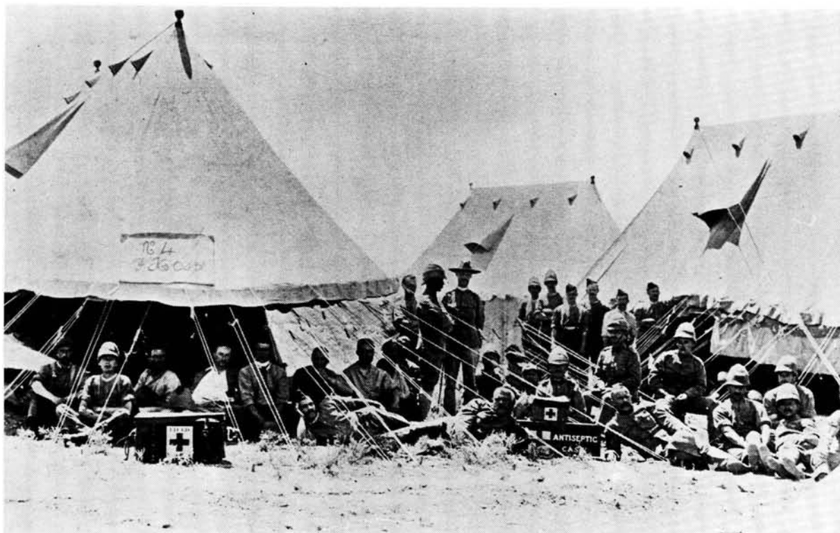
Britse veldhospitaal langs die Oranjerivier.

herstel nie. Hoe gedaan ek toe al was, kan seker begryp word, maar ek het niks daarop gesê nie; vir my het dit nie veel saak gemaak wat verder gebeur nie. Ek was moeg van die maandelange lyding in die hospitaaltentjie. Dit was beslis iets anders as die gerieflike hospitale van vandag met al die moderne hulpmiddels.