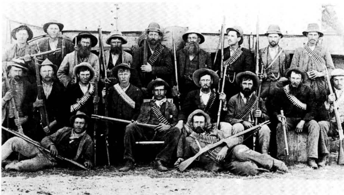
Groep Boere met gewere en bandollere.

Die Engelse het toe weer 'n ramkraal gevorm, maar dié keer het dit nie so voorspoedig gegaan met my klompie burgers nie. Met die uitjaag het daar, as ek reg onthou, sestien van hulle in die slag gebly en is gevang. Dit was treurige nuus. Ek het my manne geken en gewet waartoe hulle in staat was, daarom kon ek dit byna nie glo nie. Sou die Engelse 'n nuwe taktiek ontwikkel het om die onverskrokkenheid van die Boer die hoof te bied?