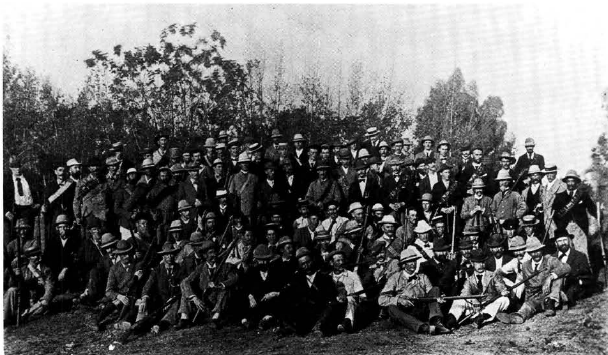
Burgermaglede, die Burgemeester en Dorpswag tydens die beleg van Ladysmith

was tussen die burgers wat in die rante aan die Suidweste van Ladysmith verskans was en dit was juis die brandpunt van die Engelse se poging om uit te kom.