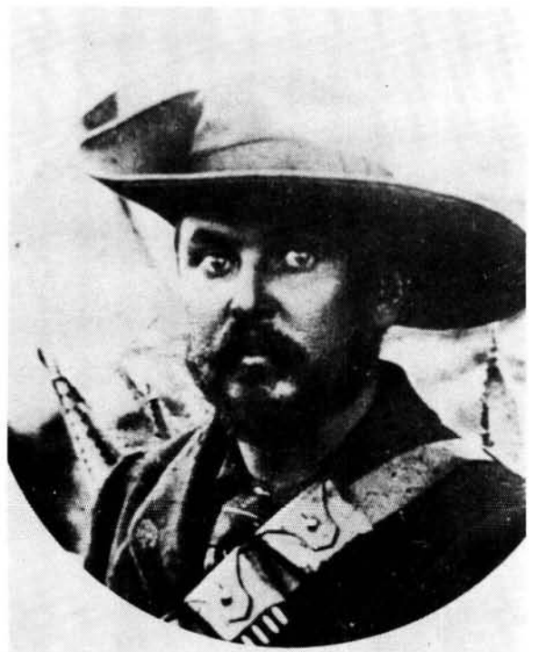
Genl Louis Botha

Na die slag van Spioenkop het die Britse mag teruggetrek en weer aan die voet van die Maluti's laer opgeslaan. Lank het hulle egter nie stilgelê nie of hulle probeer om by Skietdrif oor die Tugelarivier te kom. Die Transvalers was reg vir hulle en die eerste brug wat hulle oor die Tugela wou slaan, is weggeskiet. Die vyand het toe weer begin terugtrek en dit was duidelik dat hulle die aftog geblaas het.