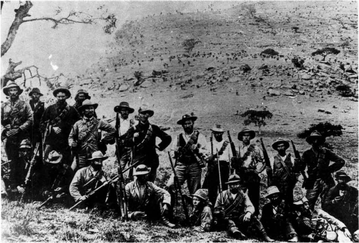
'n Boerekommando te Spioenkop in die jaar 1900

Dit was moeilik om te begryp waarom generaal Buller soveel van sy troepe ingeboet het, ons het hope van hulle doodgeskiet, net om die doelwit dadelik weer af te gee. Hulle moes seker die onmoontlikheid beseef het om die kop in daglig te behou, met die goed verskanste Boere so naby.