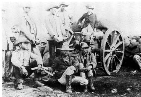
'n Krupp Houwitzer van die ZA Staatsartillerie, soos tydens die geveg van Spioenkop deur lede van die ZA Staatsartillerie beman is

Tydens die geveg het daar elke dag 'n ballon bokant Ladysmith opgestyg. Dit het ons baie vies gemaak dat hulle uit die lug mooi kon kyk waar ons lê sonder dat ons daar iets aan kon doen. Daar is 'n paar skote met Long Tom na hom geskiet, maar die generaal het dit belet omdat hy nie vroue en kinders wou laat seerkry nie.