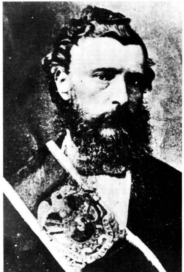
Pres T.F. Burgers

Die Boere het egter daarin geslaag om die aanval af te weer, maar toe was dit duidelik dat die vyand sy aandag op Spioenkop gevestig het. Ons het gou gesien dat ons skanse nie sterk genoeg was nie. Dit was bestand teen die kleingeweer en Armstrongkanon, maar die lid-dietbom was iets anders. Ons het toe onver-