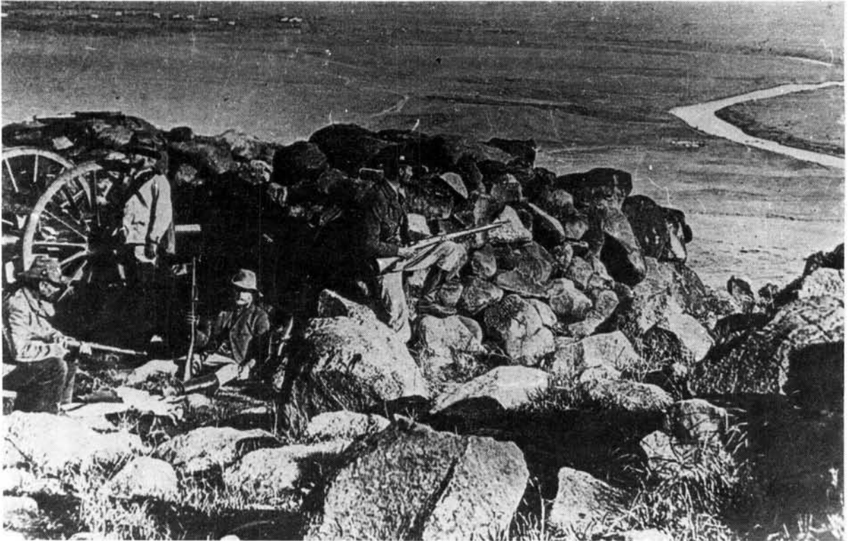
Die Slagveld tydens die Slag van Colenso 15 Desember 1899

mandant Steenkamp verlof geneem. Baie van die burgers het toe al verlof gehad om vir 'n paar dae huis toe te gaan, maar ek en nog 'n klompie het verniet gaan vra, ons versoek is elke keer geweier. Teen hierdie tyd het mens ook al begin vergeet van verlof, want dit het baie duidelik geword dat elke weerbare burger op sy pos moes wees.