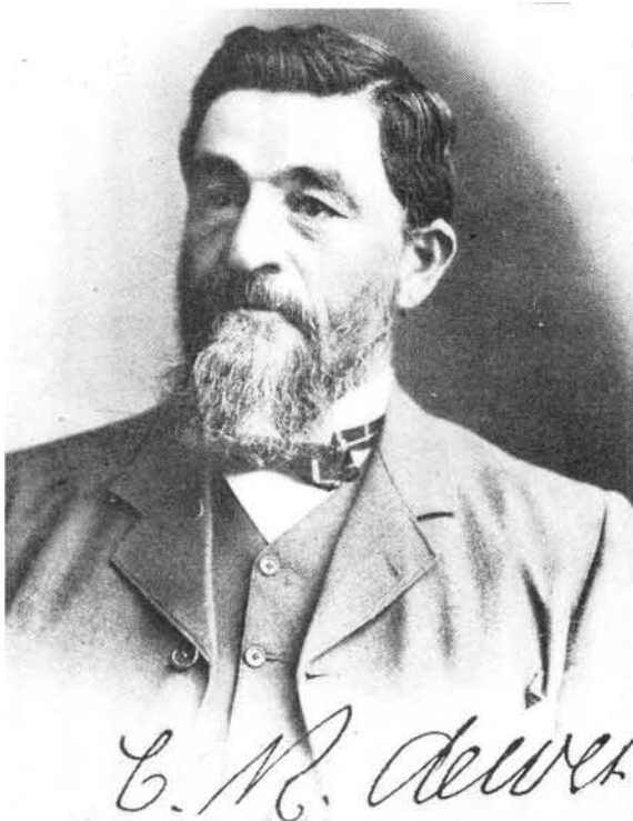
Genl C.R. de Wet

Die volgende oggend vroeg was ons anderkant Ladysmith en by 'n koppie is halt geroep sodat ons eers kon kosmaak. Dit was 'n taak wat ons met mening aangepak het, maar ons was net mooi op stryk, toe daar onverwags skrapnelle oor ons begin bars. Dit het 'n deurmekaar spul afgegee, maar mens kon jou lag ook nie hou nie. Sommige van die burgers het die potjie warm pap net so van die vuur af gegryp en daarmee die klowe ingevlug. Ander het 'n saal of waterkannetjie gegryp, maar niemand is daar weg sonder iets in sy hande nie.