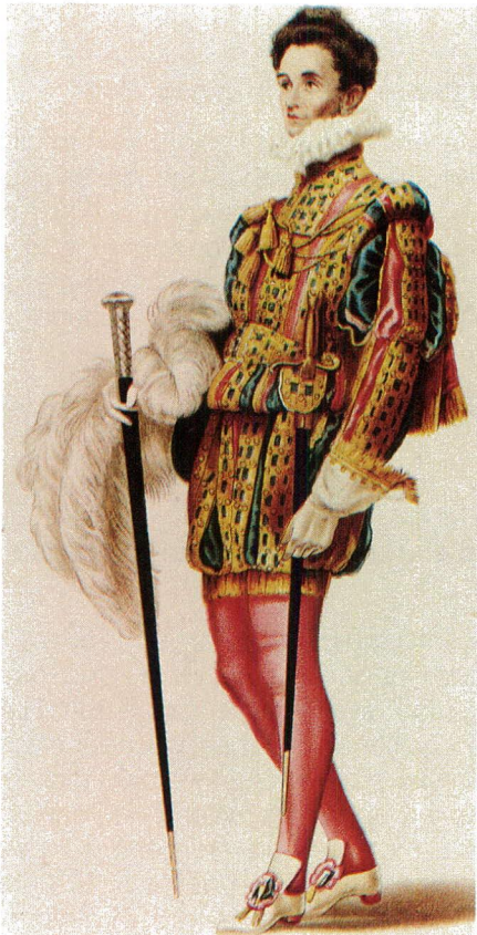
'n Luitenant tydens die kroning van George IV in 1820. Die Middeleeuse glorie het onder hom herleef en Pensioners is op die koning se koste met aanskoulike Tudor uitrustings voorsien. Die uitrusting was bloedrooi met blou Invoegsels en bedek met talryke goue knope. Die kostuum is afgerond met rooi sykouse, wit skoene met rooi rose daarop, wit handskoene en 'n swart hoed met rooi en swart vere.