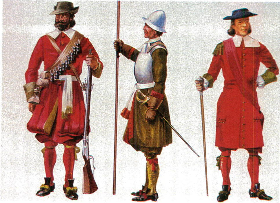
Uniforms van die Britse infanterie in 1670. Van links na regs 'n musketeer – 'n piekdraer en 'n tamboermajoor.