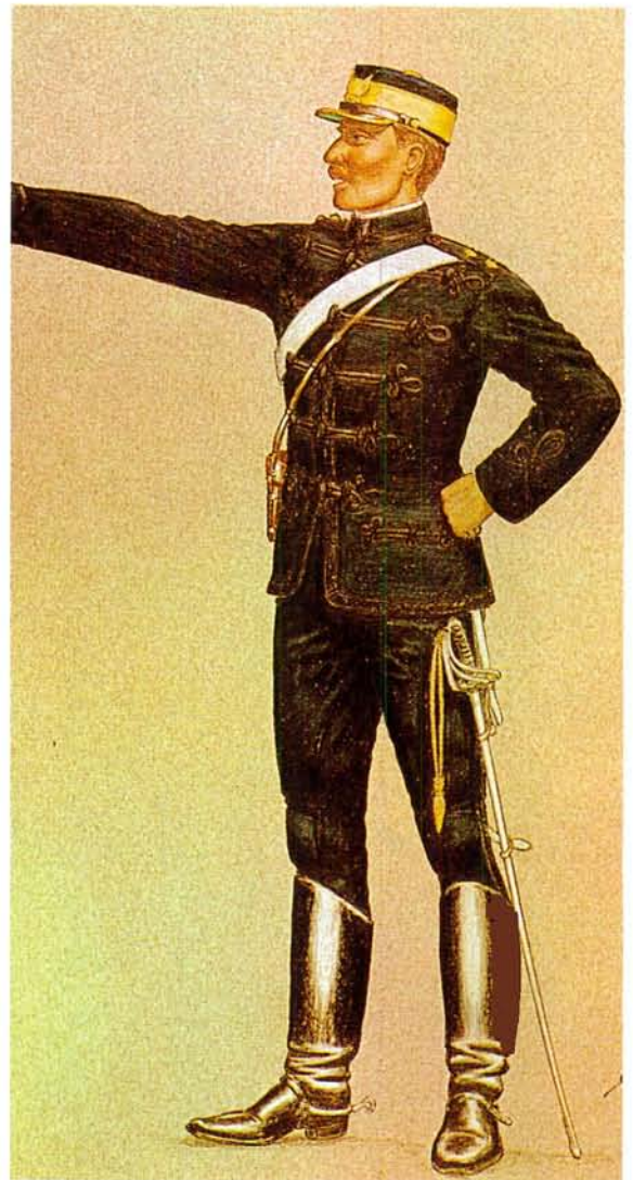
'n Luitenant in die Velddrag van die OVS staatsartillerie. Die tweede patroon is in 1880-90 gedra.

A lieutenant of the OVS State Artillery in 1870 wearing the earliest uniform.