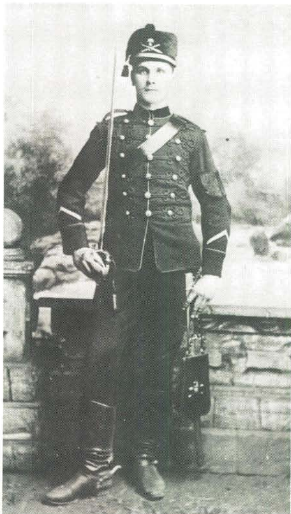
Winter of Parade uniform van 'n korporaal. Winter dress or parade dress of a corporal.