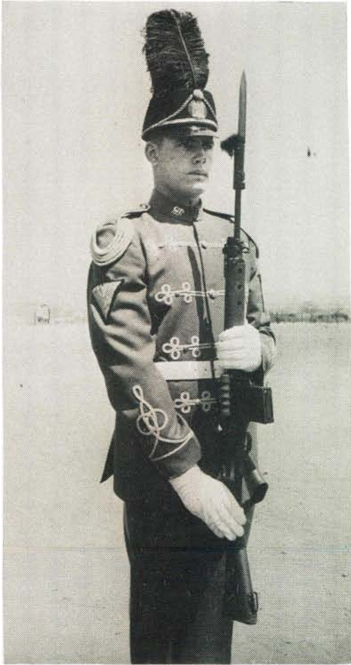
Groen uniform van die Staatspresidentswag met as hooftoetsel die swart Leërgimnasiumpet met die Republiekwapen voorop en die swart volstruisvere bo-op.

Green uniform of the State President's Guard and, as head gear, a black Army Gymnasium cap with the Republic badge on the front, mounted with black ostrich feathers.