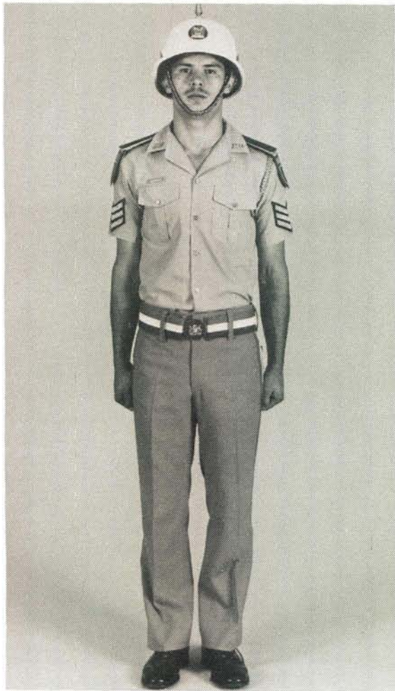
Someruniform van 'n onderoffisier. Summer dress of a non-commissioned officer.