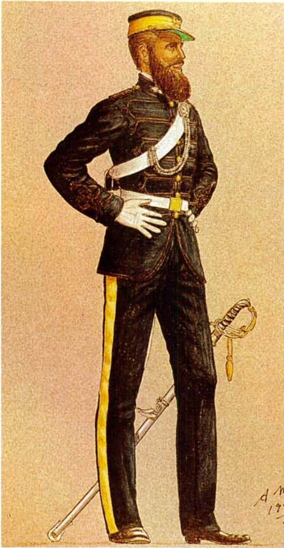
'n Luitenant van die OVS Staatsartillerie in 1870 in die eerste uniform.

A lieutenant of the OVS State Artillery in 1870 wearing the earliest uniform.