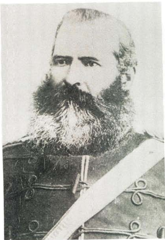
Genl Piet Joubert, Transvaalse kommandant-generaal. General Piet Joubert, the Transvaal Commandant-General.

Die vereistes vir lede van die korps was dat hulle gewerf moes word uit gebore en genaturaliseerde burgers van die Suid-Afrikaanse Republiek; hulle moes minstens 16 jaar oud wees; ongetroud wees; as liggaamlik geskik deur 'n geneesheer aanbeveel word en laastens op grond van goeie gedrag kwalifiseer.