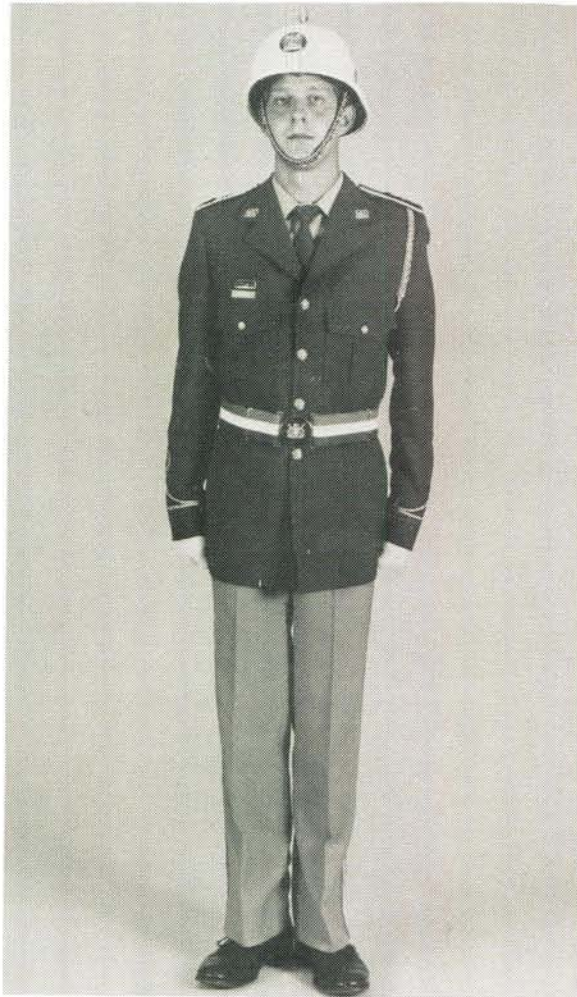
Winter- en parade uniform van 'n offisier. Winter uniform and parade uniform of an officer.