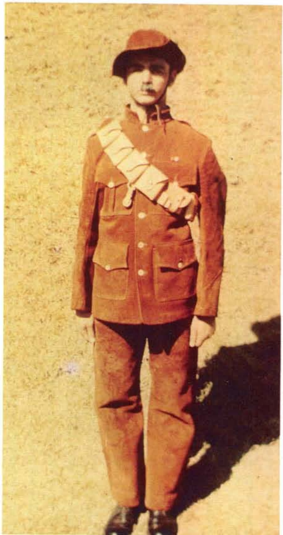
Burgerlike klere wat deur die Staatsartillerie gedra is in die tagtigerjare. Civilian clothes worn by the State Artillery in the Eighties.