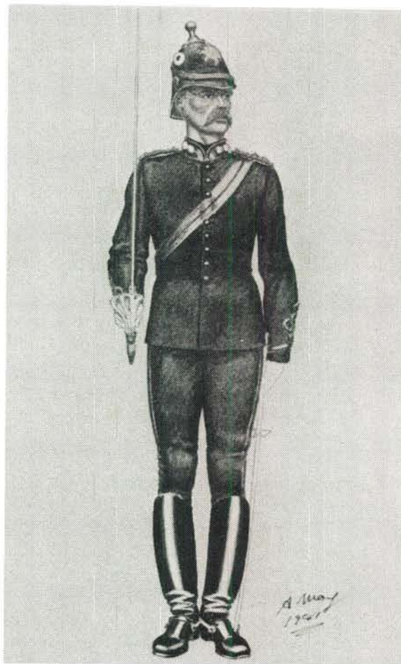
Offisier in die Vrystaatse Artillerie op parade 1880–90 Tweede uniform van Britse tipe.

Regulasies wat in 1876 vir die Vrystaatse artil-