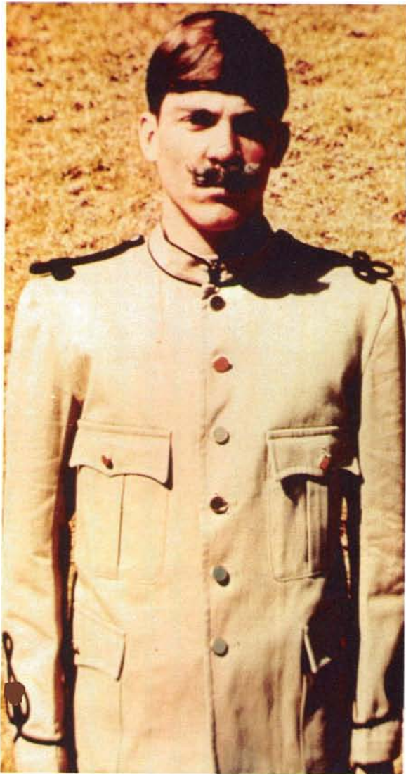
Somer of velddiensuniform van Staatsartillerie. Summer or field dress of the State Artillery.