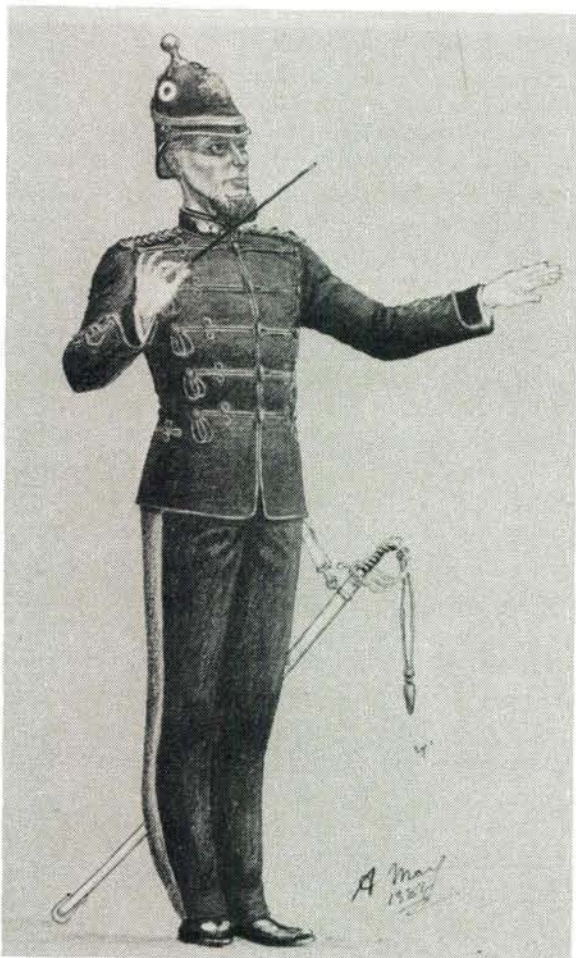
Orkesmeester van die Vrystaatse Artillerie 1880–90 in tweede uniform vanaf die Britse patroon oorgeneem. A band leader of the OFS State Artillery during 1880–90, wearing the second uniform which was based on the British pattern.

leriste vasgelê is, het hulle vir drie jaar, waarin hulle nie toegelaat is om te trou nie, tot aktiewe diens verbind. Hulle moes tussen 16 en 20 jaar oud wees, toestemming van hul ouers of voogde gehad het om by die korps aan te sluit en fisies gesond wees. Verder moes hulle 'n edel karakter hê, godsdiensoefeninge bywoon en sorg dra dat hulle wapens, saals en tooms gedurig in orde is.