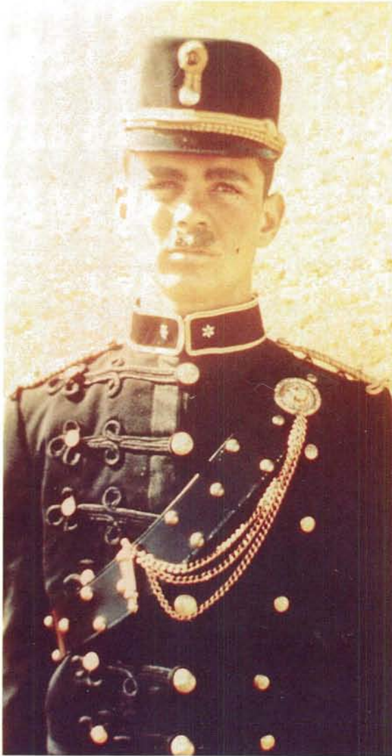
Donkerblou parade of winteruniform wat met koringblou omgeboor was.

Dark blue parade dress or winter dress, with cornflower blue piping.