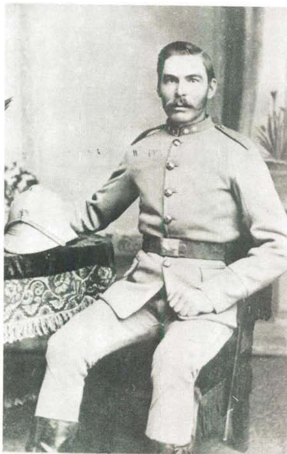
Winteruniform. Let op helm met wit pluim. Winter dress. Note the helmet with white plume.

Die parade uniform het heelwat meer versierings as die velddiensuniform gehad, onder meer drie rye van ses knoppe elk, regopstaande wit kwaste op die sierlike mus en rye sierkoord in mooi