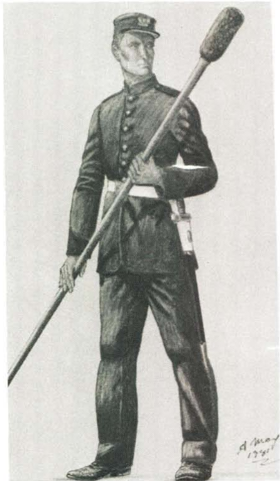
Bombardier in eerste uniform van OVS se Artillerie in 1870.

A lieutenant of the OVS State Artillery in 1870 wearing the earliest uniform.