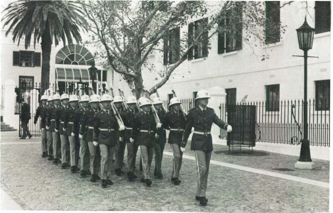
Die Staatspresidentswag op parade in hul nuwe seremoniële uniform. The State President's Guard on parade in their new ceremonial uniform.

met die standaard Leëruniform uit te reik aangesien die eenheid op die Leër se sterkte is en infanterie opleiding ondergaan sowel as die normale infanterie take uitvoer wat van so 'n eenheid verwag word.