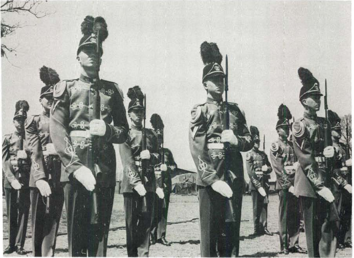
Die Staatspresidentswag in die latere uniform tydens 'n seremoniële geleentheid. Die baadjie is met 'n wit gordel by dié geleentheid gedra.

The State President's Guard wearing the more recent uniform, during a ceremonial occasion. On such occasions, the jacket is worn with a white belt.