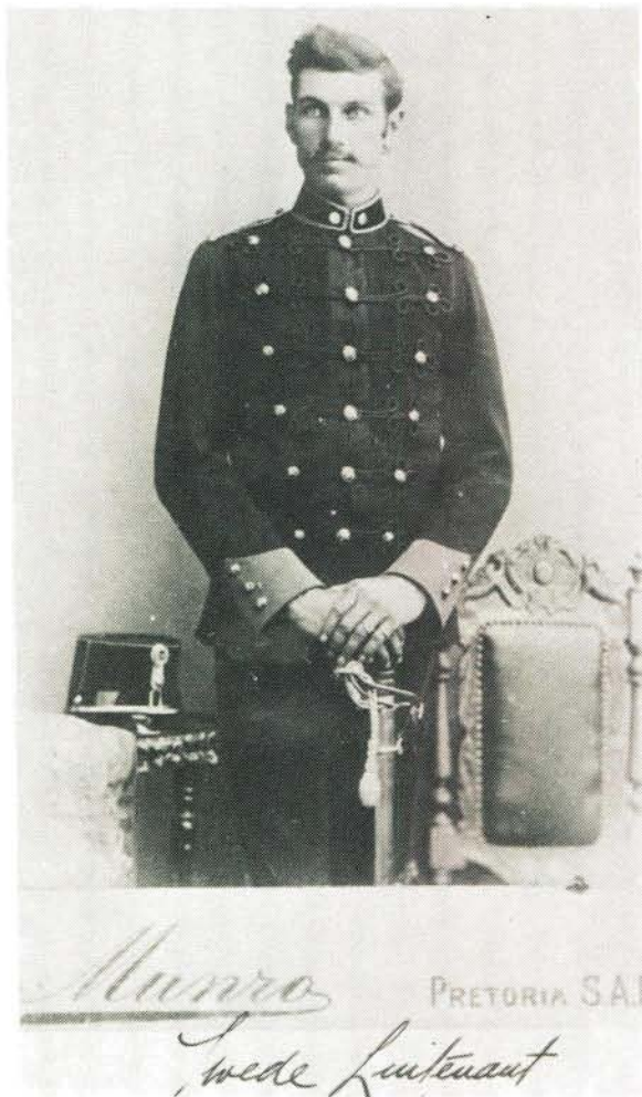
Winteruniform van 'n offisier. Let op pet as hoofbedekking.

Summer dress or field dress of an officer of the State Artillery. Each gunner was armed with a sword.