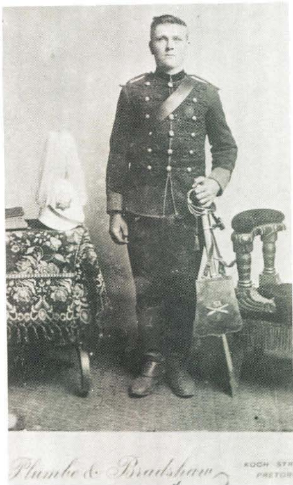
Somer velddiens uniform van 'n offisier in die Staatsartillerie. Elke artilleris was nog met 'n sabel bewapen.

Summer dress or field dress of an officer of the State Artillery. Each gunner was armed with a sword.