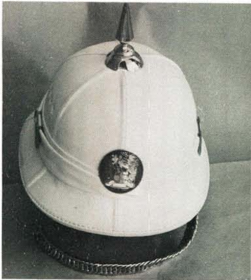
Wit punthelm met penteken. White cork helmet with spike.

en praktieser sou wees as die een wat op daardie stadium in gebruik was.