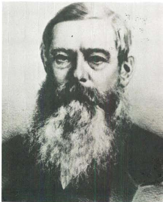
President J.H. Brand, Stigter van die Vrystaatse Artilleriekorps.

Tot op die stadium was die posisie van die Staatspresident niks meer as 'n blote voortsetting van die amp van Goewerneur-Generaal met 'n naamsverandering nie. Daar is voorts besef dat alles moontlik gedoen moes word om die Staatspresident se beeld groter en waardiger te maak. Aanvanklik het die Staatspresident geen permanente wag gehad nie en sedert die vroeë vyftigerjare het die Leër, Lugmag en Vlootgimnasiums om die beurt as wag eers vir die Goewerneur-Generaal en daarna vir die Staatspresident opgetree. Vervolgens is die Opperbevel van die Weermag versoek om 'n Staatspresidentswag op die been te bring.