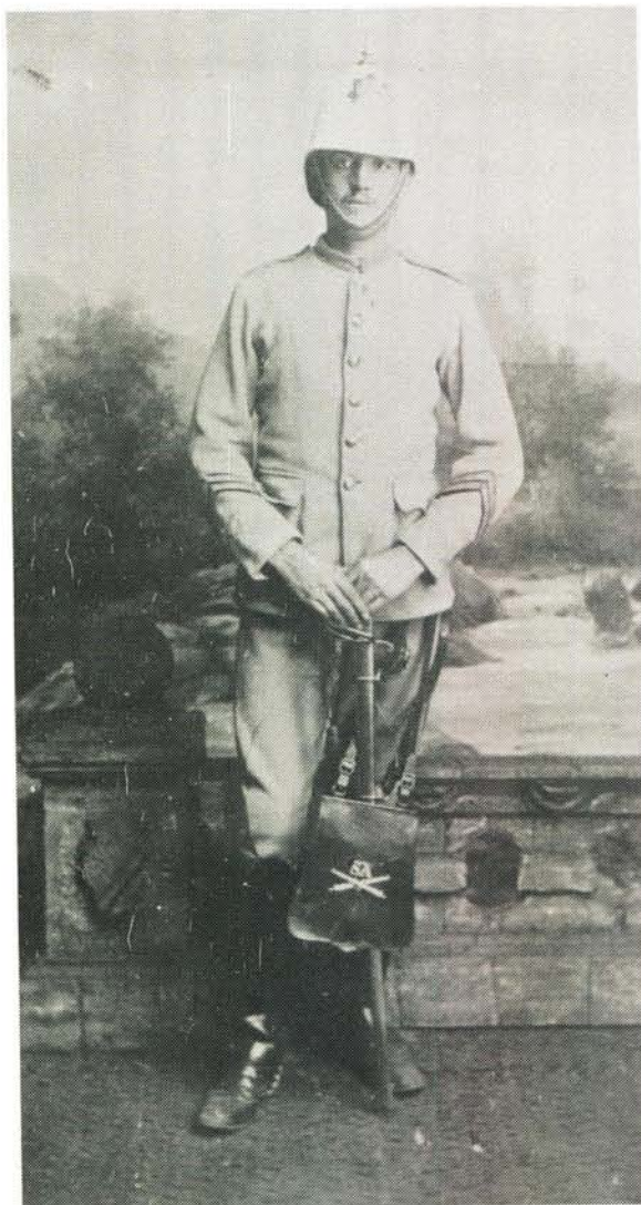
Somer of velddiens uniform van 'n wagmeester in die Staatsartillerie met wit helmet.