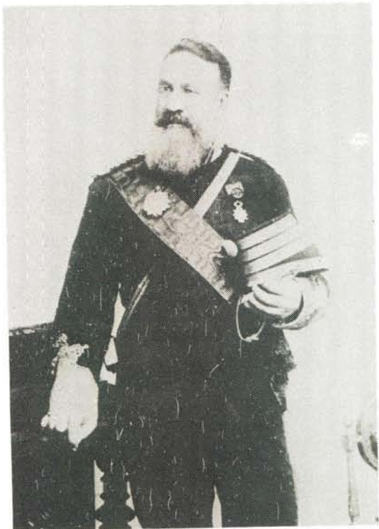
President T.F. Burgers, stigter van die Transvaalse Staatsartillerie.