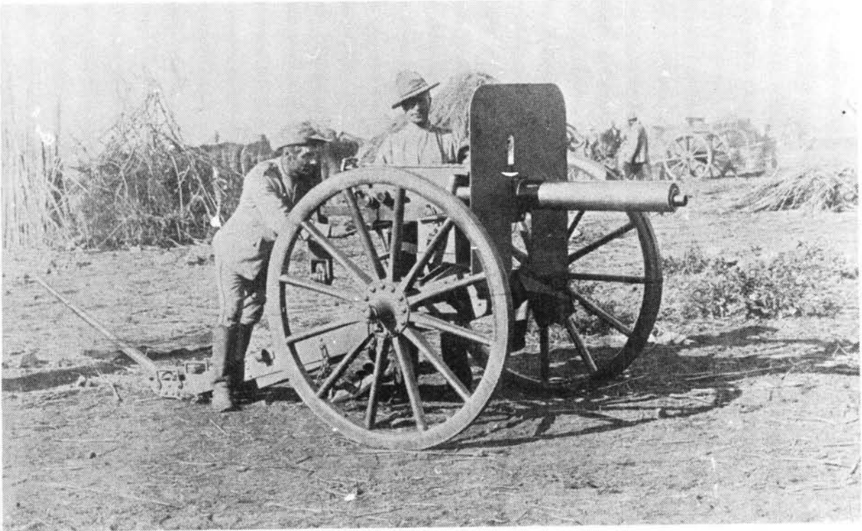
Twee Boere by 'n Pom-pom kanon.

die Unie op te stel, het min mense die verloop van sake met groter belangstelling as genl Beyers gevolg.