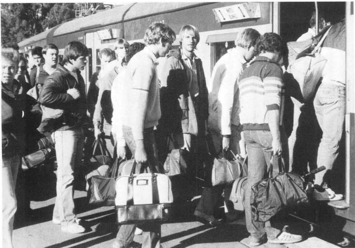
'n Nuwe inname dienspligtiges vertrek per trein na Voortrekkerhoogte om daar vir diensplig aan te meld

Dit het gaandeweg duidelik geword dat die bestaande stelsels vanweë veranderde omstandig-