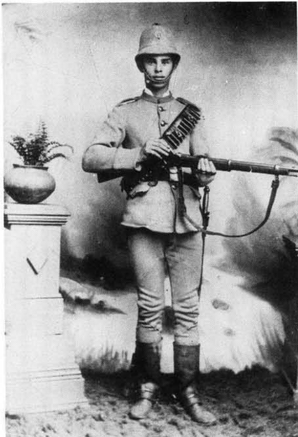
'n Manskap van die Transvaalse Staatsartillerie in die tweede helfte van die 19de eeu

Elke drie tot vier maande sou vrywilligers op een of ander plek in hul wyk vergader om "sodanige oefeninge met wapens uit te voer". Vir die bekamping van veediewery en die smokkelhandel in wapens, het president Boshof die behoefte aan 'n grenswag of berede polisiemag geïdentifiseer.