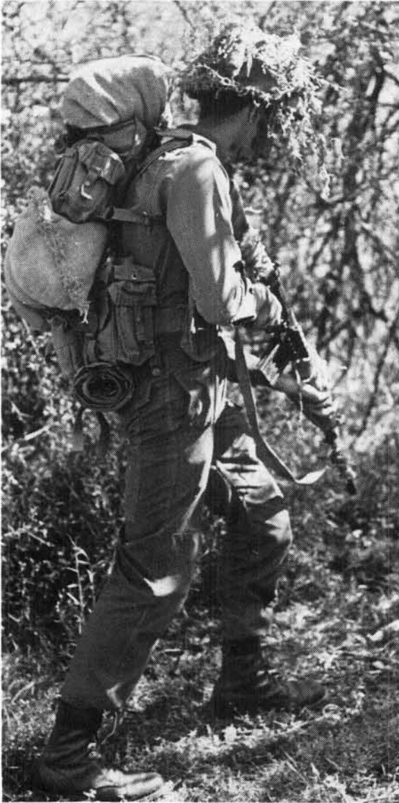
'n Dienspligtige verken die terrein tydens 'n veldoefening