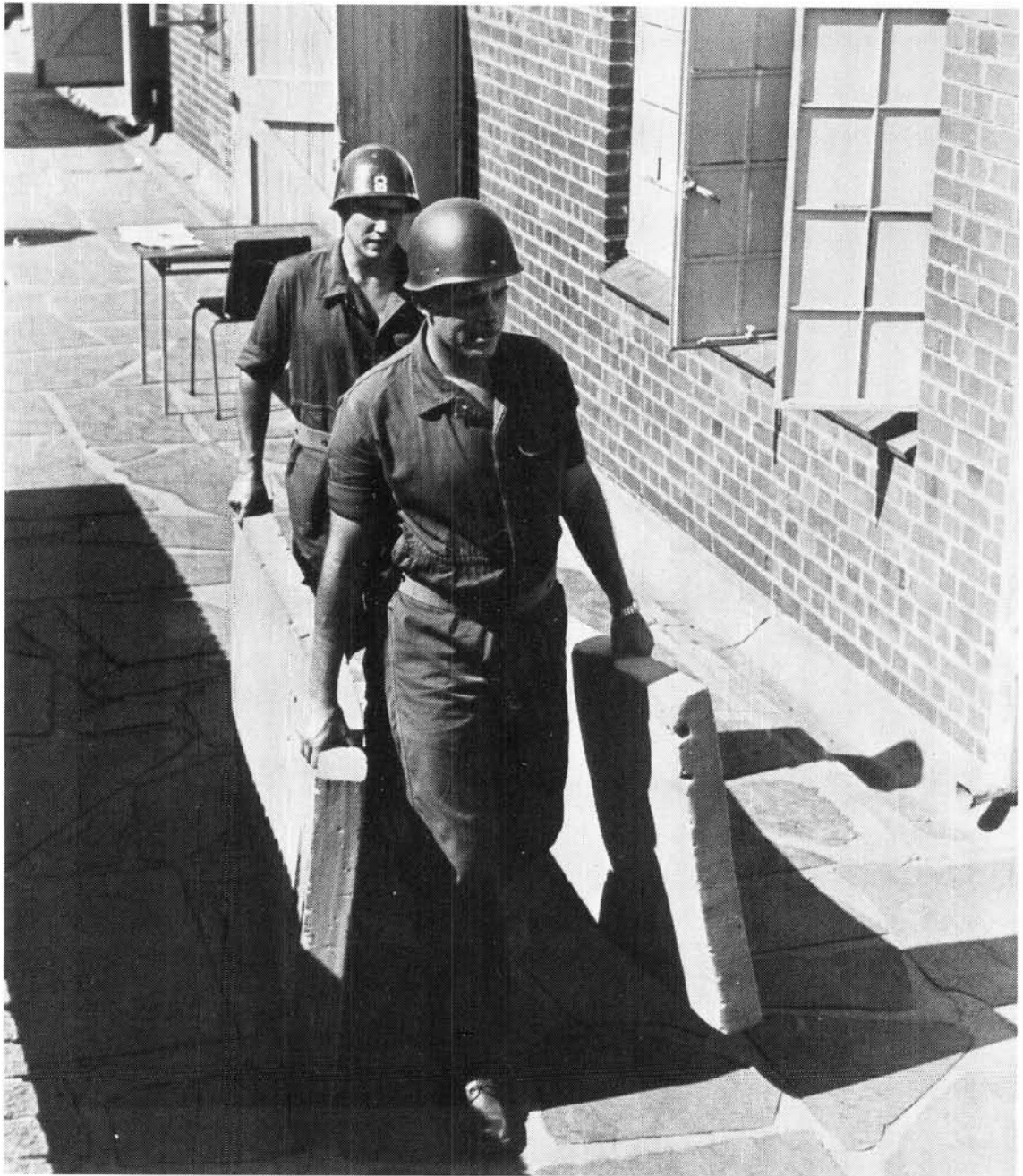
Nuwe inname dienspligtiges neem hul matrasse in ontvangs

Weens eskalering van die bedreiging het daar nie veel gekom van die voorneme om die Kommandomag en die Burgermag te verminder nie. Wat wel gebeur het, was dat deur die groter beskikbaarheid van Nasionale Dienspligtiges 'n grootskaalse vermeerdering van Burgermag en Kommandomaglede verhoed is.