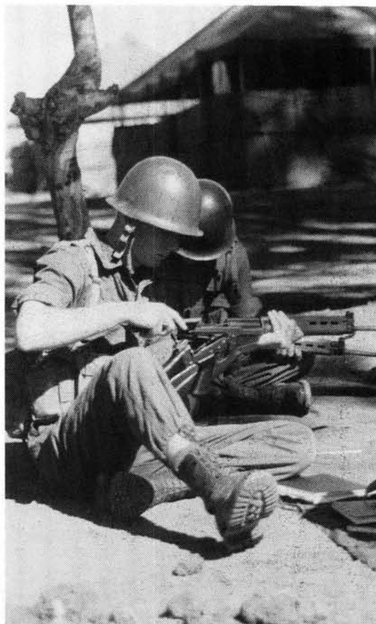
Troep besig met die skoonmaak en aanmeekaarsit van hul gewere tydens basiese opleiding