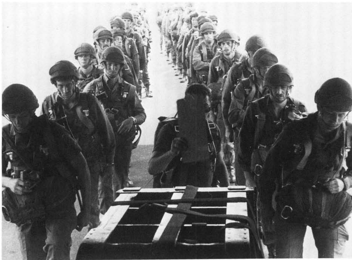
Valskermspringers besig om aan boord van 'n vliegtuig te gaan

slaggewend vir die ordelike voortbestaan van al die inwoners van die Republiek kan wees. 'n Oplossing vir die mannekragprobleem moes dus gevind word. In die verlede kon die land nog altyd staatmaak op mobilisasie om die nodige mannekrag vir 'n oorlogsoperasie te verkry. Nou is die bedreiging egter 'n tipe oorlog wat sonder oorlogsverklaring plaasgevind het. Die uitbouing van die Voltydse Mag sou die ideale oplossing wees. Die groot nadeel hieraan verbonde was egter dat dit sou meebring dat die aanvanklike dienspligtydperk vir blanke mans weer verleng moes word, wat uiters onregverdig teenoor die blanke jong mans sou wees.