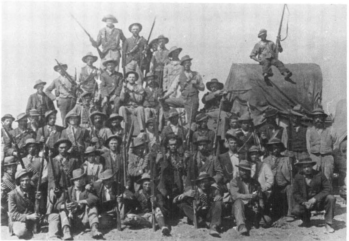
'n Aantal Boere op kommando tydens die Tweede Vryheidsoorlog.

Na die Tweede Vryheidsoorlog het die Britse vrywilligerstelsel ook sy kop in die kolonies en in Transvaal begin uitsteek. Die tradisionele kommandostelsel in die noorde is afgeskaf en so is 'n verpligte diens beëindig. Die vrywilligerstelsel van die jare 1902–1912 het geen ingang in die Oranjerivier-kolonie gevind nie, maar in Transvaal is die "Transvaal Volunteeer"-organisasie