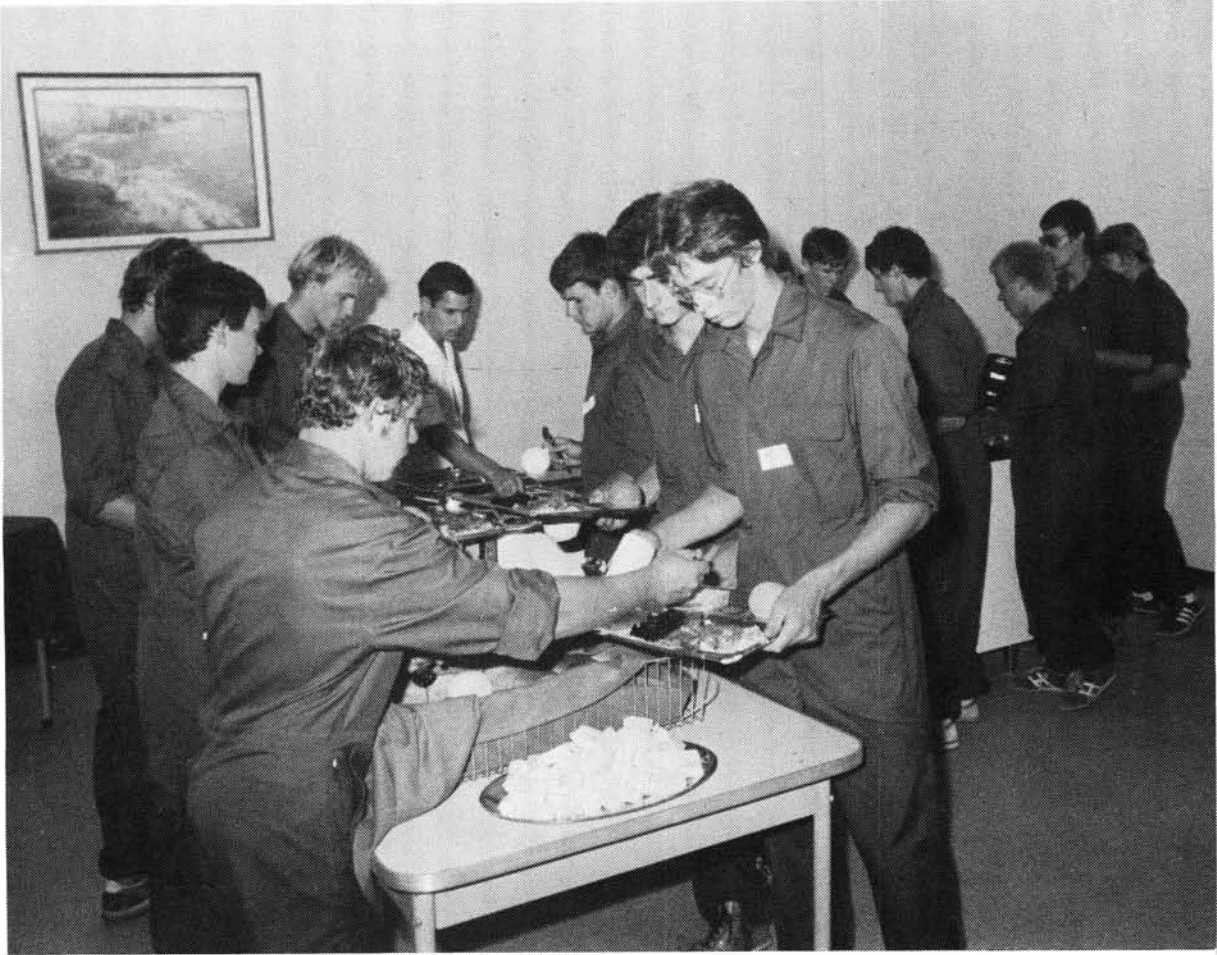
Nuwe aankomelinge kry 'n eerste voorsmaak van wat die volgende twee jaar op hulle wag