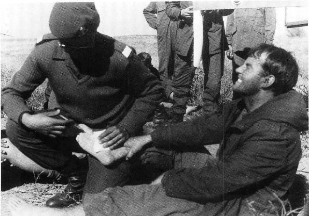
Die seer voete van 'n dienspligtige word behandel tydens 'n uithou-oefening wat deel vorm van basiese opleiding