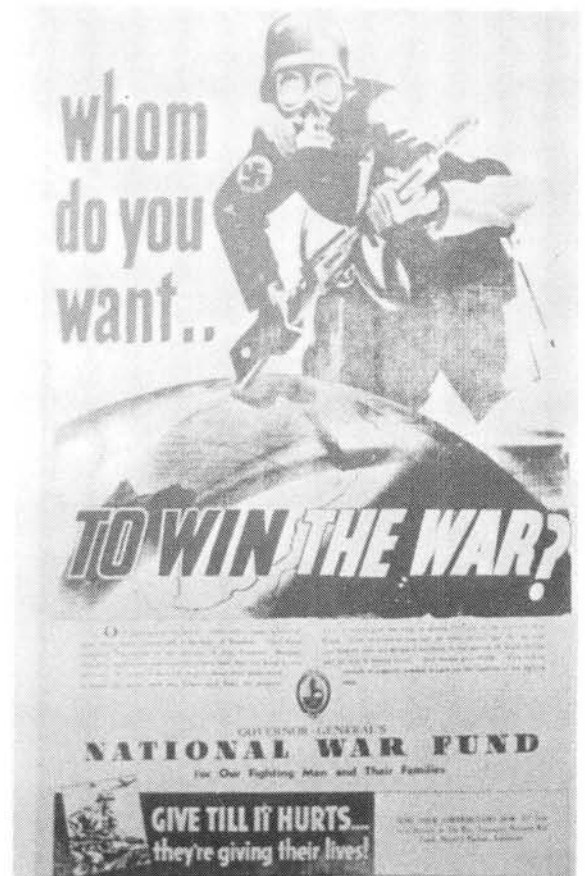
'n Nasionale oorlogsfonds is deur die regering gestig vir Suid-Afrikanners wat aan die Tweede Wêreldoorlog deelgeneem het.

Weerstand aan die kant van werkgewers was aan die orde van die dag. Die regering het werkgewers gewaarsku dat hulle, volgens bewering, in sommige gevalle onwettig gehandel het deur hul werknemers te waarsku dat hulle hul betrekings in gevaar sou stel deur of vir voltydse diens of vir diens in die Aktiewe Burgermag aan te sluit. Die regering het verklaar dat sou enige werkgewer 'n werknemer wat militêre diens kragtens die Verdedigingswet van 1912 onderneem, penaliseer, sou die werkgewer swaar gestraf word.