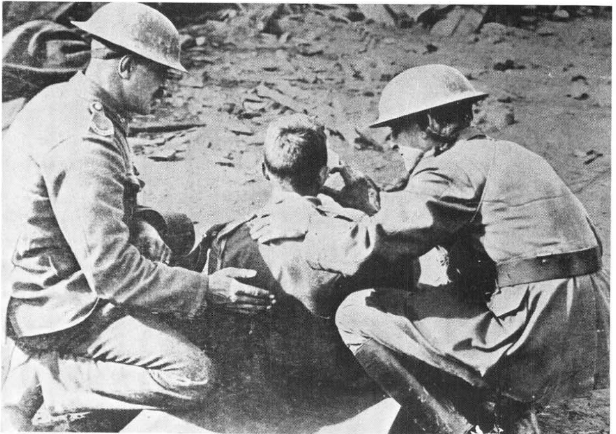
'n Gewonde Suid-Afrikaanse soldaat ontvang aandag van sy kamerade na 'n veldslag op die Westelike Front tydens die Eerste Wêreldoorlog.

In Oktober 1915 het die Unieregering op versoek van die Britse regering 'n mag vir diens in Duits-Oos-Afrika vergader. Gedurende die res