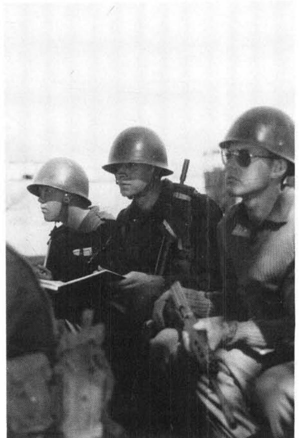
Immigrante troepe van die Julie 1985 Inname besig om lesings af te neem tydens basiese opleiding by Klipdrift