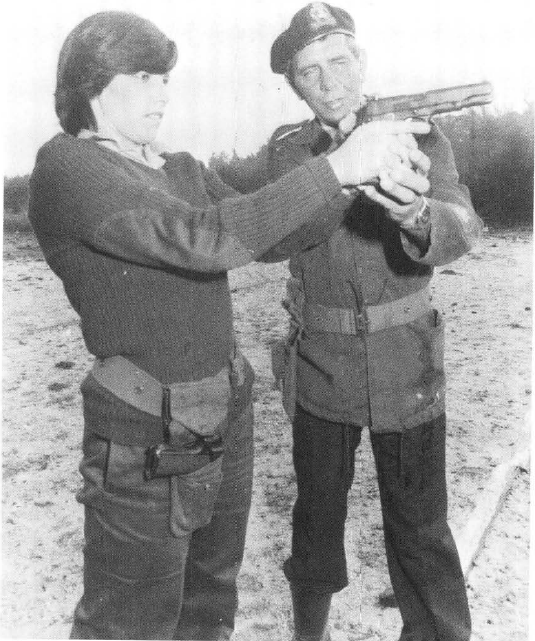
Hoewel vroue in die Staande Mag in 'n nie-vegterende hoedanigheid aangewend word, ontvang hulle tog wapenopleiding as deel van basiese opleiding

Redes wat aangevoer word waarom sy nie in 'n gevegsrol aangewend word nie, is dat Suid-Afrikers nie gereed is vir die vegterende vrou en alles wat daardeur geïmpliseer word. Dit is vir die man moeilik om die vrou in die geveg te