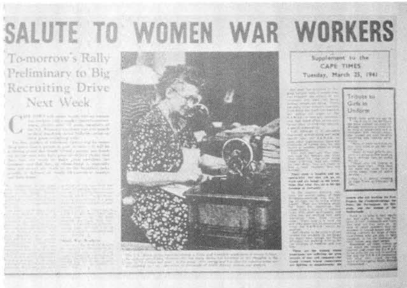
In Maart 1941 het die Vrouehulpdienste 'n werwingsveldtog geloods om meer vroue by die oorlogspoging te betrek

vroueklerke tot gevolg sou hê om vakatures te vul. Om voorsiening vir hierdie moontlikheid te maak, het die Vrouehulpdiens tot stand gekom. Vroue in die leer het diens gedoen as motorbestuurders, klerke, seiners, rapportryers, kokke, radiografiste en kusartillerie spesialiste.