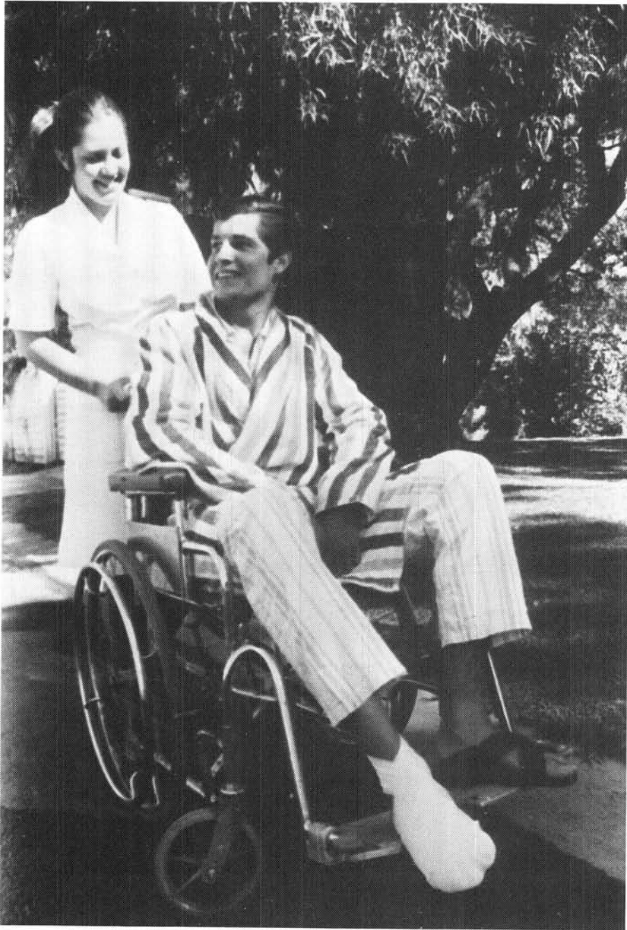
'n Verpleegster van die Militêre Hospitaal besig met nasorg van 'n beseerde soldaat

Met die verandering van die funksie en beeld van die vrou in uniform elders, het dit hier te lande ook by die eise van die tyd aangepas. Die benadering van die SA Weermag tans is dat die vrou se rol hoewel andersoortig, tog net so belangrik as die van die man is. Die militêre beeld moet nie onvoorwaardelik deur die vrou nagestreef word nie, terwyl sy haar eie vroulike identiteit steeds moet behou. Die vrouelid betree 'n tradisionele manswêreld waarin aanpassings gemaak moet word om suksesvol by die Weermag in te skakel. Belangrik om op te let is dat