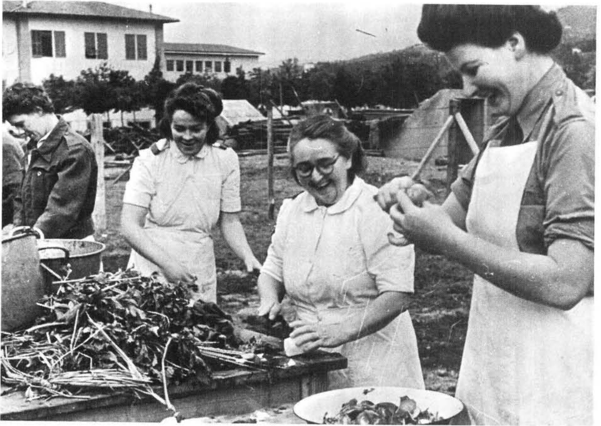
Diëtkundiges van die Vrouehulpplëërdiens (VHLD) besig om 'n maaltyd voor te berei vir gewonde SA soldate in die Algemene Hospitaal in Italië in 1944.