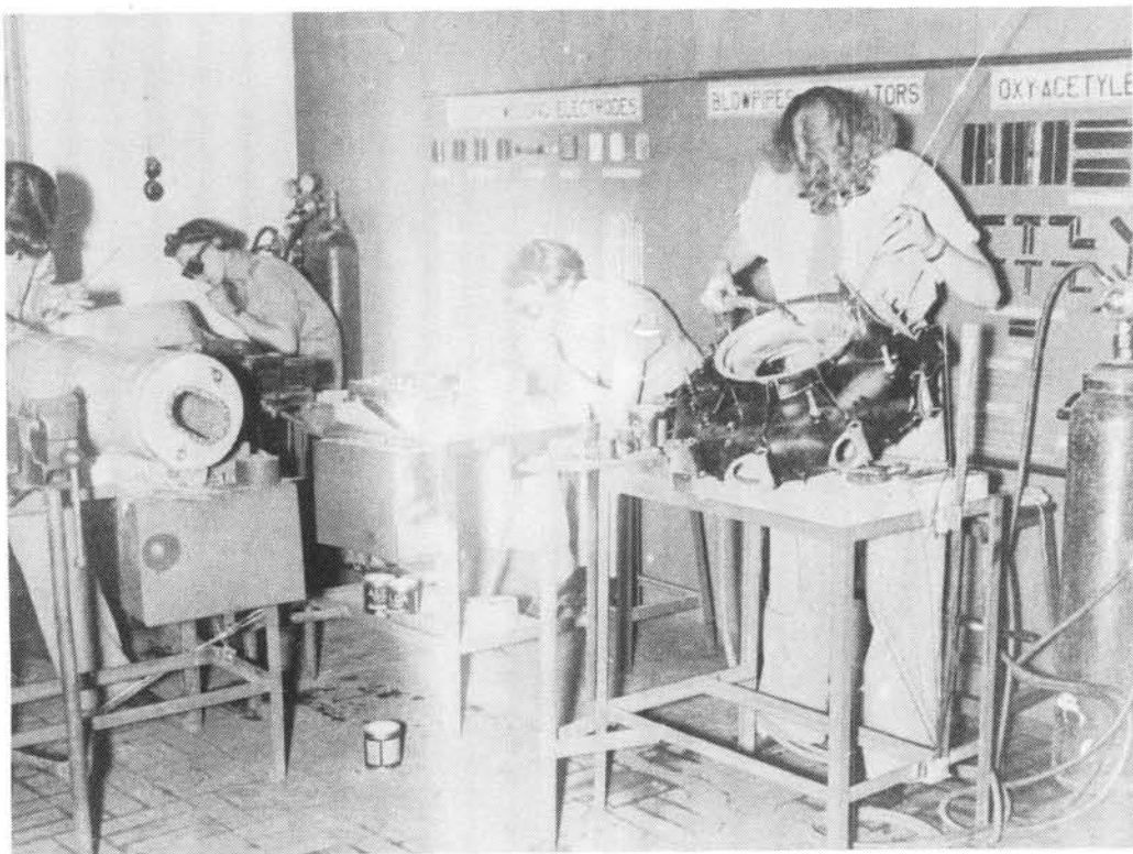
Tegnici van die VHLM besig met herstelwerk van vliegtuigonderdele (1942–1943)

Aanvanklik is 150 vroue per jaar by die kollege in George nie net in tegnieke van burgerlike beskerming opgelei nie, maar ook in 'n wye spek-