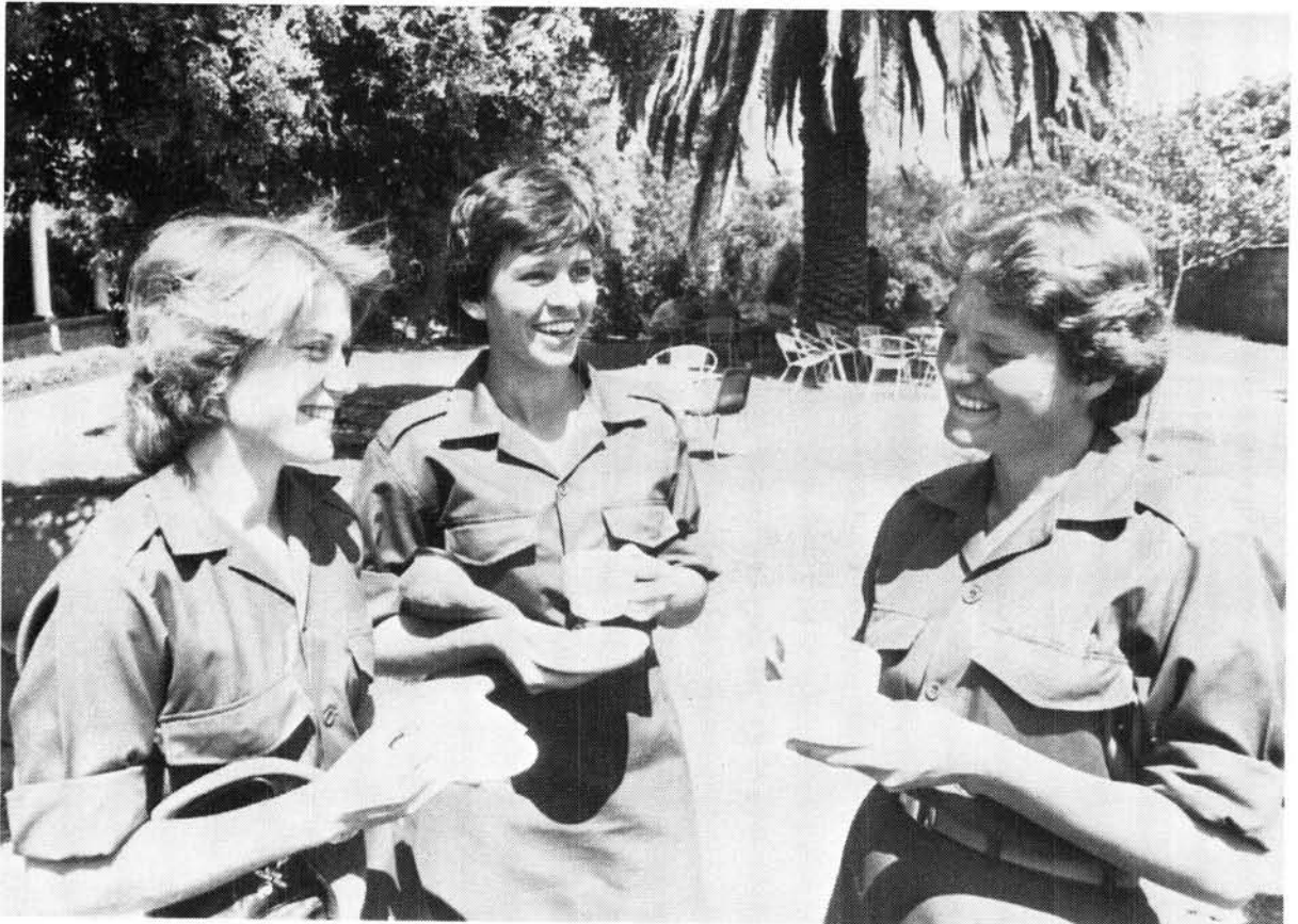
Studente van die SA Leërvrouekollege ontspan tussen lesings

Die toenemende rol wat deur vroulike militêre personeel in die SA Weermag sedert 1972 gespeel is, is ook in die SA Geneeskundige Diens se programme weerspieël. In Januarie 1979 het die SA Geneeskundige Diens se Opleidingsen-