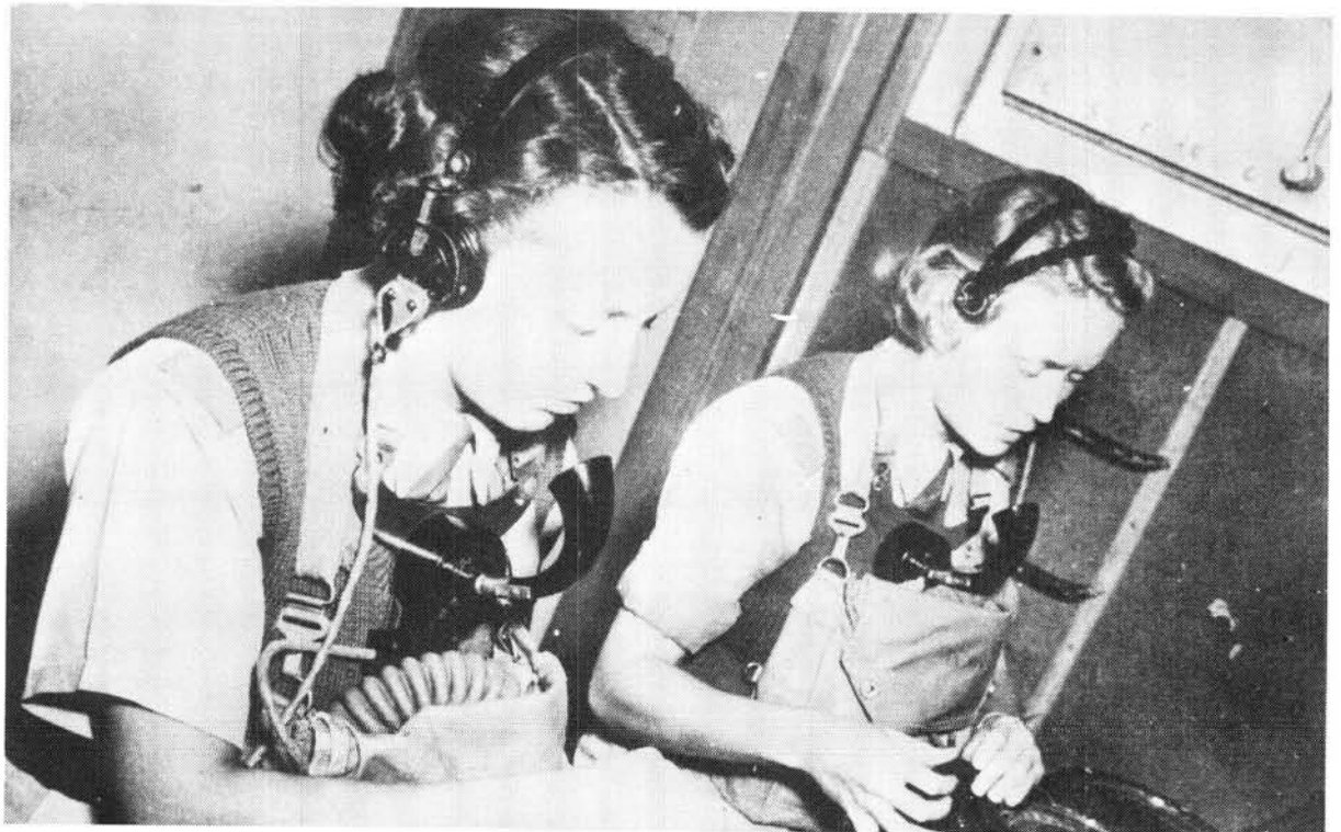
Kusartillerie spesialiste van die VHLD werk met afstandmetertoerusting in 'n ondergrondse bomvrye kamer.

Die beleid om vroue in militêre poste aan te