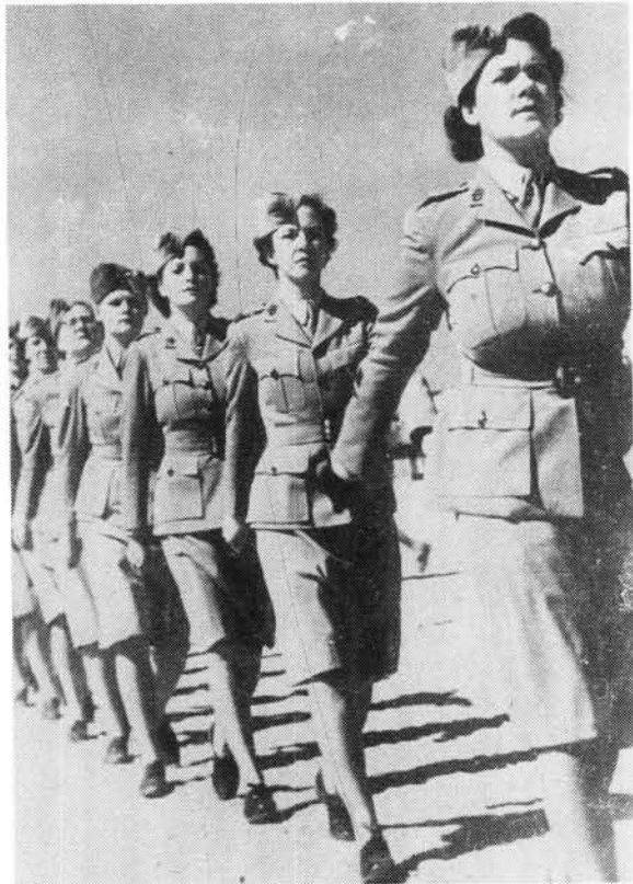
Lede van die Vrouehulplugmag (VHLM) op parade in die Midde-Ooste in 1942