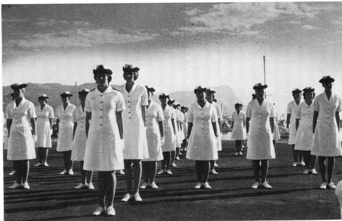
Uitpasseringsparade van Vlootvroue na basiese opleiding

beroepsveld te bewys", aldus kol Roux, SSO Maatskaplike Diens. Brig Kok, Direkteur Vroue, gee 'n byna soortgelyke verklaring waarom vroue by die Weermag aansluit: "om 'n vrou in uniform te wees, beteken opwinding en werksbevreeding en haar aanwending is versoenbaar met vrou-wees."