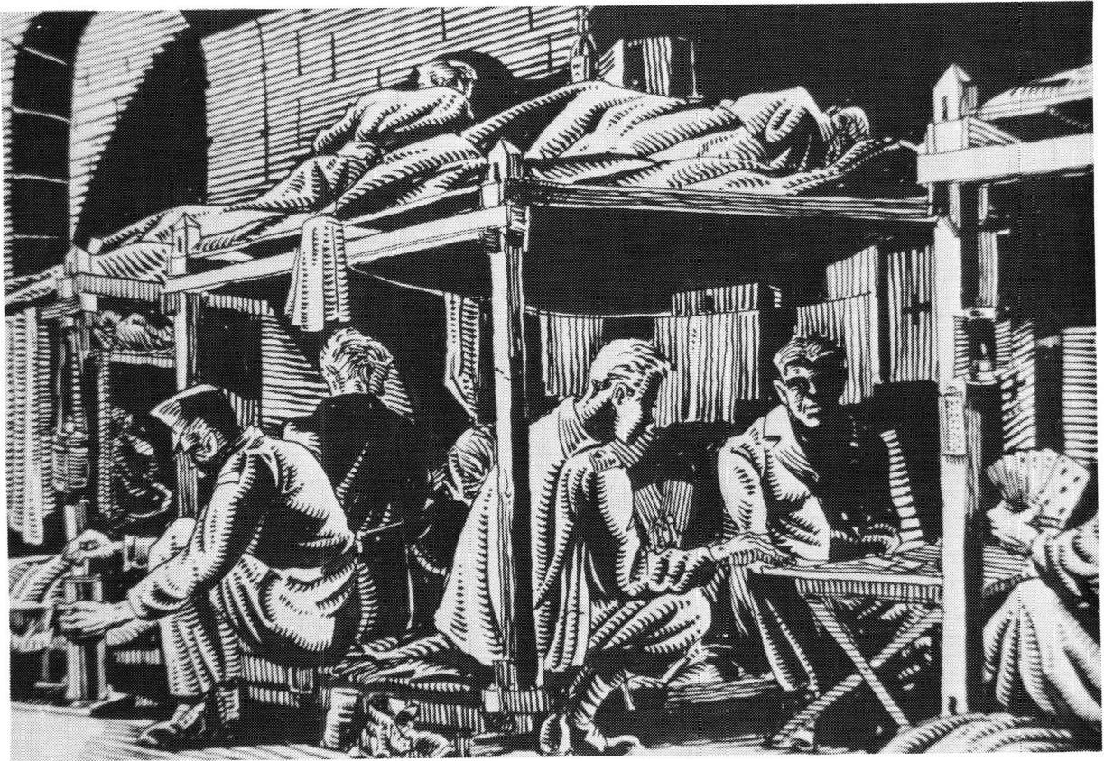
Hierdie sketse is ook deur Ogilvie geskets. Dit is tonele wat hulself in die kampe afgespeel het waar Ogilvie-hulle gevange gehou is