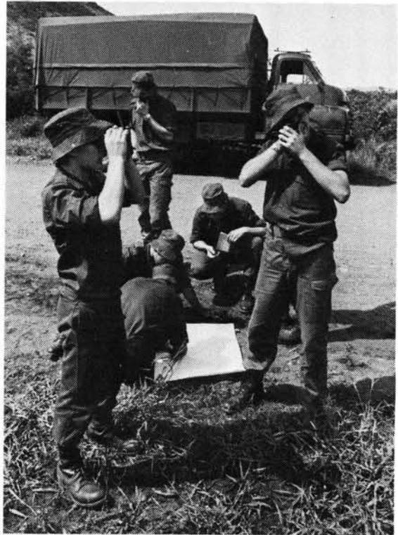
As 'n mens jou posisie moet vasstel is dit noodsaaklik om te weet hoedat kompaspeilings geneem word

Die volgende sekondêre doelstellings word ook nagestreef: