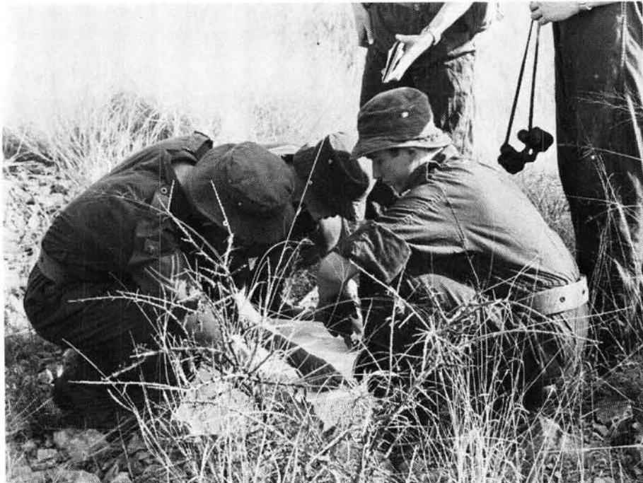
Met of sonder 'n kompas – 'n kaart bly 'n handige instrument, veral as mens hom verstaan

Die kadetprogram (sillabus) is sodanig saamgestel dat sekere komponente (vakke) gedurende die twee periodes (ongeveer 1 uur) wat aaneenlopend tot die skooldag is, aangebied kan word, terwyl die praktiese vakke gedurende kampe en bivakke in 'n militêre milieu aangebied moet word. Dit is daarom dan ook belangrik dat elke seun gedurende sy hoërskooljare die geleentheid moet kry om 'n kamp by te woon. Die klem van kadetopleiding val op motivering, skiet, dril en deelname aan kompetisies.