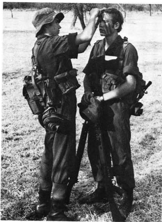
Tydens kadetkampe leer die seuns ook kamoefleertegniese aan

Die SA Tussen-afdelingskietkompetisie is 'n posliga wat deur al die kadetafdelings in die land in hulle eie tyd volgens voorgeskrewe tabelle geskiet word. Die resultate word finaal deur Leërhoofkwartier gekontroleer, wat dan die wenners aanwys en die trofees vir die verskillende fasette daarvan uitgegee.