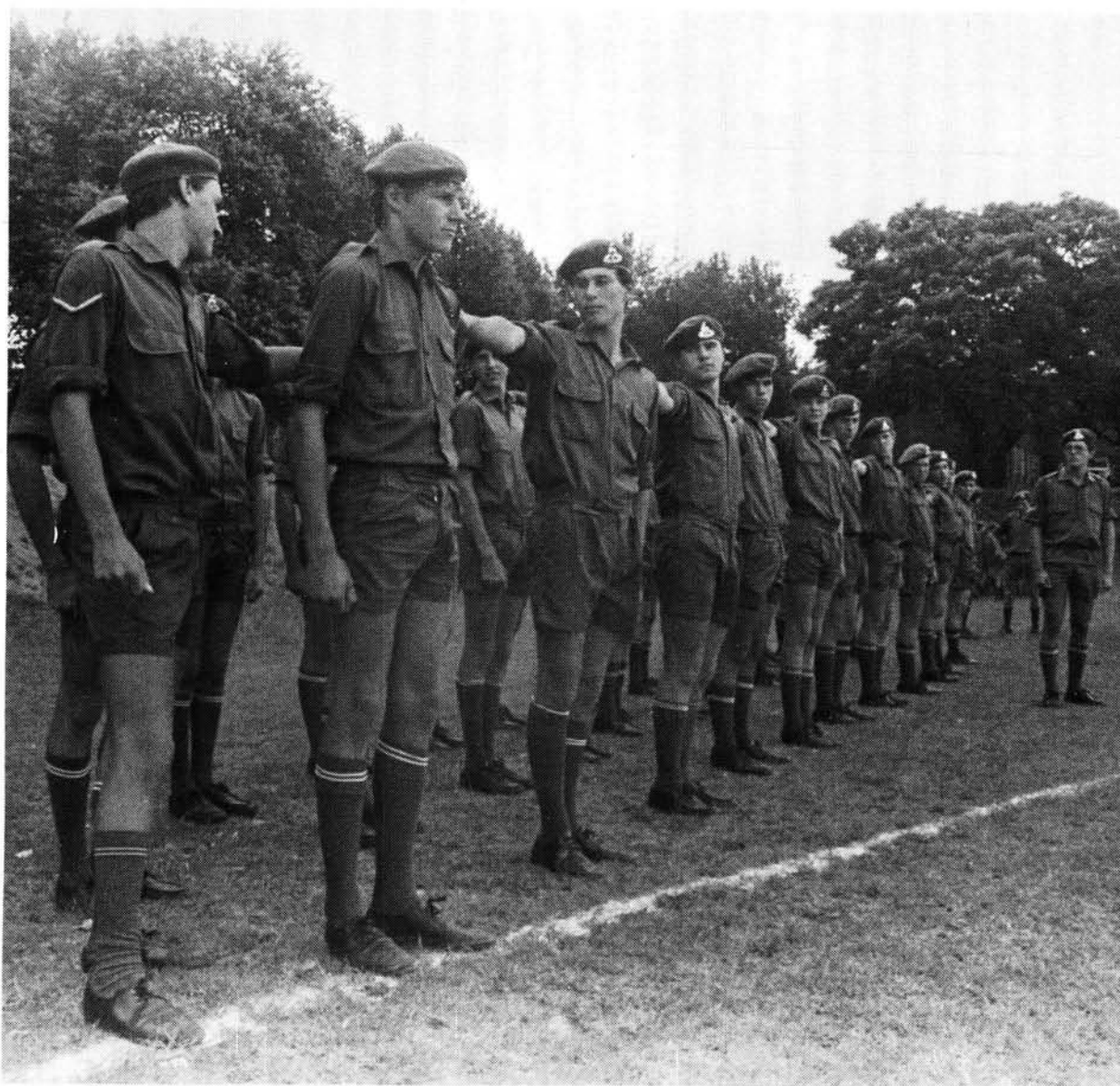
Tydens kadetopleiding leer die seuns al die fynere kunsies van drill

Ironies is dat die bedryf van kadette afgeskaal is toe algemene diensplig ingestel is. Die diensplig het intussen sy volle beslag gekry en in Weermagkringe het die gedagte posgevat dat skoolkadette 'n deeglike ondersoek vereis ten einde die skoolgaande seun vir sy komende nasionale diensplig te oriënteer.