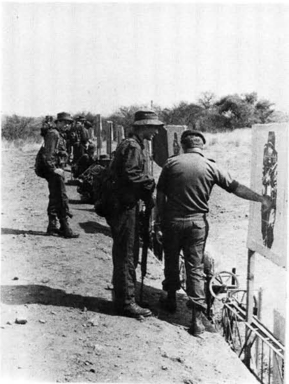
Weermaginstrukteurs leer die seuns akkuraat skiet

Senior seuns word toegelaat om by kommando-eenhede te affilieer en neem dan deel aan skiet en ander opleiding.