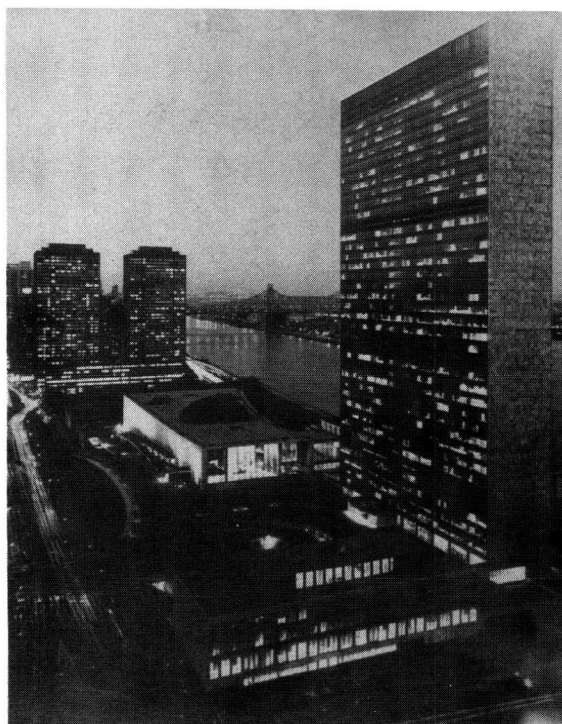
Die VVO se hoofkwartier in New York

"To maintain international peace and security; To develop friendly relations among nations; To co-operate internationally in solving international economic, social, cultural and humanitarian problems and promoting respect for human rights and fundamental freedoms; To be a centre for harmonising the actions of nations in attaining these common ends." 4