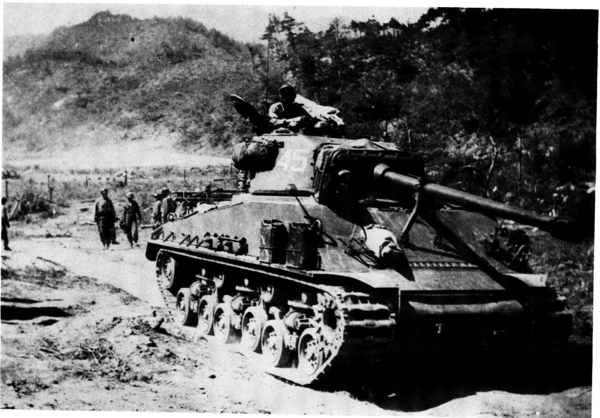
Een van die WO se tenks in aksie. Is dit nie ironies dat 'n vredesorganisasie met tenks te werk moet gaan nie?