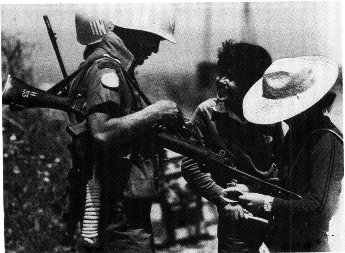
WO-vredesmagte, wat al vir langer as twee dekades in die Midde-Ooste geplaas is.

Van effektiewe optrede van hierdie mag was daar min sprake en 'n skietstilstand is eers in 1973 met die vredesonderhandelinge in Parys bereik. In 1973 het die ICCS (International Commission for Central and Supervision) tot stand gekom, maar net soos sy voorganger, ICSC, was dit uiters oneffektief. Hieroor het Rikhye et al hul soos volg uitgelaat: "The mechanism for controlling and supervising the ceasefire remains ineffective. The joint Military Commissions were and are unable to agree on anything of substance other than the exchange of the pris-