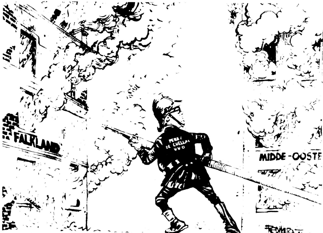
Fred Mouton van Die Burger skets die toestand van die VVO – 'n Organisasie wat nie die vuur van oorlog kan blus nie (DIE BURGER – 8/6/82)

Betekenisvol is ook die feit dat hierdie vredesmag nie effektief kon optree ten opsigte van die vele skermutselinge wat sedert 1968 plaasgevind het nie. 14