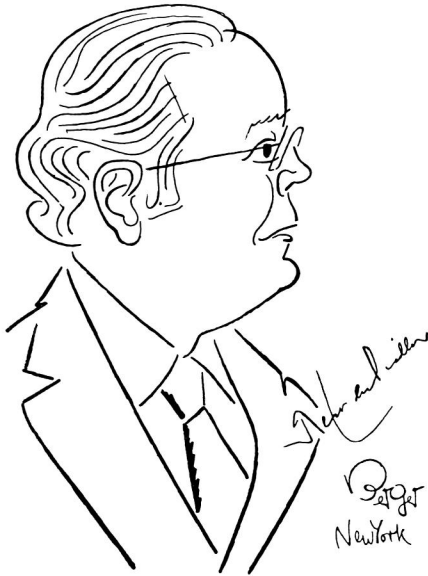
JAVIER PEREZ DE CUÉLLAR U.N. Secretary-General Autographed sketch, drawn from life, by OSCAR BERGER

munication without the external pressure of media or other parties. Finally it appears that, in the absence of unanimity in the UN Security Council, a peacekeeping force, which is established outside the UN framework, but based on established principles of international law, can contribute positively to international peace and security." 20