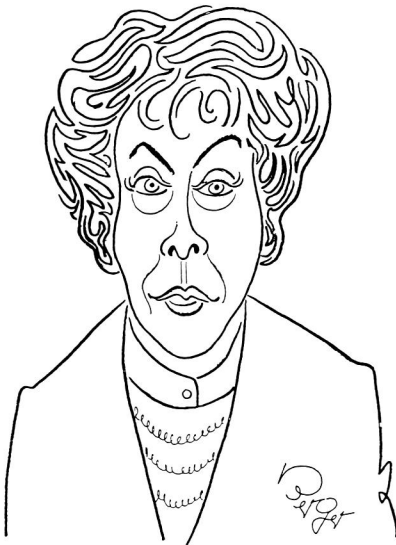
MRS. JEANE J. KIRKPATRICK United States Ambassador to the UN

Die Sekretaris-Generaal van die VVO, Die Onder-Sekretaris-Generaal van die Departement van Openbare Inligting, Amerika se Ambassadeur by die VVO en die President van die Algemene Vergadering (Onderskeidelik geneem uit SECRETARIAAT NUUS van 15/1/82, 15/4/83, 16/2/83 en 30/9/81.)