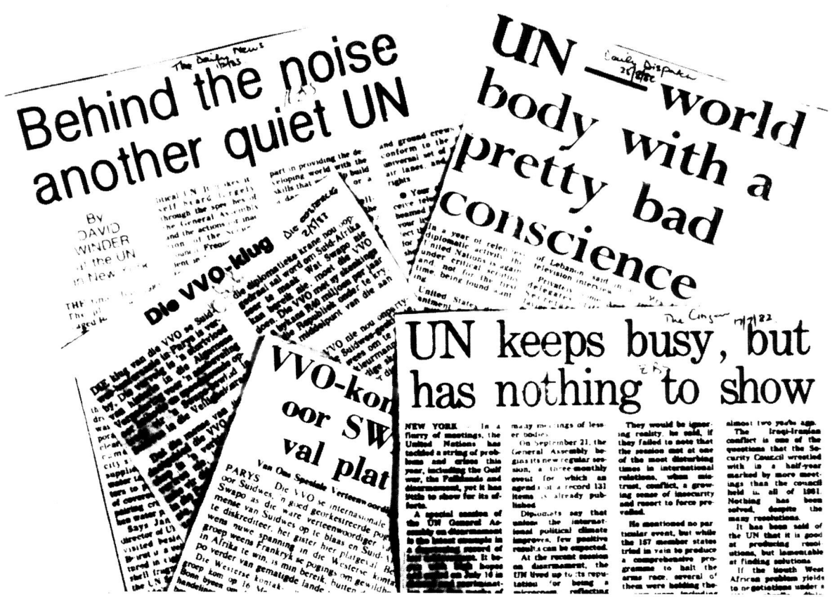
Hoerante vertel die hele storie soos hierdie opskrifte aandui.