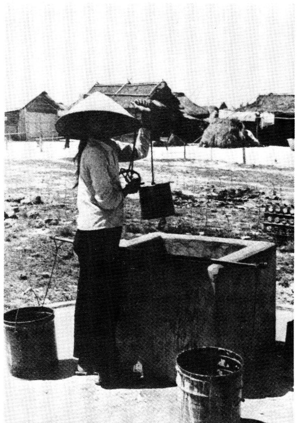
Die pasifikasieprogram in aksie. 'n Put in 'n 'New Life' dorpie. Verbeterde materiële toestande het wel insurgensie teengewerk, maar die langtermyn oogmerk – nasionale solidariteit – is nooit bereik nie

Ten spyte van die suksesse van die pasifikasie-program tov verbeterde materiële toestande, het