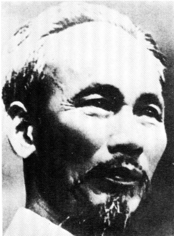
Ho Chi Mink. Sy doelgerigte leierskap het as 'n sterk motiveringsbasis vir die kommunistiese magte gedien.