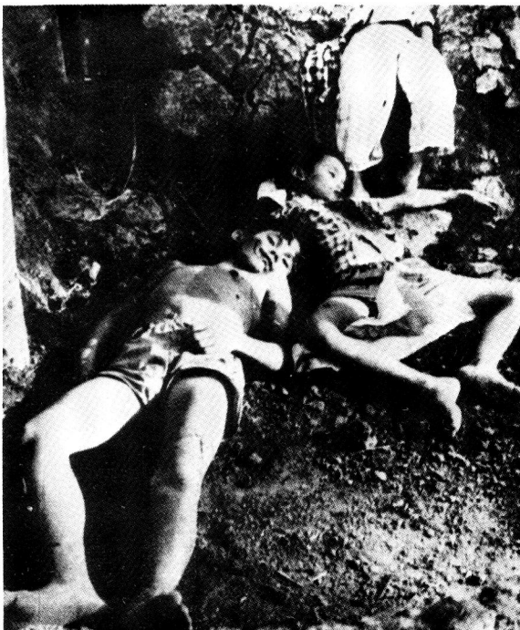
Slagoffers van die Viëtkong. Die wandade van die terroriste het baie minder dekking in die Amerikaanse pers gekry; terwyl enkele Amerikaanse vergrype vanweë die sensasionaliteit daarvan, heeltemal buite verband geruk is.

In die aanwending van sy lugmag het die VSA sy slaankrag vermors deur sporadies en onder streng beperkings teikens in Noord-Viëtnam aan te val. Dié soort taktiek kon Hanoi se infrastruktuur nie sodanig vernietig dat dit hul oorlogspoging ontwrig het nie. Dit is dan ook vanweë dié feit en Amerikaanse verklarings dat Noord-Viëtnam nie ingeval sou word nie, dat die Demokratiese Republiek van Viëtnam (DRVN) die oorlog met soveel vertroue kon voortsit. Die voortbestaan van die teikenstaat was dus nooit werklik bedreig nie. Ten spyte van al dié foute wat op die