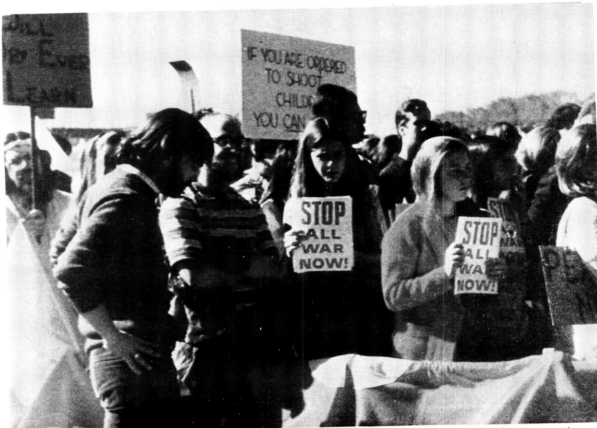
Protesoptogte in die VSA het die onwilligheid van die Amerikaanse volk om aan 'n verafgeleë oorlog ten gunste van 'n onbetroubare bondgenoot deel te neem, getoon. Gemoedere is egter ook opgesweep deur verdraaide beriggewing in die Amerikaanse nuusmedia.