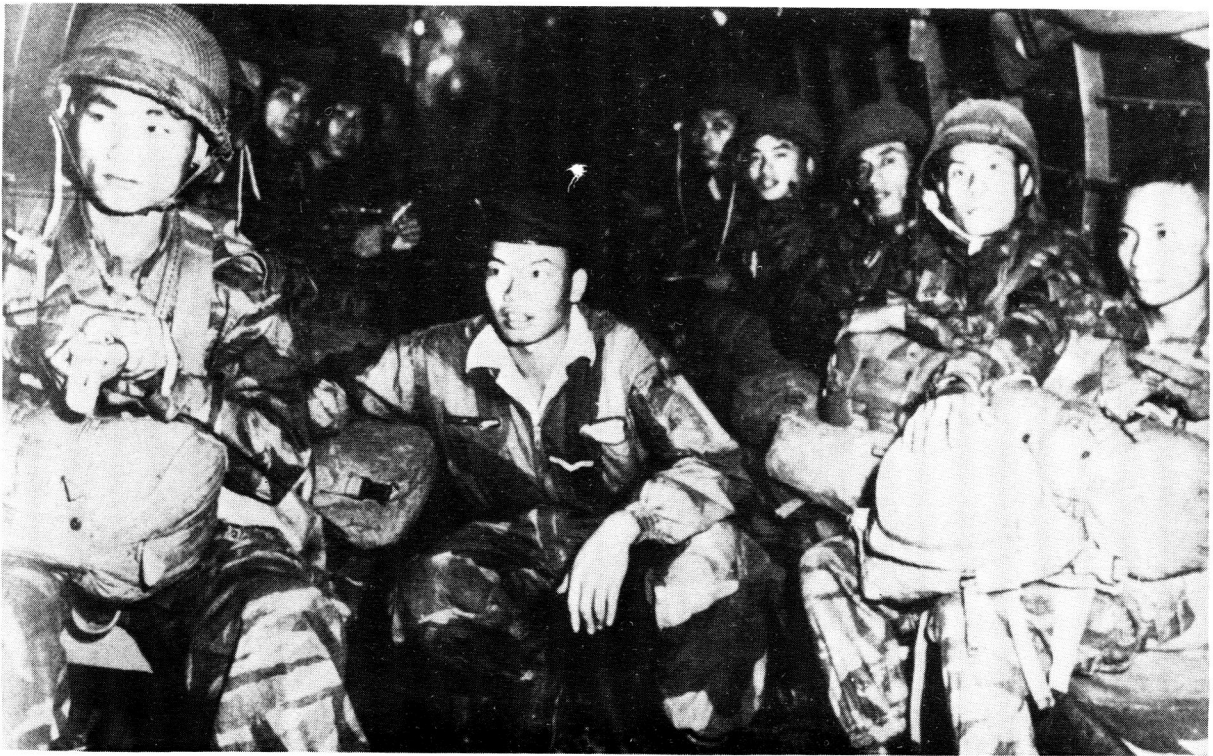
Suid-Viëtnamese valskermersoldate. Sterk twyfel oor die wil om te veg van die Suid-Viëtnamese weermag het ook 'n negatiewe invloed op die Amerikaners gehad. Hierdie twyfel is uiteindelik bevestig met die skielike ineenstorting van 1975.

able to achieve ... the object which lay beyond the war – the allegiance of the people of South Vietnam to their own government, which alone could guarantee final victory'. (Guenter Lewy in America in Vietnam )