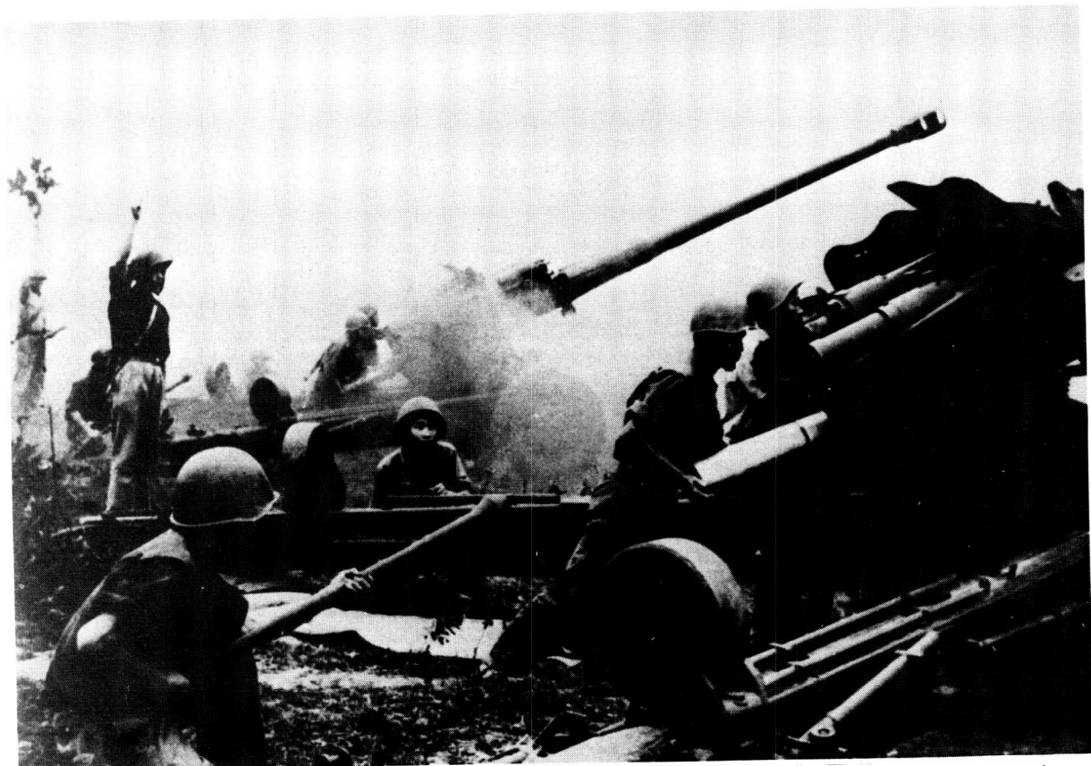
Die laaste offensief. Noord-Viëtnamese artillerie in aksie. Die wil om te veg en die uithouvermoë van die Noord-Viëtnamese soldate en die Viëtkong terroriste is pal onderskat.