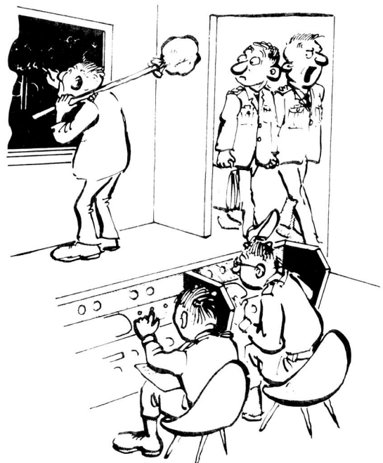
Die Masjiene vervang nie die instrukteur nie, neem net sekere funksies oor.

Skinner se vereiste dat elke respons van elke student op die regte tyd bekragtig moet word (iets wat die dosent/instrukteur nie eers vir 'n enkele student kan doen nie) het die idee van 'n masjien na vore gebring (1:6). Alhoewel hy vandag beskou word as die vader van die onderrigmasjiene (8:17), sien hy nie die masjiene as plaasvervanger vir die dosent/instrukteur nie – dit kan slegs sekere funksies oorneem (11:23).