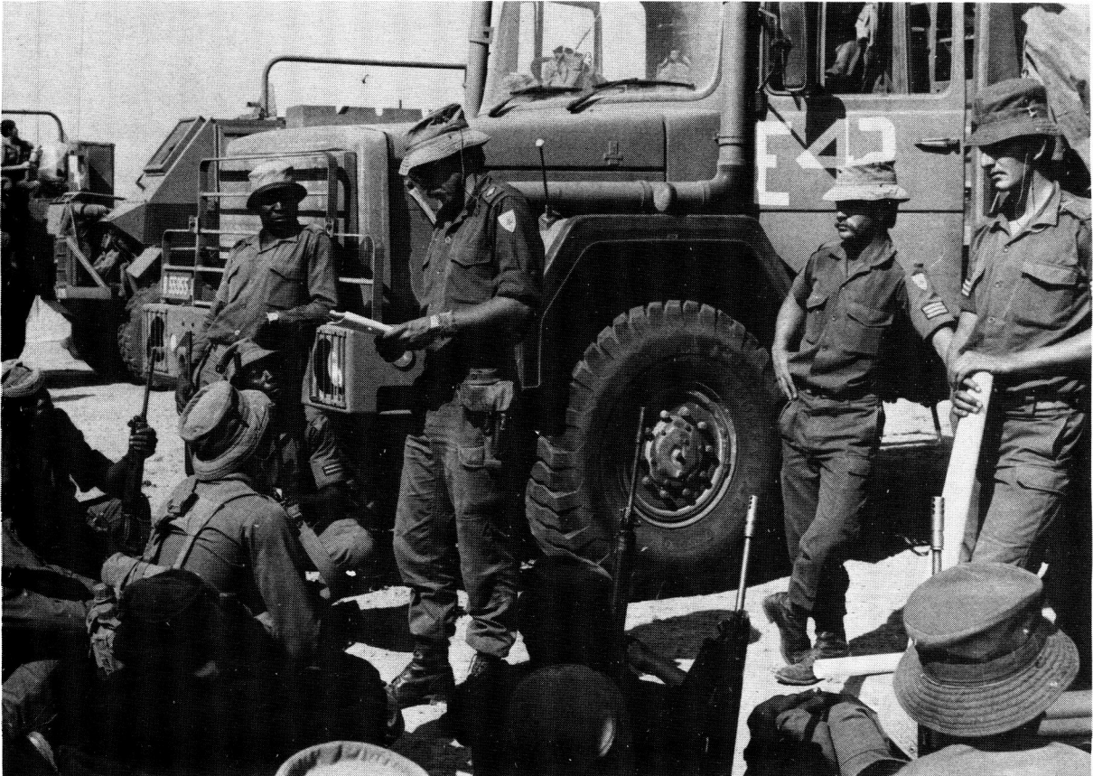
Lede van die Suid-Afrikaanse Veiligheidsmagte in SWA word tydens 'n operasie teen die militêre vleuel van SWAPO voorgelig – 'n blik op 20 persent van die stryd teen terrorisme.

die sosio-ekonomiese lewe van SWA. Militêre personeel is byvoorbeeld ten nouste betrokke by die lewering van gemeenskapsdienste.