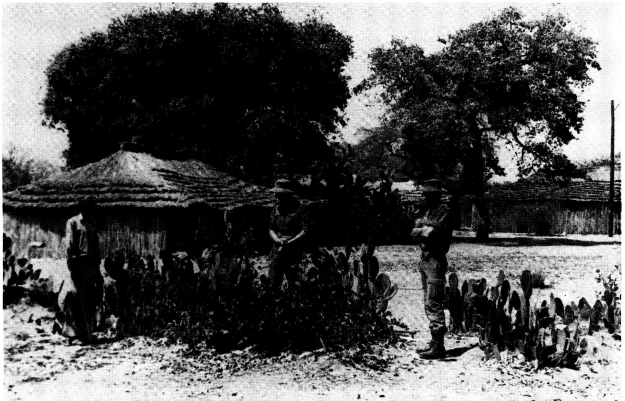
In hierdie ruim hutte in die vakansiekamp Maria Mwegere gaan die kinders tuis. Die kamp het genoeg akkommodasie vir tussen 400 en 500 kinders.

veestapels en bestryding van peste, plaë ens het die SAW, dienspligtiges voorsien. Hulle is hoofsaaklik veeartse, voorligters en tegnisi. Om die nodige inligting oor te dra is landboukolleges by Ogongo (Ovamboland) en Mashare (Kavango) opgerig. By Kapako (Kavango) is ook 'n opleidingsentrum waar voornemende boere opgelei word in die tegnieke van aanplanting, bemesting en besproeiing van groente. Lede van die plaaslike bevolking wat in boerdery belangstel, kry ook van die Kaisosi-projek 'n stuk grond van 1 hekt.