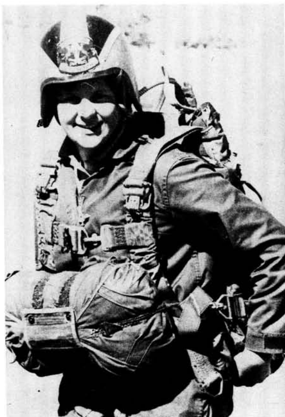
'n Vrou in volle valskerm mondering en helm tydens valskermopleiding van Vroue by George.

In hierdie artikel word 'n wye spektrum van aspekte rakende die posisie van die vroulike militêre aangesny, en daar word gelet op die uiteenlopende standpunte wat in verskillende gemeenskappe gehandhaaf word. Die vrou in uniform se aandeel aan gesinslewe en moederskap, haar opkommandering, opleiding en aanvaarding as leier word bespreek. Die vrou se aandeel aan terroristiese bedrywighede word aangesny. Die aanwending van die vrou in verskillende lande word ook vlugtig verken met toeliggende kommentaar deur skrywers.