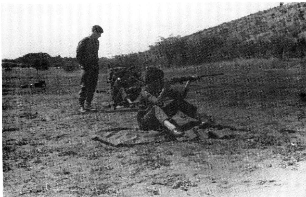
Vroue van die SAW besig met skietopleiding