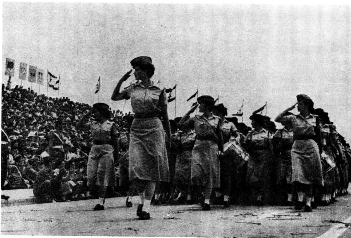
Vroue van die Israëli Weermag doen 'n verbymars by die saluebasis.

Suid-Afrikaanse vroue in die SA Leërvrouekollege word na basiese opleiding en spesialisasie na eenhede gepos nes die geval met nasionale dienspligtiges is. Na 'n jaar van diensplig moes vroue 5 kampe gedurende hulle 10 jaar van diens. 33