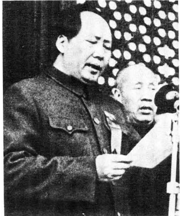
Mao Tse-tung het gesê: 'Political power grows out of the barrel of a gun'

Mao Tse-tung se stelling: 'political power grows out of the barrel of a gun' was die grondslag waarop hy sy revolusie gevoer het en waarvolgens dit in ander lande ook toegepas word. 87