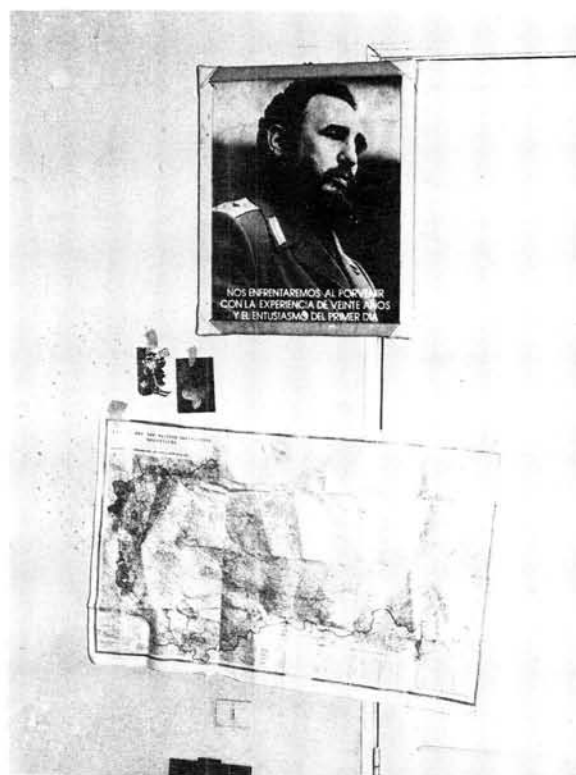
Fidel Castro, revolusionêre middelklas leier, het die bewind in Kuba by genl Batista oorgeneem

Die revolusies wat Castro en Guevara verkondig is dus ideologies, militêr en polities gefundeer gepaardgaande met geweld en die instelling van sosialisme.