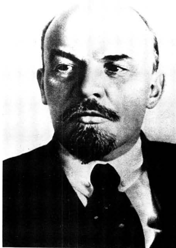
Ook in Rusland is die proletariaat deur 'n intellektuele groep gelei tydens die revolusie. Professor Karl Marx en die intellektualis Lenin is goeie voorbeelde hiervan