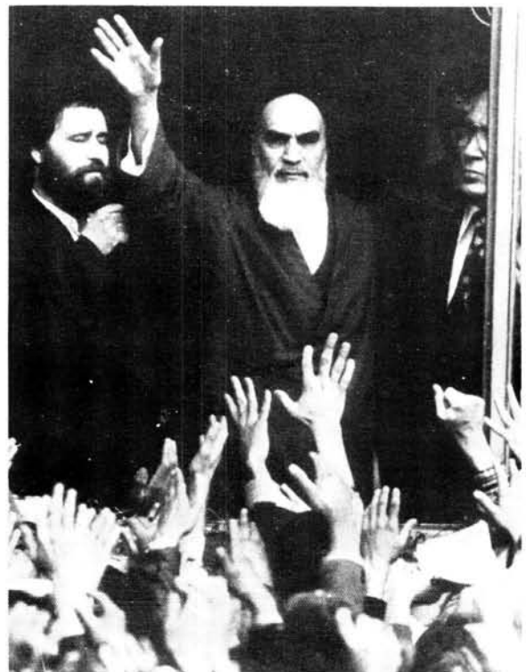
Die revolusionêre geestelike leier Ayatolla Khomeini onder wie se bewind openbare teregstellings feitlik 'n alledaagse verskynsel geword het in Iran