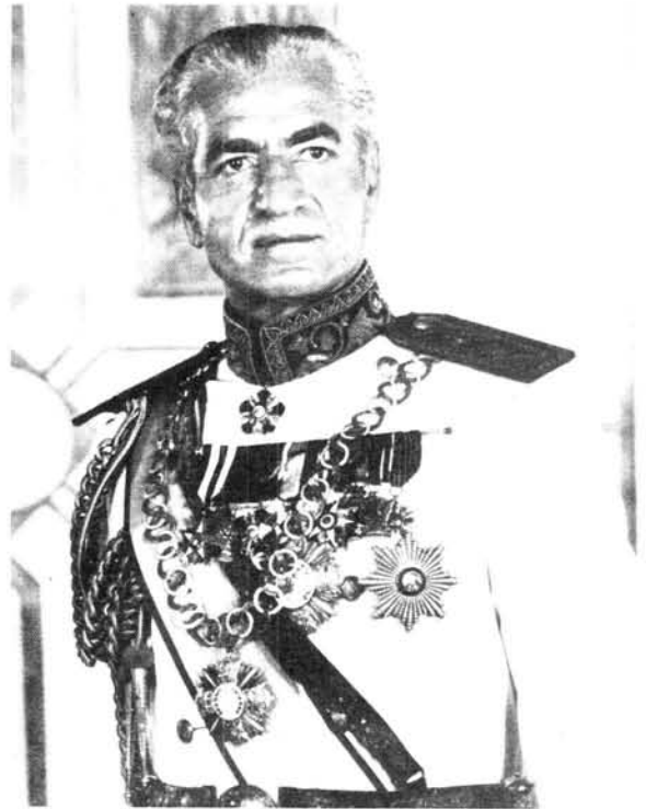
Die Sjah van Iran het nie besef dat die bevolking in 'n identiteitskrisis gewikkel was nie

lik oor die hoof gesien het. Belangrik is dit om daarop te let dat die Sjah nes genoemde heersers kontak met sy onderdane verloor het.