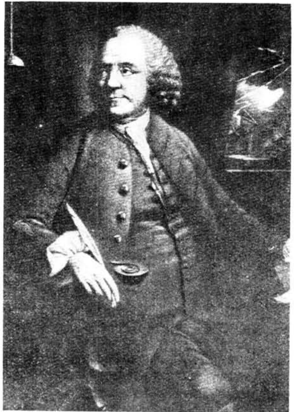
Hoewel die Amerikaanse Revolusie nie 'n direkte invloed gehad het op die Franse Revolusie nie, het die denke van Amerikaanse revolusionêre soos Benjamin Franklin tog wel 'n rol gespeel