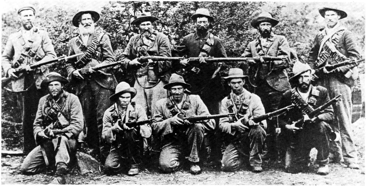
'n Groep Boerekrygers te velde in die Tweede Vryheidsoorlog. Ondanks die felle invloed van eksterne fisiese faktore op die Boeremagte se moreel, kon hulle drie jaar lank die stryd volhou en selfs teen die einde was daar baie wat bereid was om voort te veg

Die finale toets vir moreel aldus Baynes, is of jy bereid is om jouself op te offer. 25 Railey het in sy verslag die moreelkrisis van die Amerikaners in 1941 aan nasionale onsekerheid toegeskryf. Hy stel dit dat as die Amerikaanse politieke leiers 'n militêre doelstelling gehad het, hulle dit nie aan die leër verduidelik het nie. 26