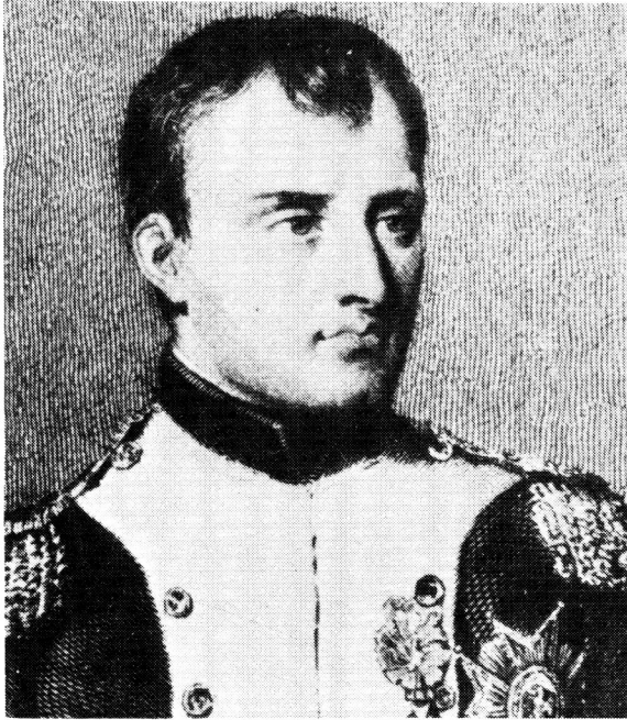
Die Franse veldheer Napoleon Bonaparte wat deur sy besielende leierskap en charisma 'n hoë moreel by sy soldate ingeboesem het

veggees enige leër met 'n lae moreel en 'n swak gees wat drie keer talryker is, kan verslaan. 5