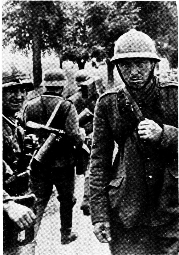
Duitse soldate en 'n Franse krygsgevangene tydens 'n veldslag in die Tweede Wêreldoorlog. Faktore soos 'n effektiewe propagandamasjien, deeglike militêre skoling en totale volksbetrokkenheid het 'n hoë moreel by die Duitse soldaat ingeskerp

king, 'n trots om gekies te wees as soldaat van die vaderland. Die Duitse soldaat is deur homself en deur die nasie as lid van 'n bevoorregte burgerskap beskou. 10