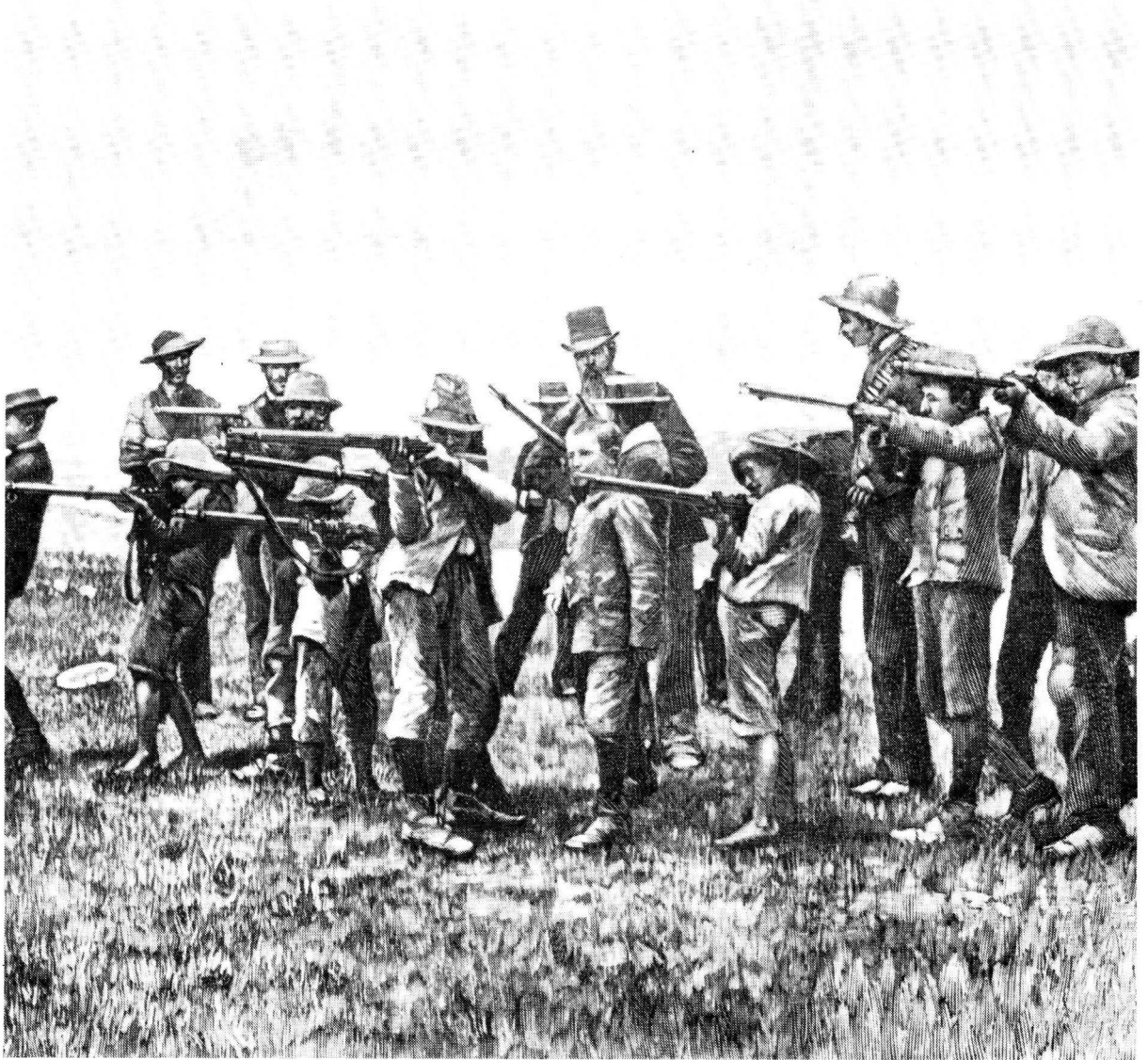
Boerseuns besig om deel te neem aan 'n skietoefening

In 'n brief aan pres Steyn op 23 Desember 1911 het Smuts Steyn bedank vir die waardevolle op-