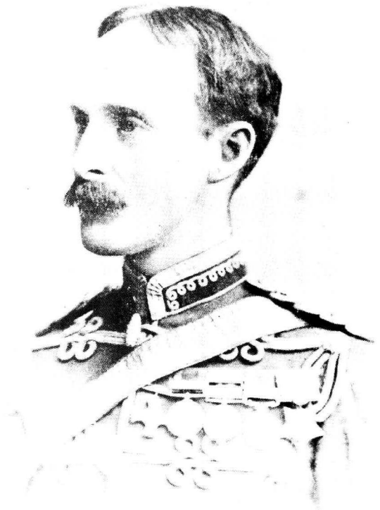
Maj Ian Hamilton in 1887

Vir die eerste keer, tydens die Slag van Elandslaagte, tree Hamilton op as 'n bevelvoerder in die veld. Hy voer die infanterie op so 'n puik wyse aan en hy gedra hom so kloekmoedig, dat Sir George White hom vir die Victoria Cross dekorasie aanbeveel. Hy kry dit nie — want nou is hy te senior en VC's word nie aan generaals gegee nie.