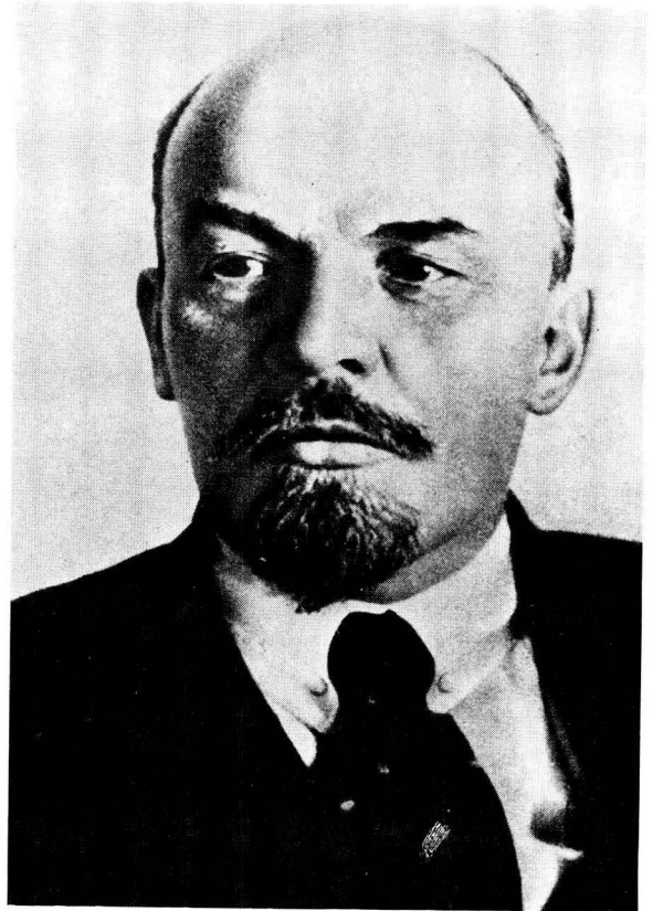
Terroriste en Terroriste-aanhangers probeer hulself vorm volgens die model van ander rewolusionêres soos Lenin en Marx.

Skakings is eers in 1958 — 1959 as 'n politieke instrument gebruik toe Fidel Castro se broer, Raoul, begin het met skakings van vliegtuie na Kuba. Dit is gevolg deur 'n hele aantal skakings