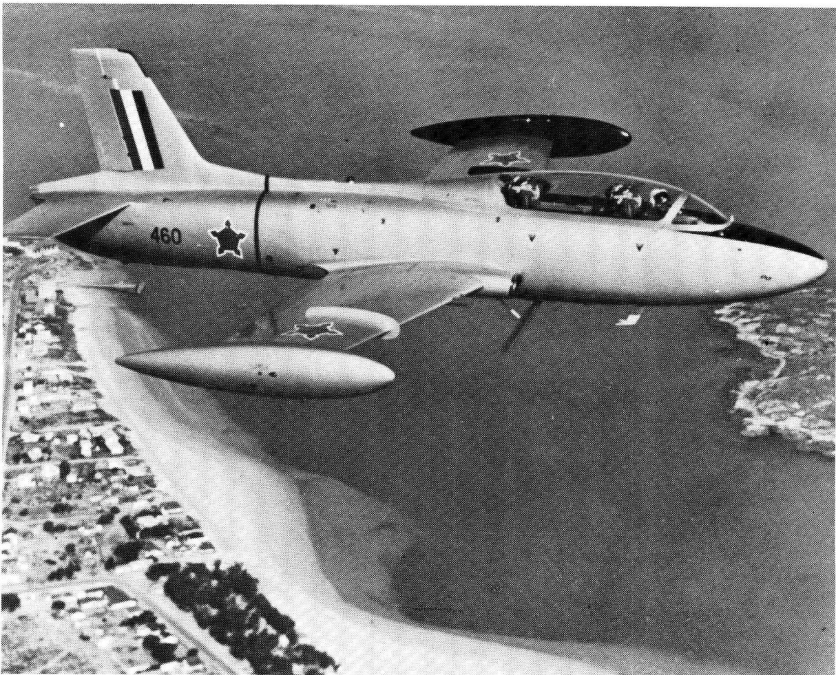
Die Atlas Vliegtuig Korporasie beskik reeds oor beperkte vermoë om die Impala vliegtuig te bou.

Die beginsel word aanvaar dat die lugmag ook ander take het en 'n rol te speel het in operasies anders as ter ondersteuning van die leër of vloot. Die klem word egter steeds gelê op samewerking. Die militêre bedreiging wat die RSA vandag in die gesig staar is miskien primêr onkonvensioneel van aard en die klem word hoofsaaklik gelê op ligte vliegtuie en helikopters, dus die nodige lugvervoer. Die ontplooiing van rewolusie in Afrika toon egter dat tydperke van onkonvensionele oorlog onverwags gevolg kan word deur 'n meer konvensionele fase gesteun deur bv die USSR of sy handlangers, soos bv in Angola en die Ogaden. Dit vereis dat die lugmag hoewel tans oorwegend besig met onkonvensionele oorlog, nooit sy konvensionele uitrusting en kundigheid kan verwaarloos of heeltemal op die agtergrond skuif nie. Dit is inderdaad die konvensionele vliegtuie en lugverdediging wat die grootste rol speel in die lugmag se aandeel aan die afskrikpostuur waaroor die SA Weermag in Suidelike Afrika beskik.