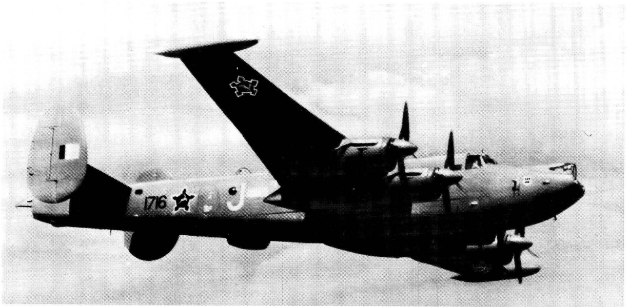
Shackleton vliegtuig van die SALM