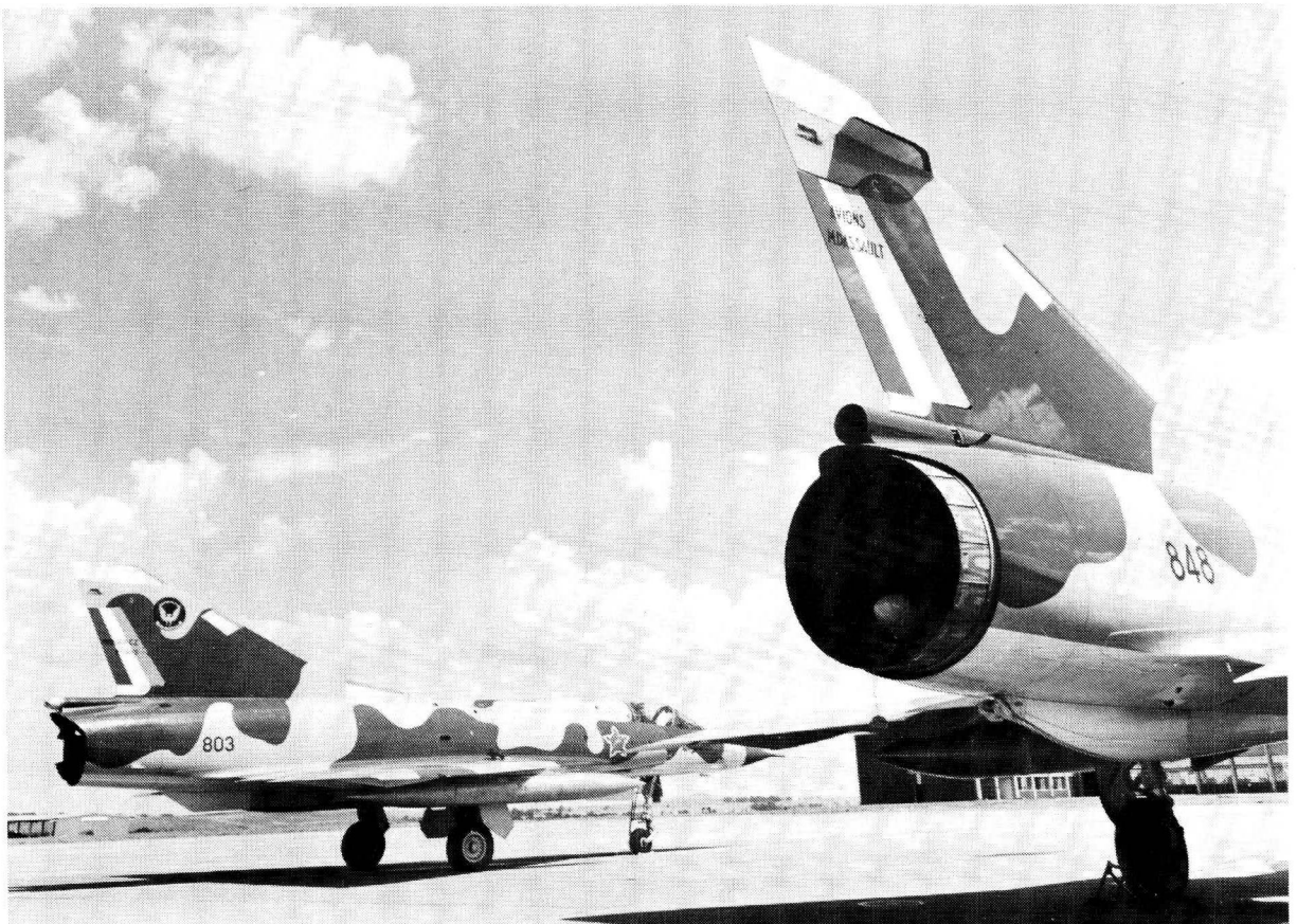
Die gesofistikeerde Mirage kan deur die Atlas Vliegtuig Korporasie onder lisensie monteer word.

Shackleton en Sabre. Aan die positiewe kant het Atlas nou reeds beperkte vermoë om vliegtuie soos die Impala, Bosbok en Kudu te bou en gesofistikeerde Mirage FI's onder lisensie te monteer. 21 Dit is 'n aanduiding daarvan dat die lugmag, soos die res van die SA Weermag, deur die internasionale politieke situasie beïnvloed word. As gevolg van sy politieke beleid word die RSA vanuit verskeie oorde bedreig deur terroriste. In SWA word 'n lugkomponent besig gehou in die stryd teen SWAPO, lugvervoer en logistieke steun van die magte in SWA verg 'n aansienlike lugvervoerpoging. Intussen is 'n moontlike terroriste bedreiging uit Mosambiek, Swaziland, Zimbabwe en Botswana 'n werklikheid om mee saam te leef, terwyl binnelandse onluste ook terselfdertyd kan voorkom. Dit alles stel hoë eise aan die lugmag, wat noodwendig in lugkomponente vir verskillende gebiede verdeel sal moet word, terwyl konvensionele en maritieme magte ook in stand gehou moet word. Onafhanklike tuislande stel ook groter eise aan lugvervoer en lugverkenning terwyl lugruimprobleme opduik soos in die geval van Transkei se eensydige opskorting van die nie-aanvalsverdrag met die RSA.