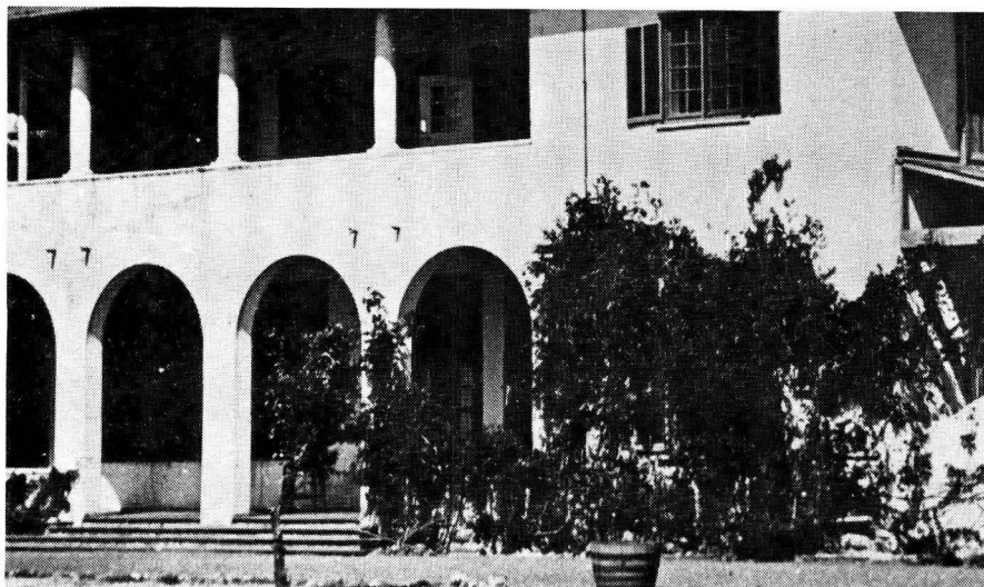
SALM Hoofkwartier 1921 Pretoria is die tradisionele setel van die SA Lugmag en 'n groot deel van die lugmag is saamgetrek in en om Pretoria

kuslyn van ongeveer 4 000 km 17 vereis maritieme vliegtuie met 'n lang houtyd soos dié van die verouderde Shackleton MR3s wat tans nog in diens is of anders 'n gesofistikeerde vinnige maritieme vliegtuig soos die Nimrod, Orion of Atlantic wat baie duur is en nie aan die RSA beskikbaar is nie. Sommige dele van die RSA is so onderworpe aan mis soggens en ander dele weer aan hoë temperature dat vliegvelde in daardie streke aan sulke beperkings onderhewig is dat dit nie ekonomies daar gebou kan word nie. Saam met die ontwikkeling van Pretoria as administratiewe hoofstad van die RSA en tradisionele setel van die SA Weermag en ook die SA Lugmag, vind ons 'n groot deel van die lugmag saamgetrek in en om Pretoria.