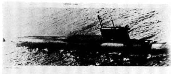
Die Y-klas duikboot wat deel van die kernafskrikingsmag van die Sowjet-Unie moes vorm, het 10 jaar geneem om te voltooi.