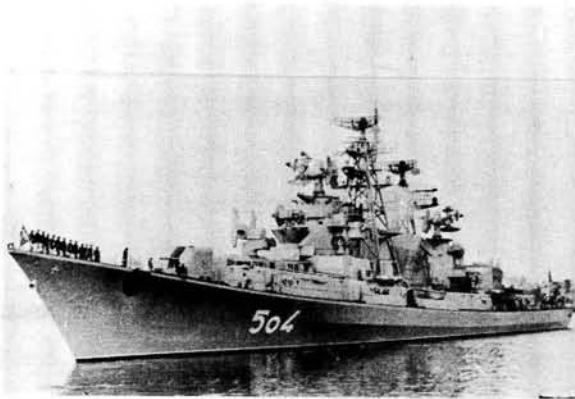
Die KASHIN-klas was die eerste oorlogskip ter wêreld wat uitsluitlik op die aandrywing van gas turbines staatgemaak het.

Teen 1960 het die SSM die hoofbewapening van Sowjet-oorlogskepe geword en het die skip-tot-lug missiel (SAM) reeds 'n belangrike rol begin speel. Die Sowjet-vloot het in die Khrushchev-era sy grootste groei gesien en 'n groot hoeveelheid verskillende klasse skepe en duikbote het die lig gesien. Skepe wat na 1964 in diens geneem is, was reeds gedurende die Khrushchev-bewind ontwerp, want 'eight to ten years are frequently required in Western Navies between the inception of a ship's design and the first of the class being commissioned'. 32