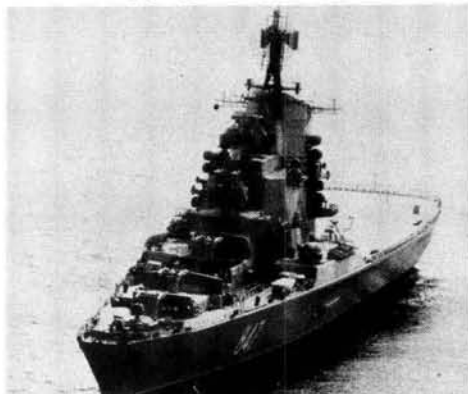
Die MOSKVA-klas helikopterkruiser wat 'n oënskynlike opvolg is van die KIEV-klas vliegdekskip.

Die gevolgtrekking wat hier gemaak kan word, is dat die besluite, om sekere klasse van oorlogsskepe te bou, voor die missielkrisis geneem is. 'Because of leadtimes it can be argued that the hardware decisions to support Soviet Naval expansion pre-dated Cuba. If this is true, the most that can be said about the experience of October 1962 is that it confirmed a growing appreciation of naval power'. 59