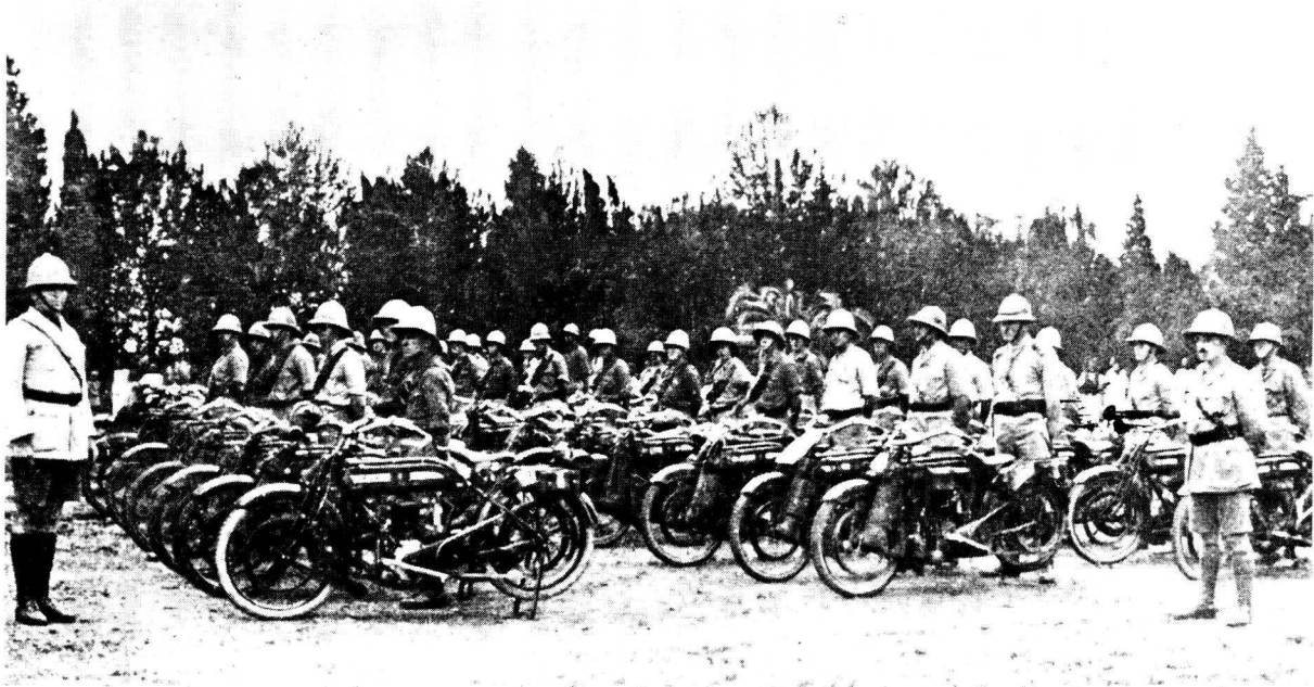
Lede van die Suid-Afrikaanse Motorfietskorp te Zomba, Nyasaland.

teen die Duitse magte wat daarheen opgetrek het. Hier was hulle vir drie dae lank in hewige gevegte met die Duitsers betrokke. Hoewel Von Lettow Vorbeck, die aanvoerder van die Duitse magte in Oos-Afrika, 'n uitstaande bevelvoerder en strateeg was, moes hy egter op 28 Augustus terugval. Slegs 'n aantal skerpskutters het agtergebly om sy agterhoede te dek.