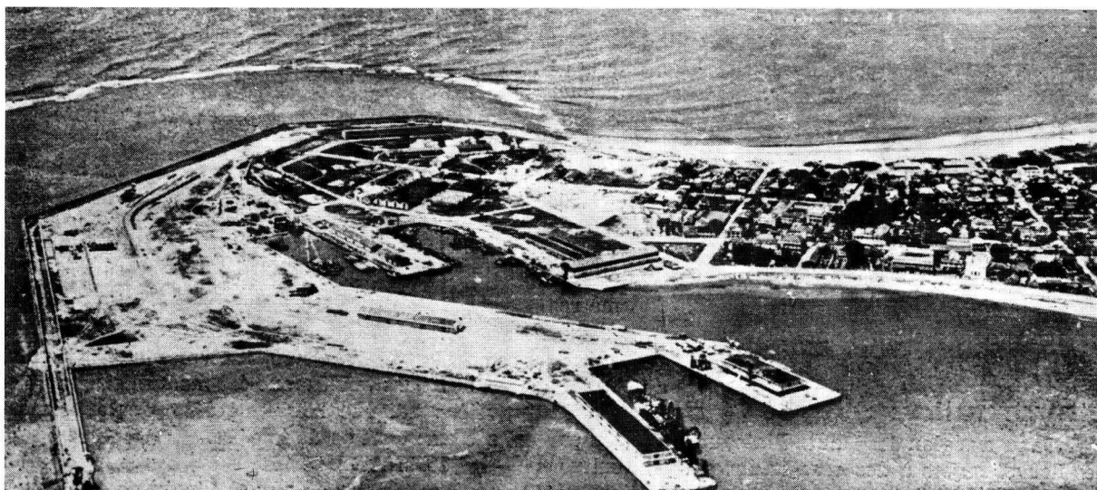
Tamatave, 1942.