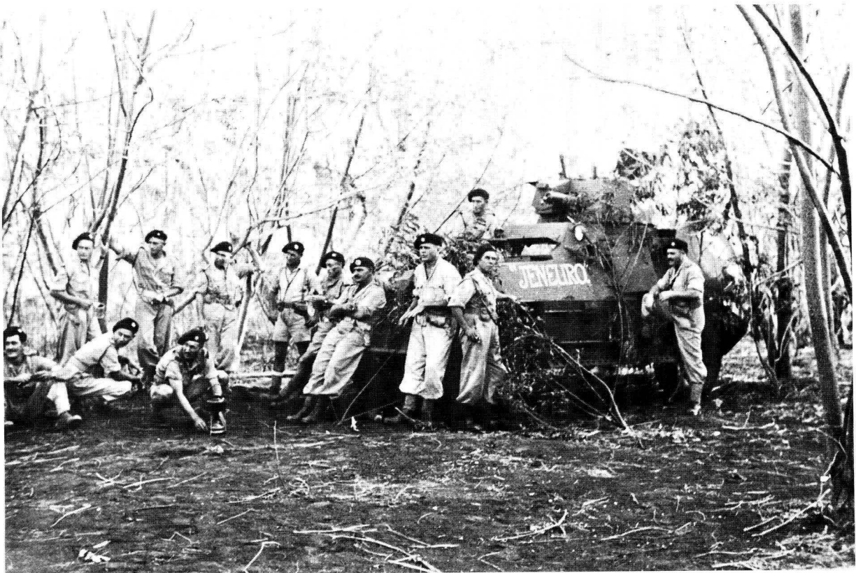
Suid-Afrikaners by 'n pantsermotor.