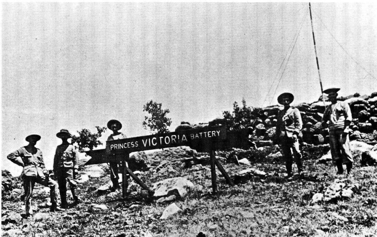
'n Vloot brigade, wat aangewend is in Ladysmith se verdediging, by Princess Victoria Battery op Cove Redoubt .