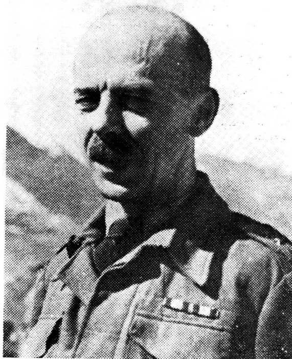
Genl Bor-Komorowski — bevelvoerder van die Poolse ondergrondse leër tydens die opstand in Warskou.

Aangesien die ondergrondse leër net voldoende voorrade en ammunisie vir ongeveer tien dae gehad het, is met die opstand gewag totdat die Russiese magte op die punt was om in Warskou in te beweeg. Op 29 Julie is hulle swaargeskut in die stad gehoor terwyl berigte twee dae later ontvang is wat beweer het dat die Russiese tenks reeds deur die laaste Duitse verdedigingswerke om Warskou, beweeg het. Intussen was Russiese vliegtuie reeds besig om die vliegvelde in die omtrek te bombardeer.