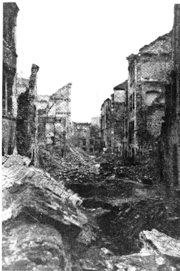
'n Verwoeste Warskou na afloop van die opstand.

Intussen het die steeds verslegtende situasie in Warskou sulke afmetings aangeneem dat generaal Bor-Komorowski op 28 September sy regering meedeel het dat hy geforseer was om oor te gee. Hongersnood was aan die orde van die dag en ammunisie tekorte het verdere weerstand bowendien onmoontlik gemaak. Na onderhandelings met die Duitsers het hy op 4 Oktober 40 aan die Poolse regering in Londen berig dat hy en sy staf om twaalfuur die volgende dag hulself aan die Duitsers gaan oorgee.