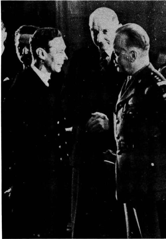
Genl Sikorski — Poolse Eerste Minister van die Poolse regering in bannelingskap en opperbevelvoerder van die Poolse magte gedurende die Tweede Wêreldoorlog, in gesprek met die Britse koning George VI.

Stalin was nie tevrede om net betrekkinge met Pole te verbreek nie. Hy het begin aandring op veranderinge in die struktuur van die Poolse regering in bannelingskap. Hy het gemeen dat die regeringsopset, soos dit toe daar uitgesien het, nie verteenwoordigend van die Poolse volk was nie. Sekere sogenaamde 'demokratiese organisasies' in die Verenigde State van Amerika, Sowjet-Rusland en Brittanje was, na sy mening, nie verteenwoordigend daarin nie. 10 Hy het ook die regering as 'n 'émigré Polish Government, isolated from its people' beskou en hulle verwytdat hulle nie opgewasse was om aktiewe weerstand teen die Duitsers in Pole te kon organiseer of om betrekkinge met Rusland te herstel nie. 11