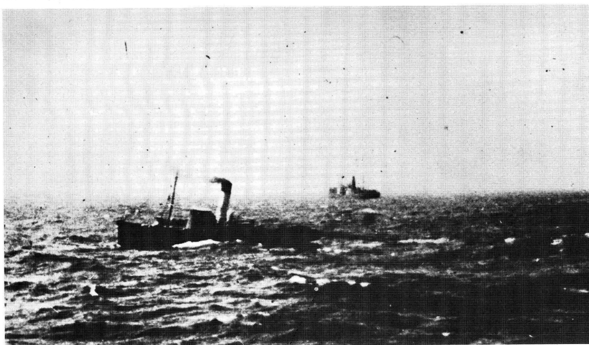
Die Suid-Afrikaanse konvooi voor anker by Lüderitzbucht.