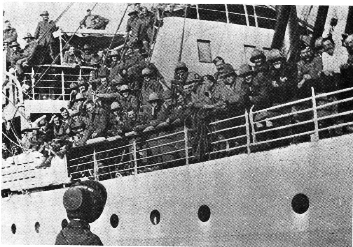
Suid-Afrikaanse Berede Skutters aanboord die Galway Castle.