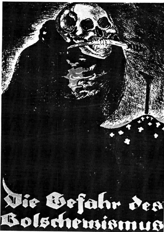
Die tradisionele Duitse voorstelling van Bolsjewisme was 'n skelet.

'Kruistog teen Joodse Bolsjewisme'. 32 Die term 'Untermensch' (minderwaardige mens) verwysende na volkere van Slawiese afkoms, soos die Russe, is vry algemeen gebesig in propaganda wat bestem was vir binnelandse sowel as buitelandse konsumpsie. Duitse nuusblaaie was volgepak met foto's van harige, nors Sowjet-gevangenes naas afbeeldings van aantreklike Duitse soldate in netjiese grys velduniforms. 33