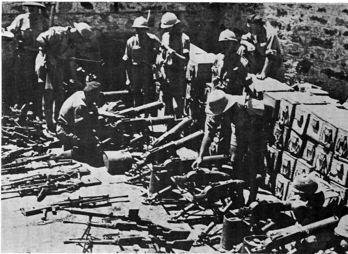
'n Deel van die aansienlike voorraad en hoeveelheid vyandelike outomatiese wapens wat tydens die suksesvolle gevegte teen die Italiaanse voorposte in Suid-Afrikaanse hande geval het

Die fontein by Hobok, in die omgewing waarvan die enigste groenigheid in die gebied groei, stoot die daaglikse watervoorsiening aan die Suid-Afrikaanse soldate op tot 1\frac{1}{2} gelling per kop. Rapporteer deur die 5 SA Infanteriebrigadegroep hoofkwartier bevestig die skoonmaak en herstel van die strategiese gewichtige waterputte deur die ingenieurs en sit die wye verkenningsbedrywighede wat vanaf Hobok as tydelike basis onderneem word, uiteen. Hierdie hoofkwartier-rapporte meld ook die latere terugtrekking van die brigadegroep, en wel op 13 Februarie, na El Gumu, vir deelname aan die daaropvolgende offensief teen Mega.