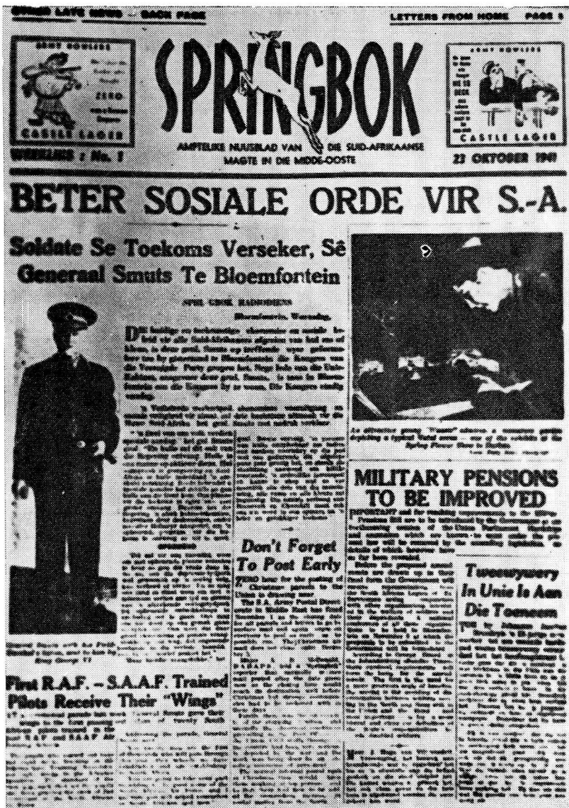
Die eerste bladsy van die eerste uitgawe van Springbok: Egipte, 1941

hulle gewig in goud werd omdat hulle die enigste was wat Afrikaanse berigte kon goedkeur en daarbenewens moes hulle ook as skakeloffisiere by die SA Formasies optree. Uit hierdie kort oorsig kom vier aspekte waaraan 'n openbare betrekingsorganisasie te velde aandag moet gee, duidelik na vore: