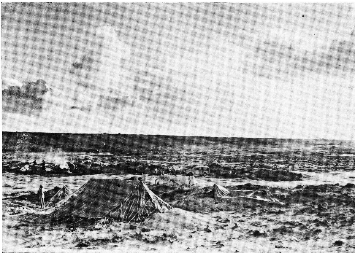
SAOB se frontperskamp by El Alamein. Die kamp was geleë tussen die pad in die kus naby die HK van 1 SA Divisie

Die statiese periode wat op El Alamein gevolg het, het min stories vir die Publisiteitsseksie vir versending na die tuisfront opgelewer. Dit het die gevaar meegebring dat die mense tuis belangstelling in die oorlog sou kon verloor. Gelukkig is in hierdie stil tyd die Victoria Cross aan sers Quentin Smythe toegeken. 'n Frontpersoffisier het die volgende dag hieroor die volgende brief aan die Hoofpersoffisier gestuur: