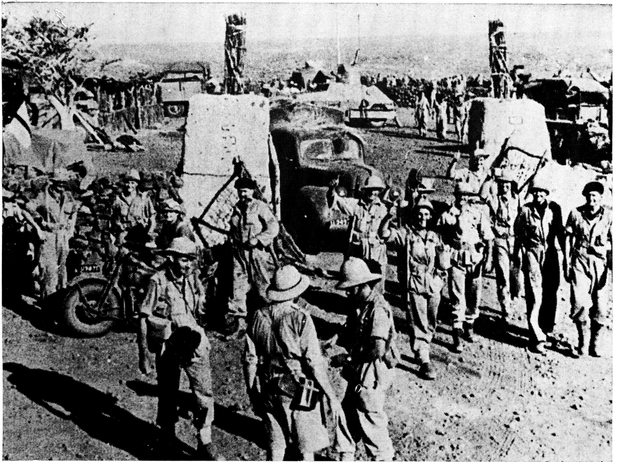
Gelukkige, glimlaggende Suid-Afrikaanse soldate stap uit by die hek van die Hobokfortifikasie 'n paar uur ná hul doelgerigte besetting deur middel van verskeie dienswapens en korpse van hierdie belangrike Italiaanse buitepos

in die versekering van buigsamheid teen die vyand, en andersyds in die moontlikmaak van 'n konsentrasie van hoogs diverse dienswapens op vyandelike doelwitte. Veral waar die vyand self eensydig was in sy opleiding, voorbereiding en toerusting vir oorlog, het die verskeidenheid van middele waarmee die Springbokke hom getakel het spoedig verwarring gesaai.