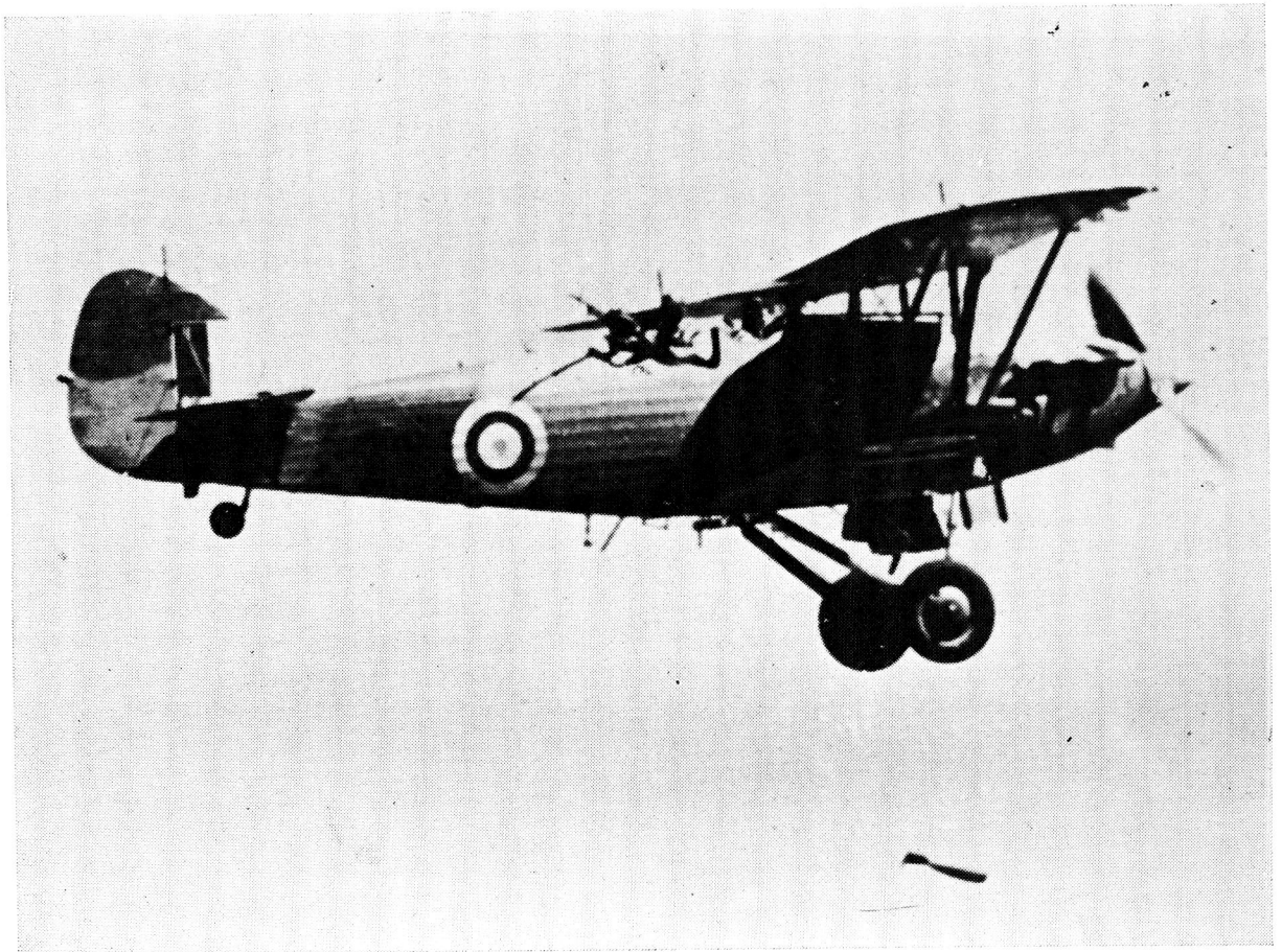
Op hierdie wyse bombardeer 'n Suid-Afrikaanse Hartbeest die stellings by Hobok voordat dit deur die vyand afgeskiet word

in die aangesig van intense kleingeweerlugafweervuur. Vir die opmerking deur die militêre historikus J. A. Brown dat nege Hartbeests aan die aanval deelgeneem het, kon geen redelike grond in enige rapporte gevind word nie. Soos reeds verduidelik, is een vliegtuig afgeskiet. 'n Reddingspatroolie uit die reserwekompanie is gestuur om die manne uit die wrak te red. Een ooggetuieverslag lui dat patroolielede die vlieënier en boordskutter by die wrak aangetref het besig om hewig, half skertsend, te argumenteer, terwyl laasgenoemde die vliegluitenant kritiseer omdat sy eie helm vol gate geskiet is!