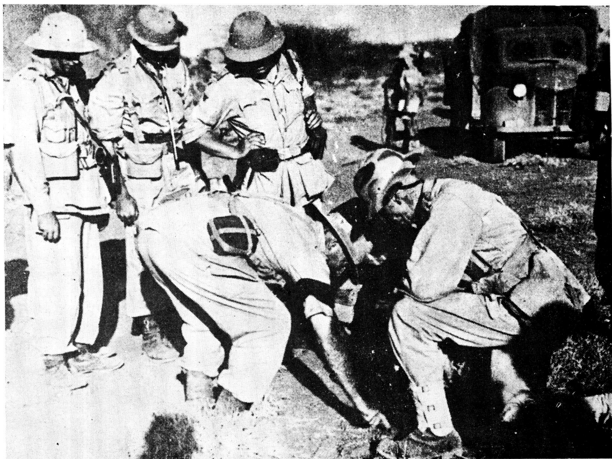
Een van die inligtingsoffisiere, 'n majoor, verbonde aan 5 SA Infanteriebrigadegroep hoofkwartier, teken 'n sketsplan vir die beplande aanval op Hobok in die sand ter verduideliking aan die twee infanteriebataljonbevelvoerders. Die Springbokaanmars en -aanval is gekenmerk deur puik voorafbeplanning en leierskap

die 1 SA Irish, wat by El Gumu deur 2 SA Infanteriebrigadegroep, ná laasgenoemde se sukses by Gorai, afgelos is.