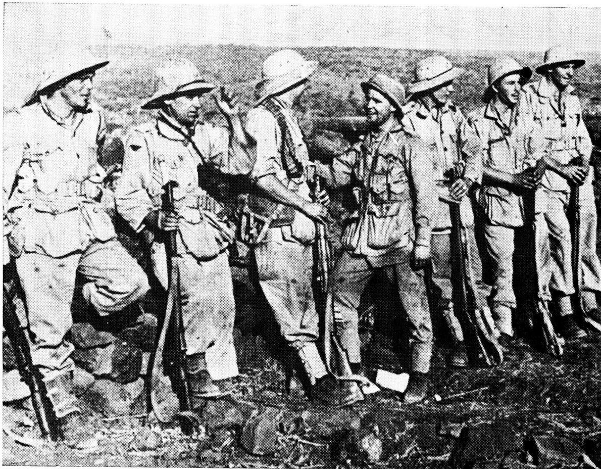
Infanteriste van die eenheid 3 Transvaal Scottish span vir 'n oomblikke teen 'n klipmuur by Hobok uit tydens die konsolidasie van die Suid-Afrikaanse posisie ná die suksesvolle stormloop teen hierdie voorpos

val. Vir baie 3 Transvaal Scottish-nuwelinge is hierdie hul vuurdoop. In een verslaggie meld 'n deelnemer dat, terwyl die voetvolk hier vasgepen word, wagtende op aanvalsbevele, een jongman met 'n grief teen sy peletonser-sant weens straf wat hom voor die aanval toegedien is, uitgevind het dat hy toevallig naby sy peletonleier dekking geneem het, en die geleentheid terdeë benut het om die offi-sier te versoek om vir 'n paar minute aandag aan hom te skenk sodat hy sy grief kon lug! Dieselfde verslaggie verwys na allerlei geskerts wat bo die masjiengeweevuur gehoor word. Iemand het byvoorbeeld uitgeroep: "Jy is 'n simpel vent, John. Vir weke lank skryf jy nooit huis toe nie. Jou mense sal bekommerd raak oor jou!", waarop die ene John terugroep: "Bekommerd oor my? Haaa! Nie helpste soveel soos ek op die oomblik oor myself bekommerd is nie!" In 'n ander gevegsektor waar 'n klein seksie die vyandelike vuur dapper beantwoord deur aanhoudend terug te skiet, word duidelik bo die geraas