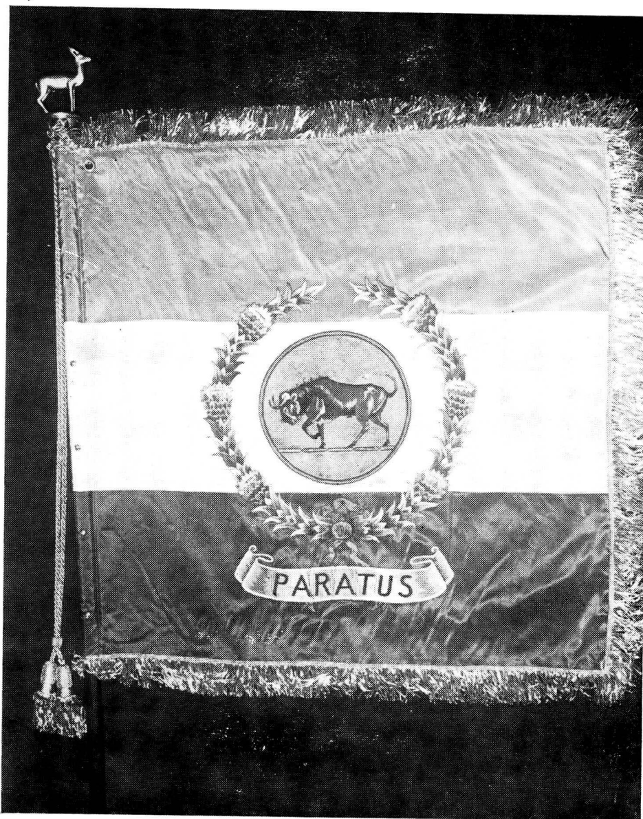
Die Leërkollege se vaandel.