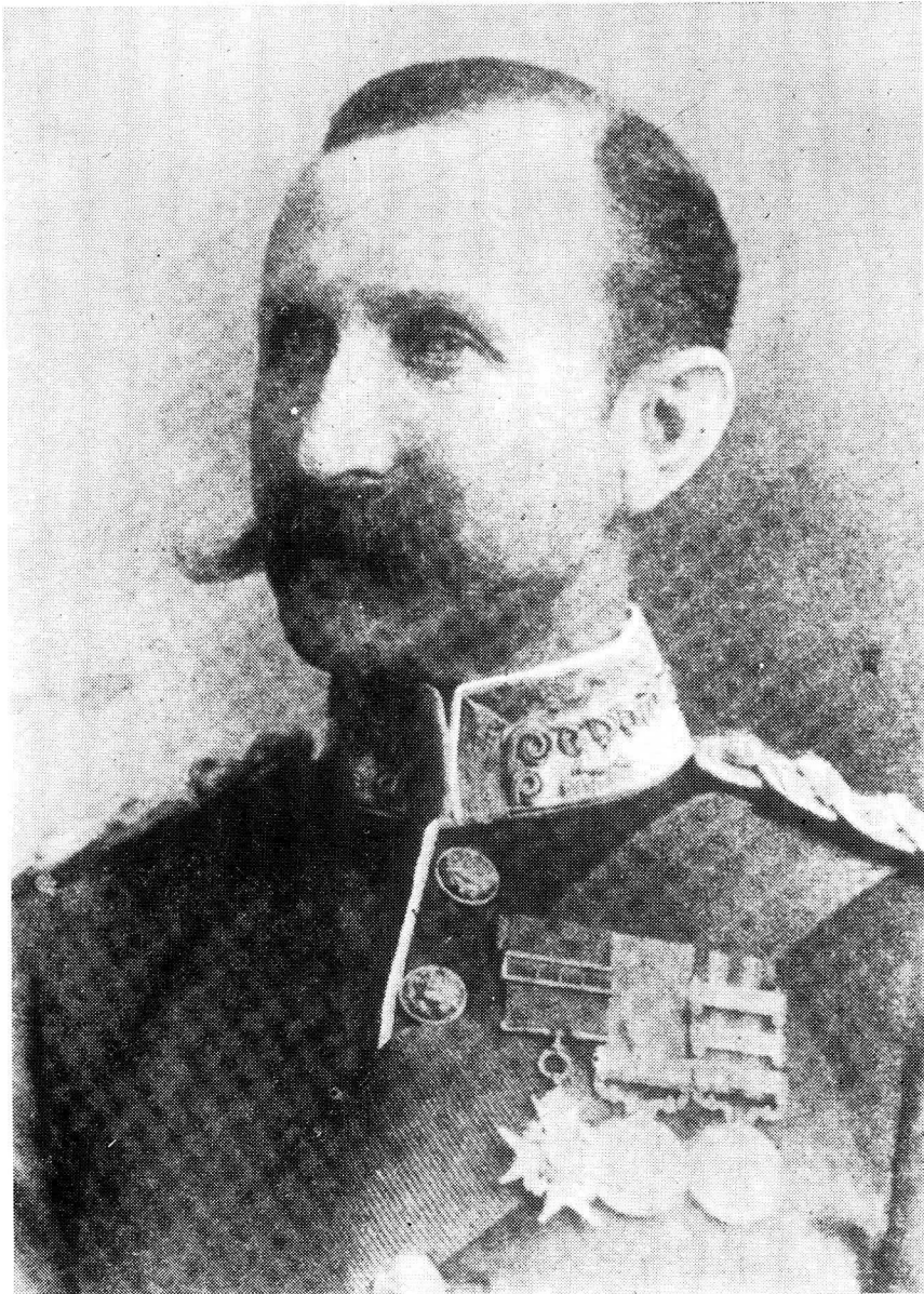
Gent-maj sir W. Penn-Symons, wat by Talana op 20 Oktober 1899 gesneuwel het