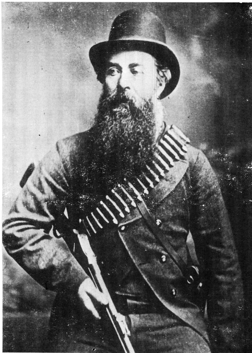
Genl P. A. Cronjé