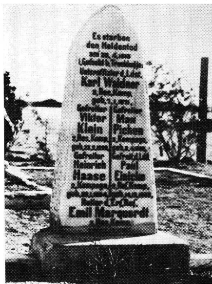
Duitse Oorlogsgrafte, Suidwes-Afrika.