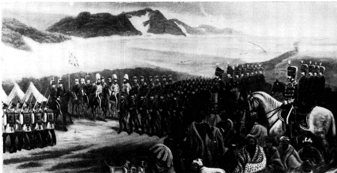
Aankoms van die Duitse Legioen in Oos-Londen (1857).