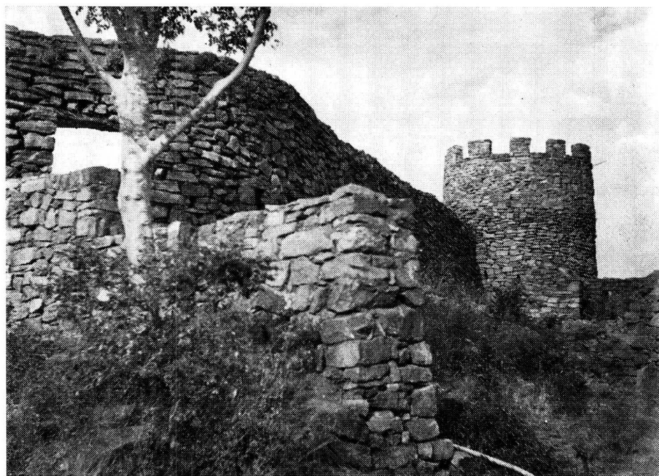
Die gerestoureerde Fort Merensky, voorheen bekend as Fort Wilhelm.